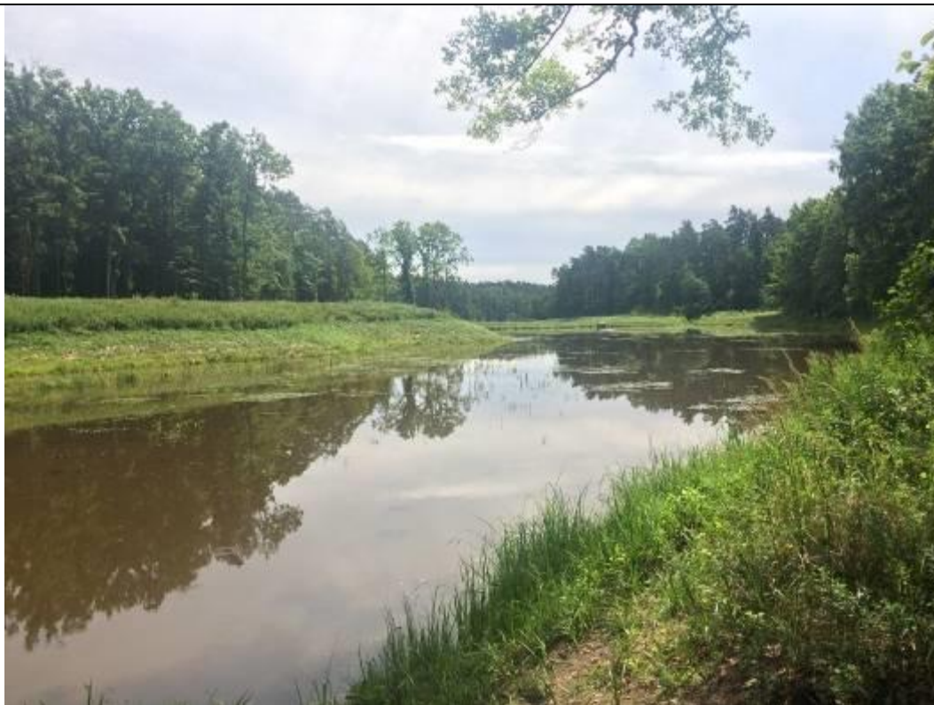
Pozostała część zbiornika retencyjnego, w którym odnotowano płazy.

Stanowisko nr B51E o pow. 11,7 ha jest to sztuczny zbiornik wodny, położony na terenie Lasów Państwowych – Nadleśnictwo Lubaczów, przy zachodniej granicy obszaru Natura2000, pełniący funkcję p.poż. oraz rekreacyjną (wypoczynek, wędkarstwo). W zbiorniku stwierdzono obecność ryb. Ze względu na płycizny, do których nie mają dostępu ryby, a także roślinność wodną i przybrzeżną miejscem rozmnażania się płazów (a w szczególności traszki grzebieniastej) są ujścia cieków i rowów melioracyjnych do zbiornika. Sam zbiornik jest zbyt rozległy i głęboki, by zapewnić płazom odpowiednie warunki do rozrodu, jednak obecność osobników dorosłych stwierdzono na wszystkich brzegach i w toni wodnej. W odległości do 500m nie przebiega żadna droga asfaltowa.