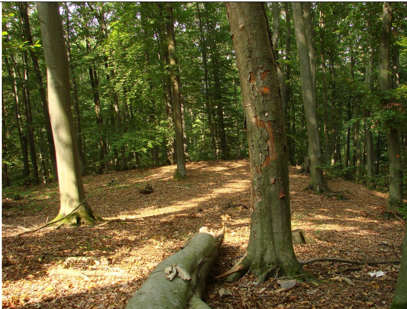
Fot. Reprezentatywny płat kwaśnej buczyny niżowej.