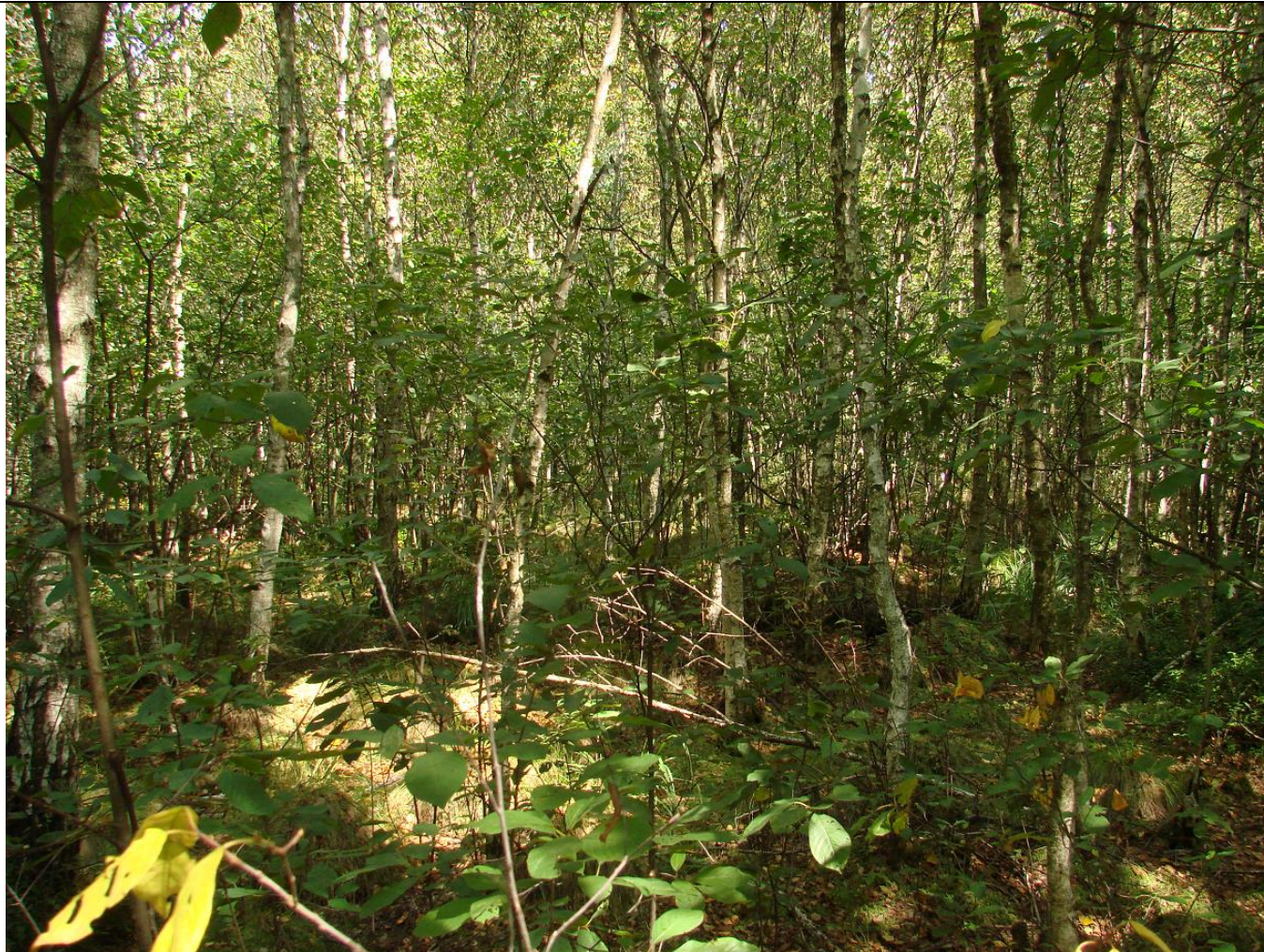
Fot. Płat boru bagiennego z dominacją brzozy omszonej Betula pubescens w drzewostanie.