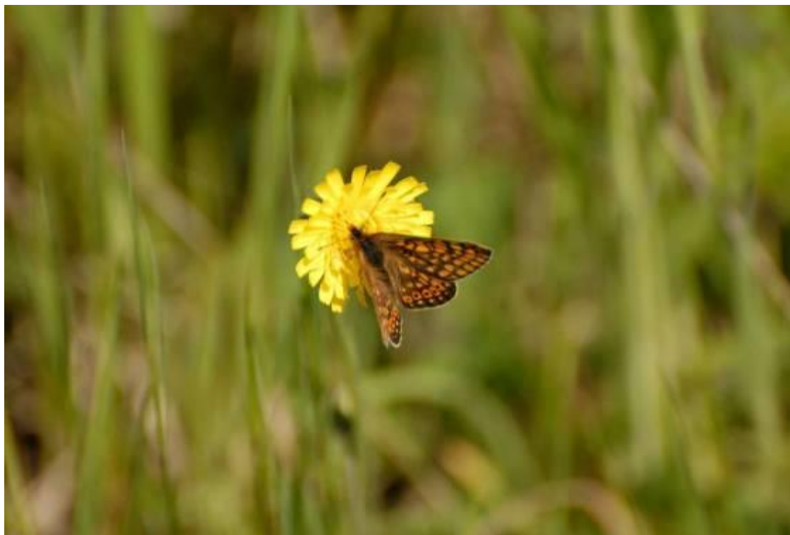
Fot. Przeplatka aurinia Euphydryas aurinia (Rottemburg, 1 775)

Zagrożenia potencjalne: Intensywne koszenie lub intensyfikacja, zaniechanie, brak koszenia, obce gatunki inwazyjne