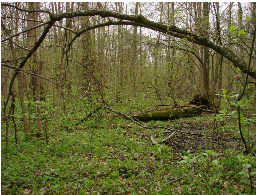
Fot. Las łęgowy z runem wiosennym.