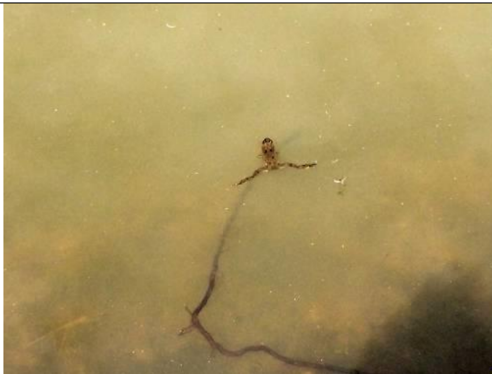
Kumak nizinny przy ujściu cieków wodnych w zbiorniku, w zachodniej części obszaru.

Stanowisko nr A5E0 o pow. 11,8 ha jest to sztuczny zbiornik wodny, położony na terenie Lasów Państwowych – Nadleśnictwo Lubaczów, przy zachodniej granicy obszaru Natura2000, pełniący funkcję p.poż. oraz rekreacyjną (wypoczynek, wędkarstwo). W zbiorniku stwierdzono obecność ryb. Ze względu na płyiczny, do których nie mają dostępu ryby, a także roślinność wodną i przybrzeżną miejscem rozmnażania się płazów (w tym kumaka nizinnego) są ujścia cieków i rowów melioracyjnych do zbiornika. Sam zbiornik jest zbyt rozległy i głęboki, by zapewnić płazom odpowiednie warunki do rozrodu, jednak obecność osobników dorosłych stwierdzono na wszystkich brzegach i w toni wodnej. W odległości do 500m nie przebiega żadna droga asfaltowa. Stan siedliska oceniono na U1.