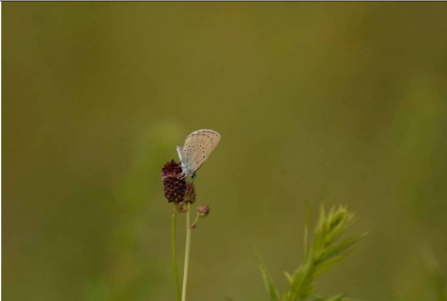
Fot. Modraszek telejus Phengaris (Maculinea) teleius (Bergstrasser, 1779)