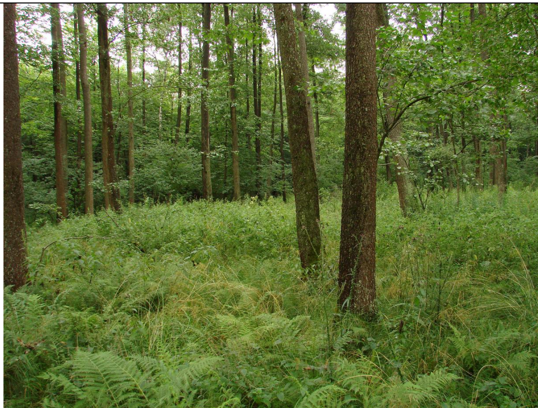
Fot. Fragment łągu olszowo-jesionowego.