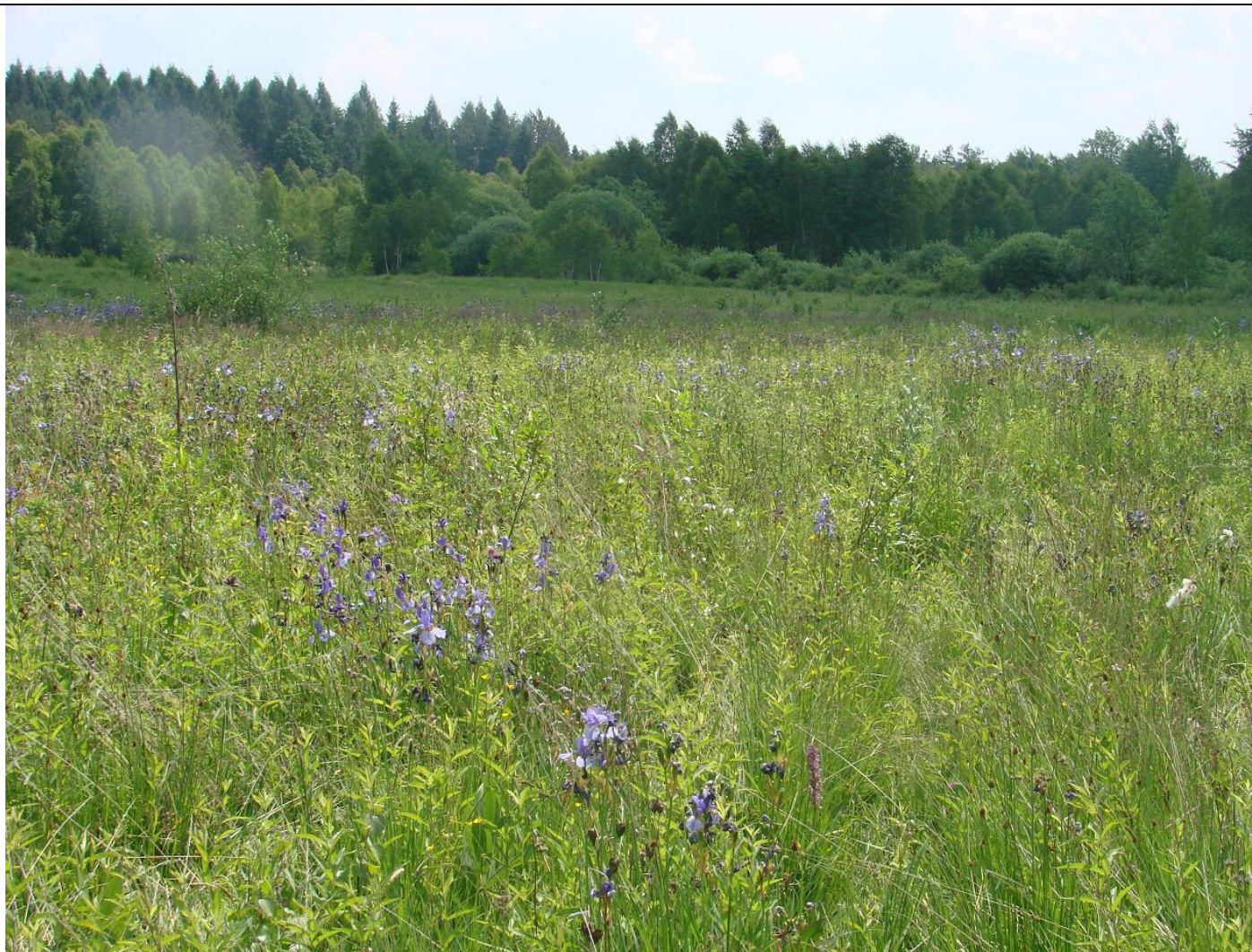
Fot. Fragment łąki trzęślicowej w kompleksie położonym na południowy-wschód od Majdanu Łukawieckiego z okazałą populacją kosańca