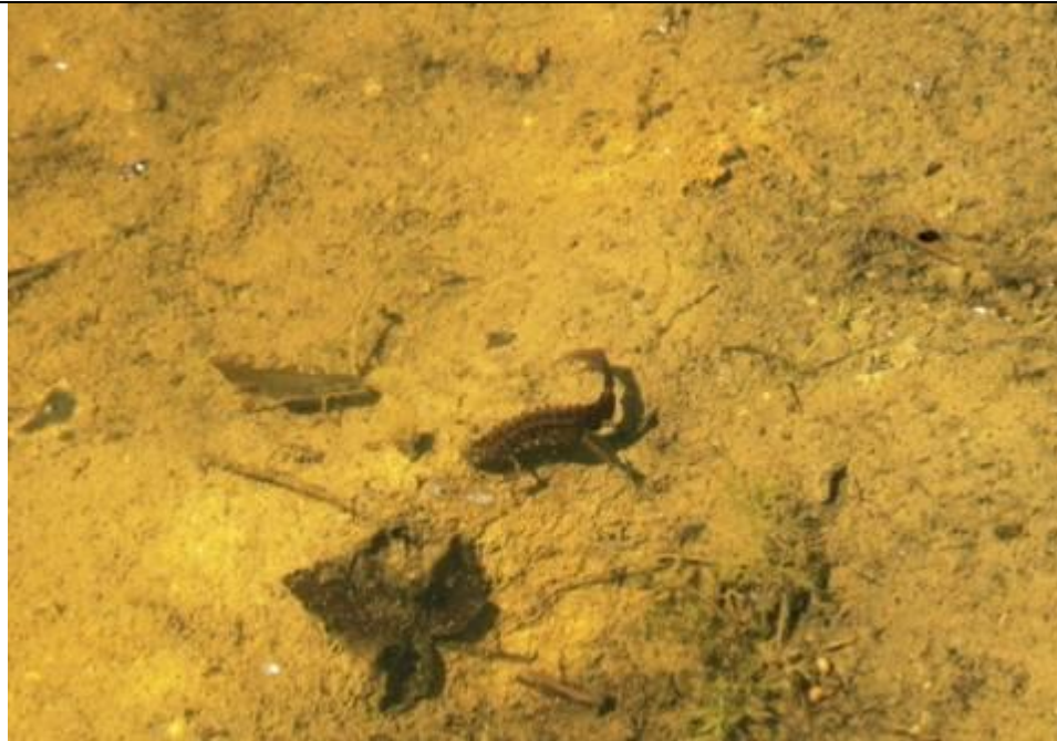
Gody traszki grzebieniastej w gliniance.

Stanowisko nr 8FA2 o pow. 0,17 ha jest bardzo małym oczkiem wodnym na dnie glinianki. To stanowisko traszki pokrywa się w 100% z jednym ze stanowisk ponikła kraińskiego. Położone jest w północno-wschodniej części obszaru Natura2000, w odległości około 100m od drogi asfaltowej. Porośnięte na dnie krzewami wierzby i znacznym udziałem trzciny pospolitej. Brzegi glinianki są bardzo strome, pozbawione roślinności. W maju obserwowano w wodzie zgromadzonej na dnie larwy i osobniki dorosłe traszki grzebieniastej (kilkanaście osobników), a także kilkadziesiąt kijanek żaby trawnej. W lipcu woda wyschła całkowicie. Najbliższym zbiornikiem, w którym stale utrzymuje się woda są wyrobiska kopalni piasku, położone w odległości około 300m od glinianki, poza obszarem Natura2000. Prawdopodobnie właśnie z wyrobisk pokopalnianych traszki migrowały do i z tego siedliska. Ze względu na występowanie w tym miejscu ściśle chronionego ponikła kraińskiego, a także z uwagi na dynamikę liczebności i preferowanie przez traszki grzebieniaste okresowo wysychających niewielkich zbiorników wodnych uznano, iż nie ma konieczności podejmowania działań ochronnych na tym stanowisku.