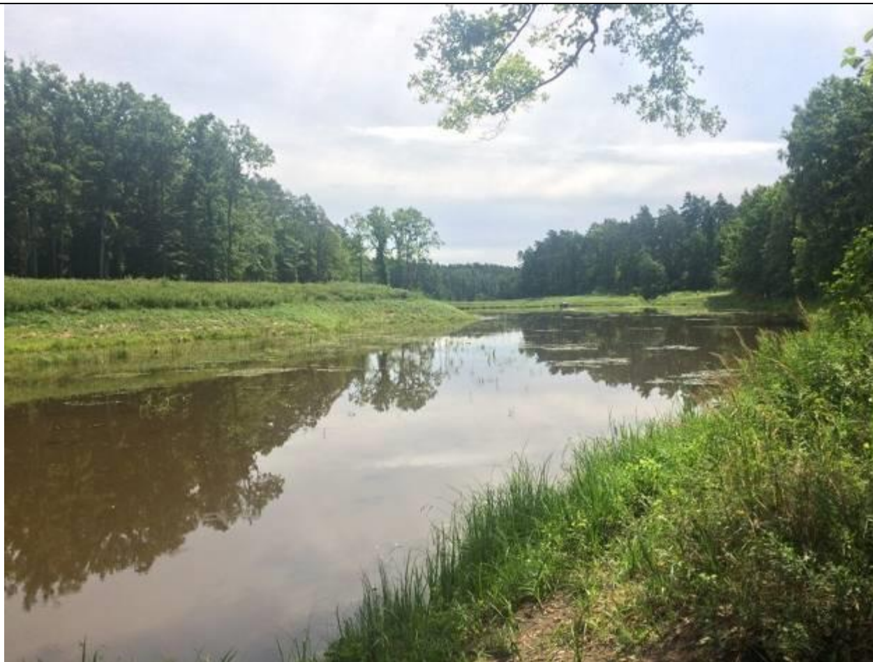
Zbiornik retencyjny w którym odnotowano gody kumaków.

W wyniku przeprowadzonych badań stan zachowania i perspektywy ochrony kumaka nizinnego i jego siedlisk ogólnie oceniono jako A.