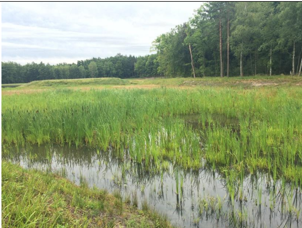
Pół-naturalny charakter górnej części zbiornika, w którym odnotowano gody kumaków.

Stanowisko nr A5B0 o pow. 3,4 ha jest zbiornikiem retencyjnym pełniącym funkcję p.poż. W górnej części zbiornik ma charakter naturalny, porośnięty zalany wodą olsem. Położone przy wschodniej granicy obszaru Natura2000, na obszarze Lasów Państwowych Nadleśnictwa Lubaczów. Ze względu na płyiczny, a także roślinność wodną i przybrzeżną miejscem rozmnażania się płazów (w tym kumaka nizinnego) jest górna część zbiornika o charakterze naturalnym. Sam zbiornik jest zbyt rozległy i głęboki, brzegi stosunkowo strome, umocnione ażurową płytą betonową przerośniętą roślinnością, by zapewnić płazom odpowiednie warunki do bytowania, dlatego nie został zakwalifikowany jako siedlisko