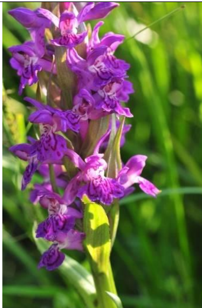
Fot. Kukułka plamista Dactylorhiza maculata .