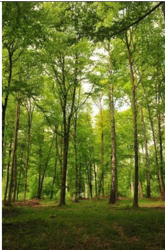
Fot. Widok ogólny lasu grądowego.