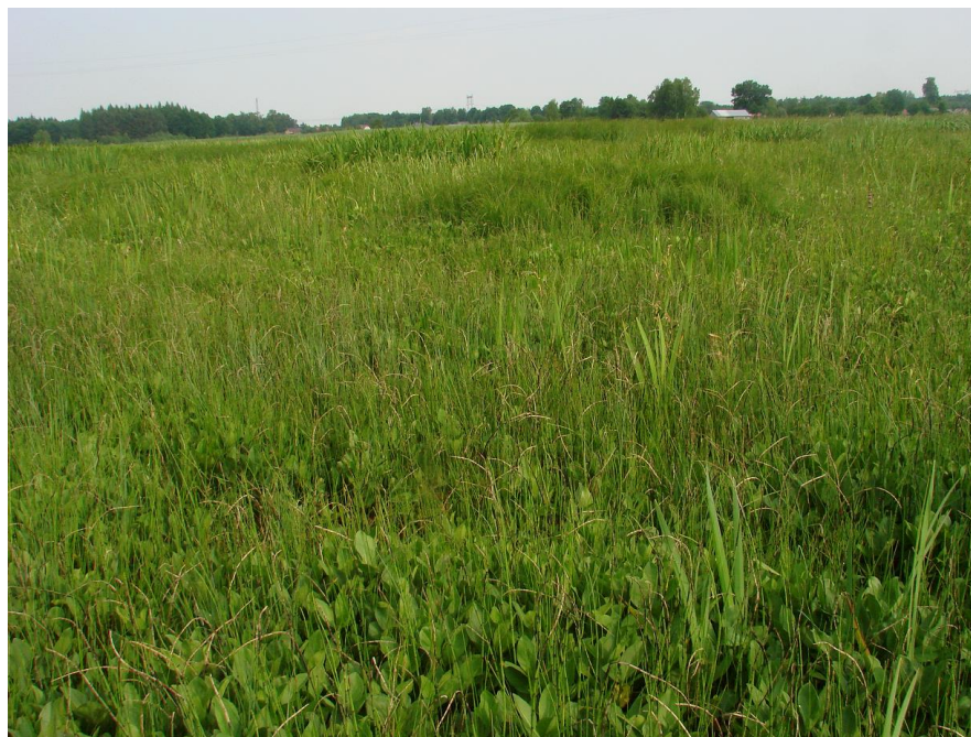
Fot. Fragment torfowiska nad rzeką Młagą z dominacją bobrka trójlistkowego Menyanthes trifoliata .