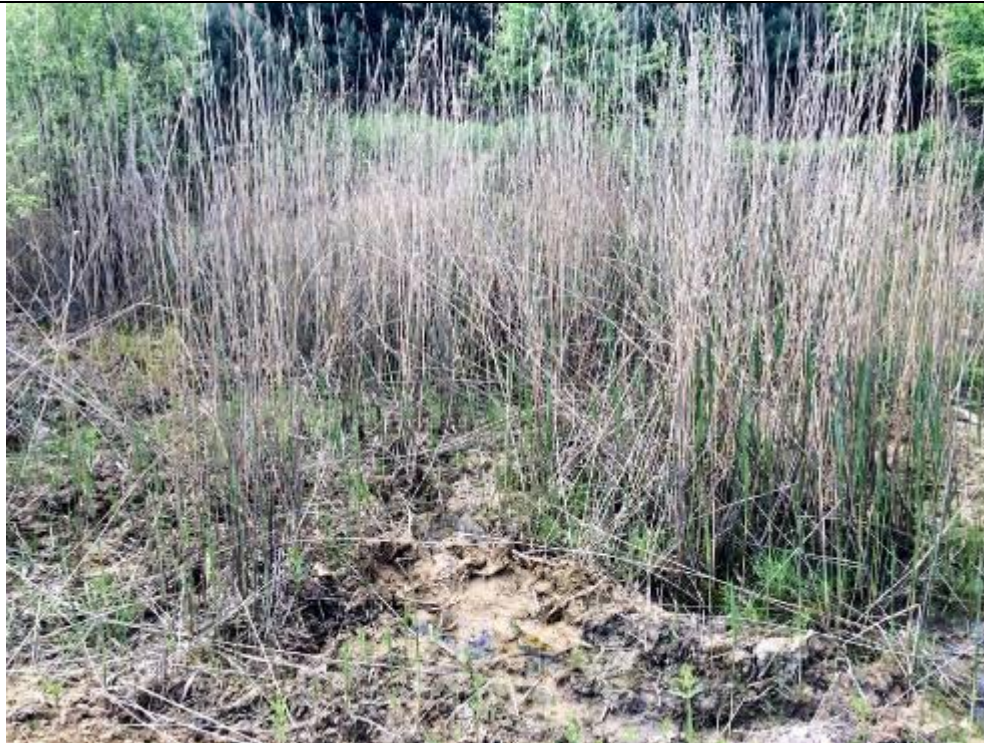
Glinianka w maju wypełniona wodą.