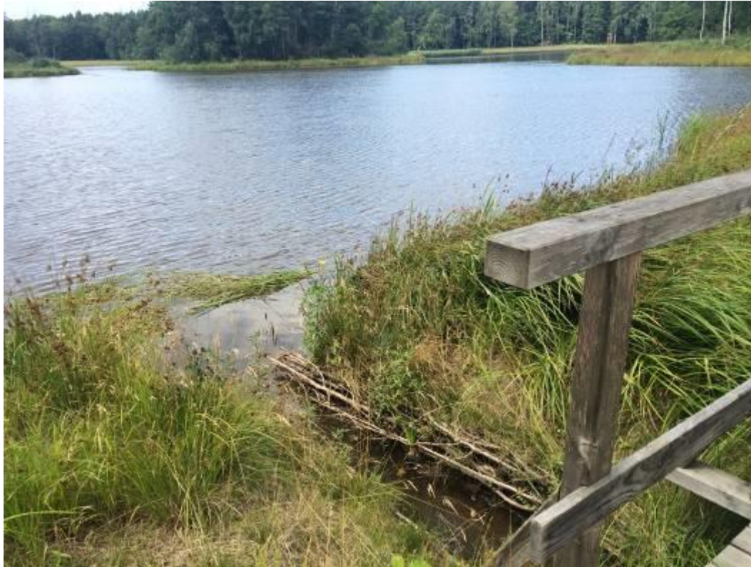
Ujście ciek wodnego do zbiornika w którym odnotowano płazy.