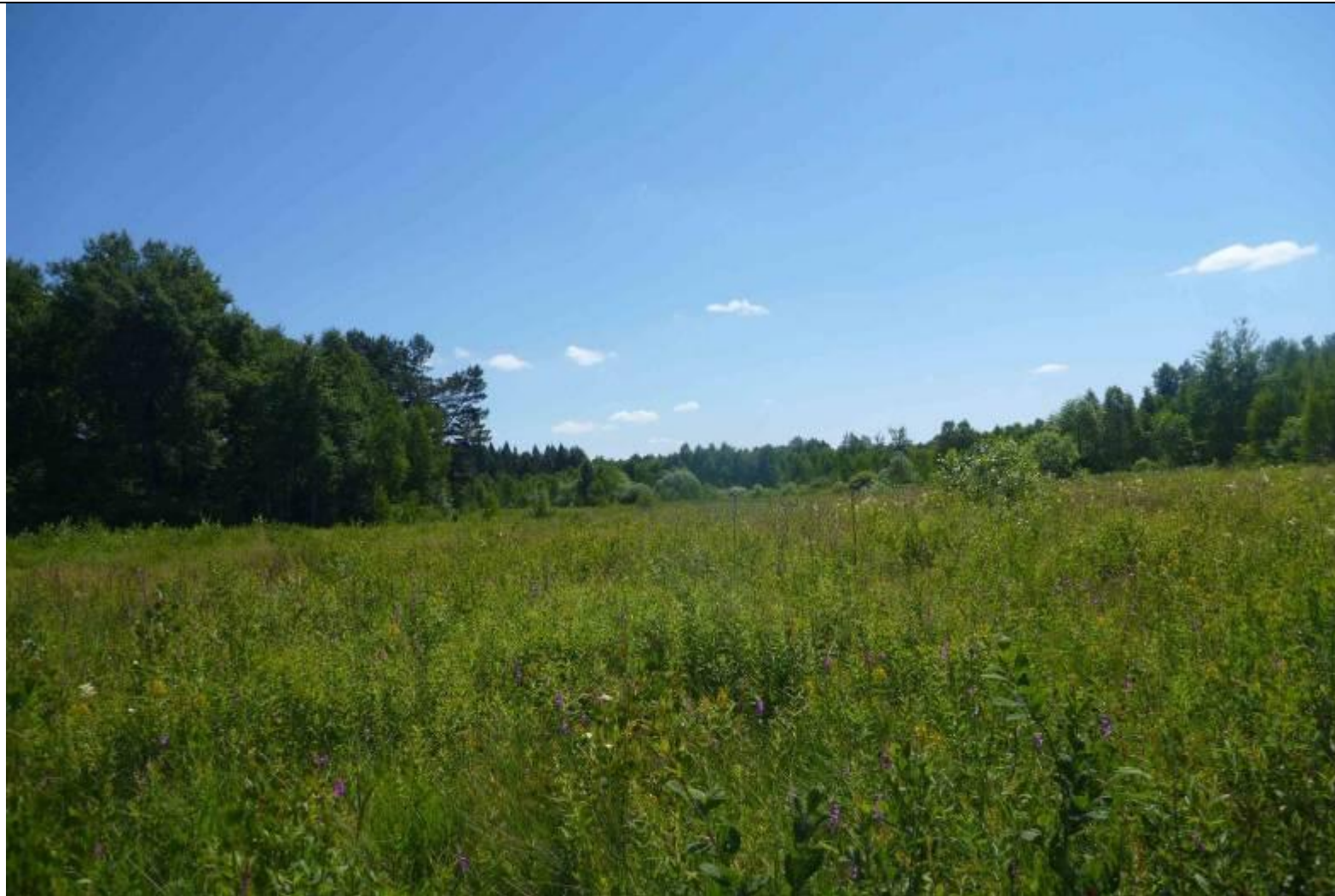
Fot. Siedlisko przeplatki aurinia Euphydryas aurinia (Rottemburg, 1 775)