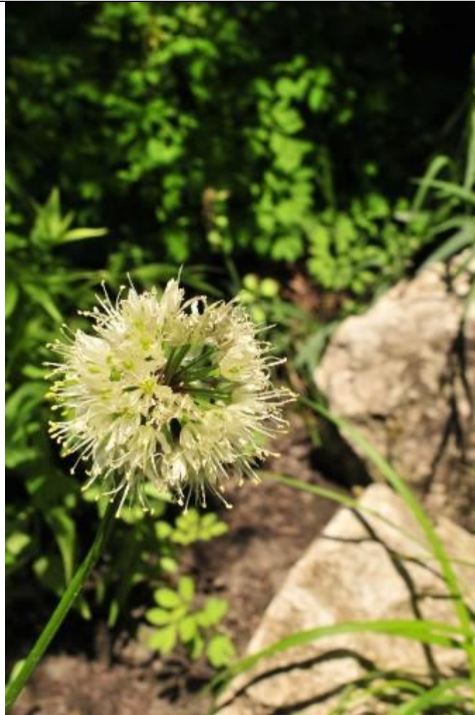
Fot. Czosnek siatkowaty Allium victorialis – płat w obrębie rezerwatu „Moczary”.