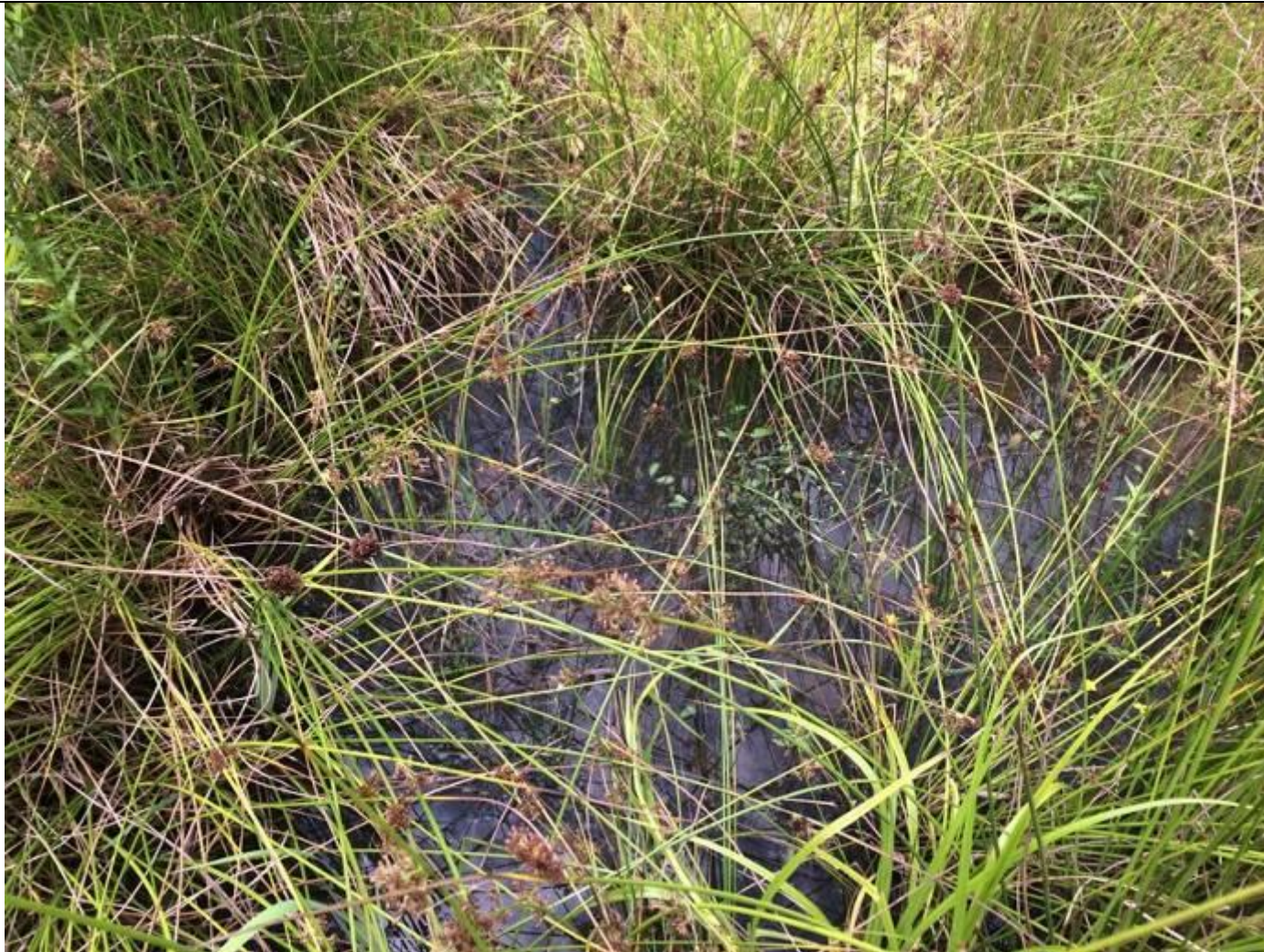
Wypłycenia przy ujściach cieków do zbiornika, w których godują i rozmnażają się kumaki nizinne.