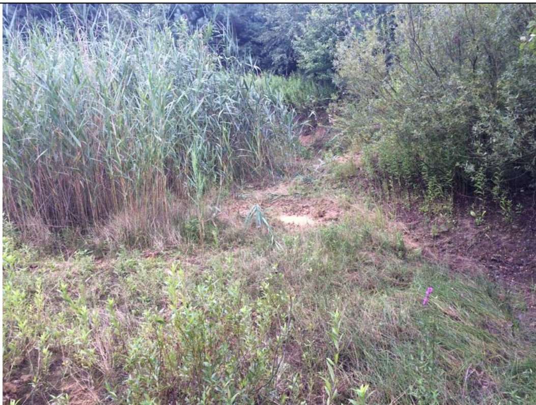
W lipcu woda w gliniance wyschła całkowicie.

Stanowisko nr 09E2 o pow. 2,5 ha jest najlepszym siedliskiem dla traszki grzebieniastej na badanym obszarze. Jest nim szereg kolejnych rozlewisk utworzonych na cieku wodnym w wyniku działalności bobrów. Położone są przy wschodniej granicy obszaru Natura2000, na obszarze Lasów Państwowych Nadleśnictwa Lubaczów. Stwierdzono, iż 9 takich rozlewisk jest zasiedlona przez bobry, a pozostałe 2 rozlewiska bobry opuściły, jednak utrzymuje się w nich woda. Ze względu na fakt, iż kolejne tamy i rozlewiska bobrów następują bezpośrednio po sobie (szeregowo) cały ten obszar potraktowano jako jedno siedlisko. Teren otaczają lasy, jednak drzewa nie powodują zacinienia toni wodnej. Rozlewiska przy tamach bobrów są głębokie nawet do 2m, rozległe, w dalszej części z licznymi płycznami i powalonymi drzewami, co stwarza