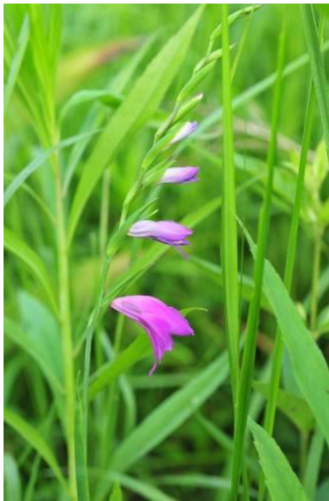
Fot. Mieczyk dachówkowy Gladiolus imbricatus .