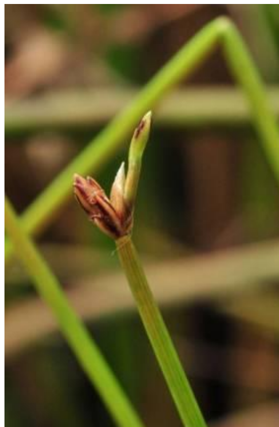
Fot. Ponikło kraińskie Eleocharis carniolica