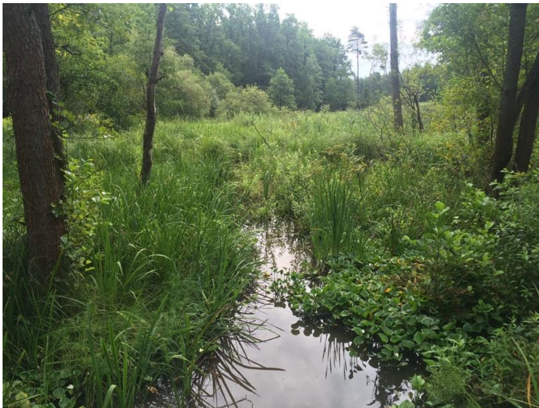
Naturalny charakter górnej części zbiornika.

populacji. W odległości do 500m nie przebiega żadna droga asfaltowa.