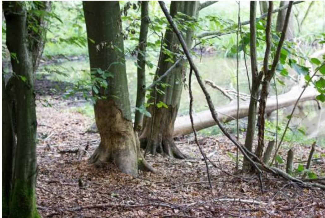
Jedno z kilkunastu rozlewisk bobrów, stanowiących siedlisko płazów

wyśmienite warunki dla płazów. W odległości do 500m nie przebiega żadna droga asfaltowa.