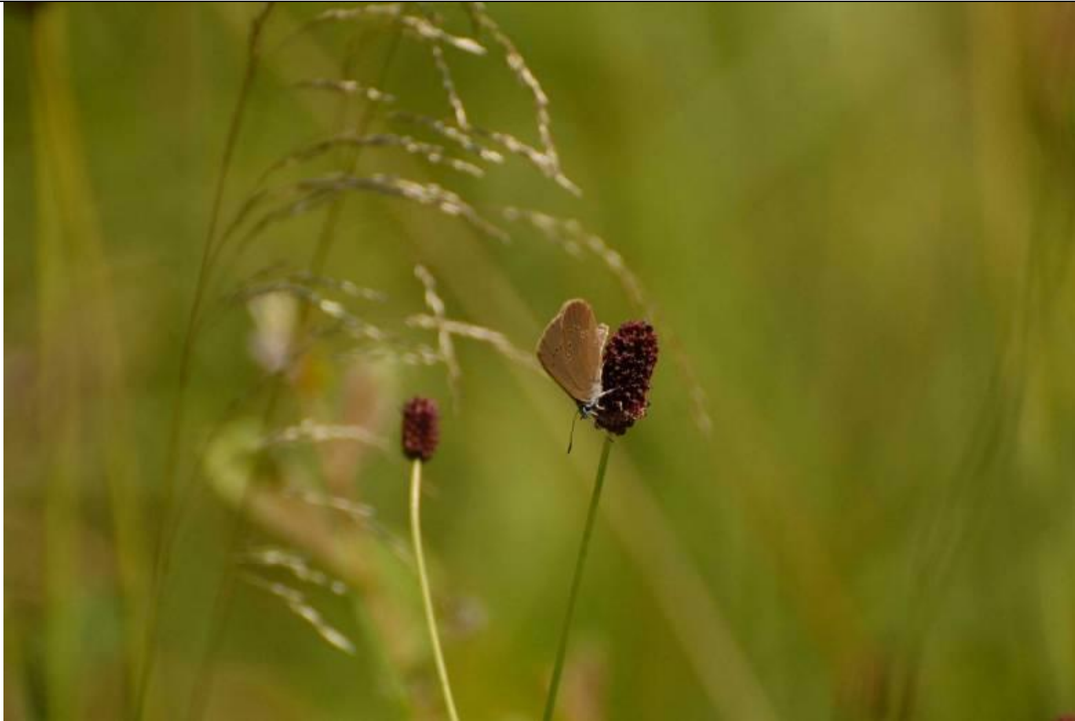
Fot. Modraszek nausitous Phengaris (Maculinea) nausithous (Bergstrasser, 1779)