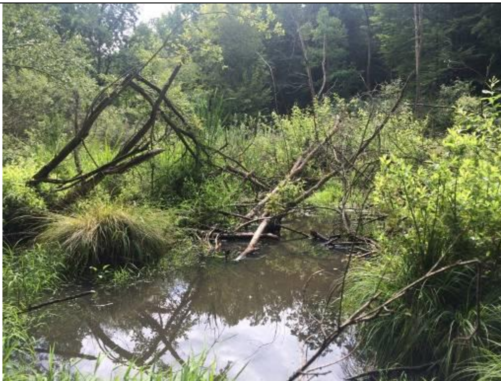
Jedno z kilkunastu rozlewisk bobrów, stanowiących siedlisko płazów

Stanowisko nr 1881 o pow. 3,4 ha jest zbiornikiem retencyjnym pełniącym funkcję p.poż. W górnej części zbiornik ma charakter naturalny, porośnięty zalany wodą olsem. Położone jest przy wschodniej granicy obszaru Natura2000, na obszarze Lasów Państwowych Nadleśnictwa Lubaczów. Ze względu na płycizny, a także roślinność wodną i przybrzeżną miejscem rozmnażania się płazów (w tym traszki grzebieniastej) jest górna część zbiornika o charakterze naturalnym. Sam zbiornik jest zbyt rozległy i głęboki, brzegi stosunkowo strome, umocnione ażurową płytą betonową przerośniętą roślinnością, by zapewnić płazom odpowiednie warunki do bytowania, dlatego nie został zakwalifikowany jako siedlisko. Zbiornik retencyjny przecina grobla po której biegnie droga asfaltowa. Użytkowana jest ona jednak wyłącznie w razie pożaru i przez samochody Nadleśnictwa (znak zakazu wjazdu na początku drogi, szlabany leśne) i dlatego nie stanowi istotnego wskaźnika mogącego zagrażać