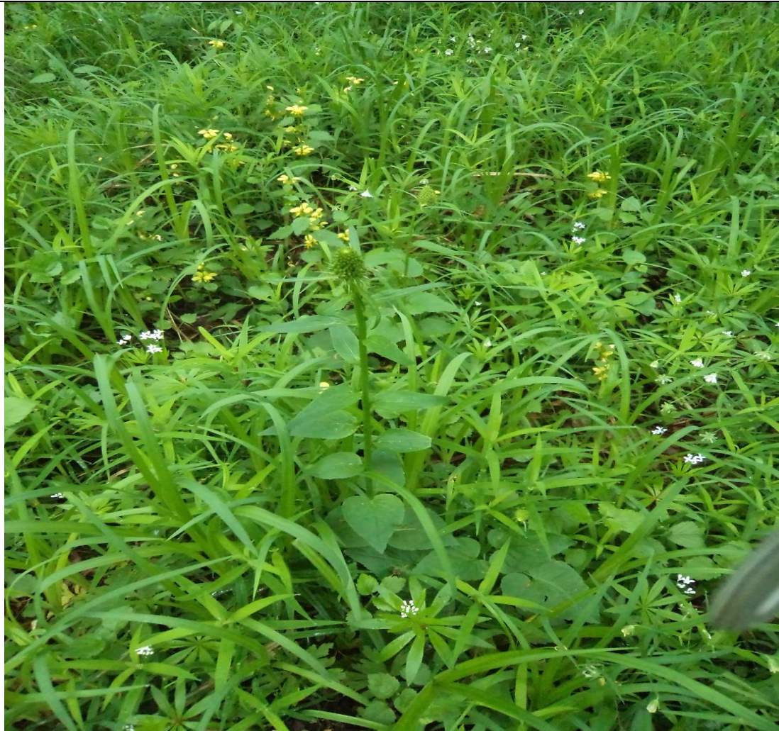
Fot. Fragment dobrze wykształconego runa łąkowego z zerwą kłosową Phyteuma spicatum .