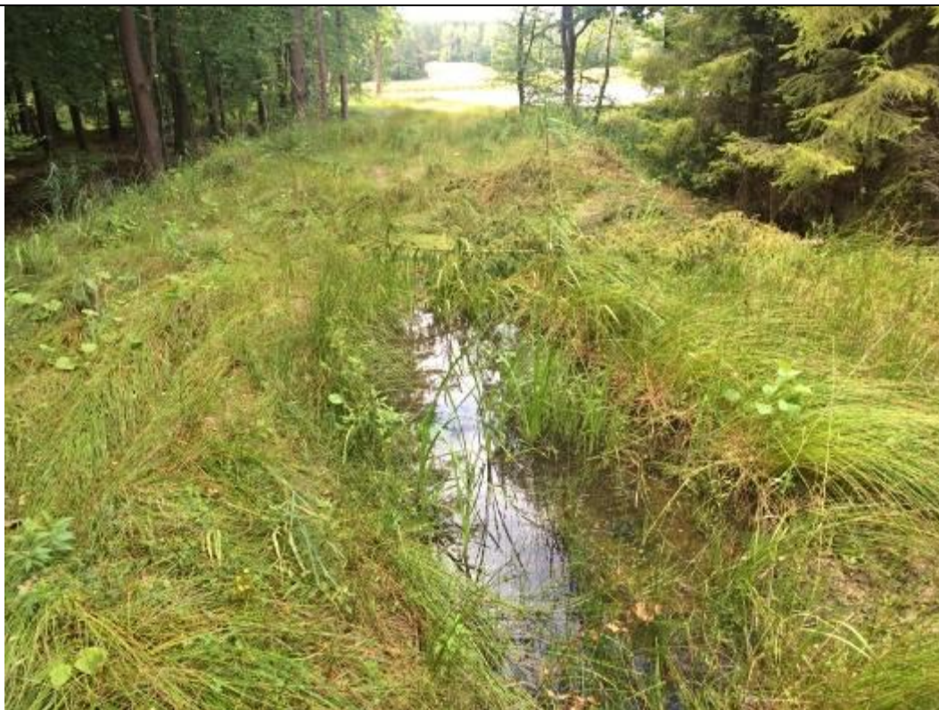
Stagnująca woda w rowie prowadzącym do zbiornika, w którym odbywają się gody i rozród traszek.

W wyniku przeprowadzonych badań stan zachowania i perspektywy ochrony traszki grzebieniastej i jej siedlisk ogólnie oceniono jako B.