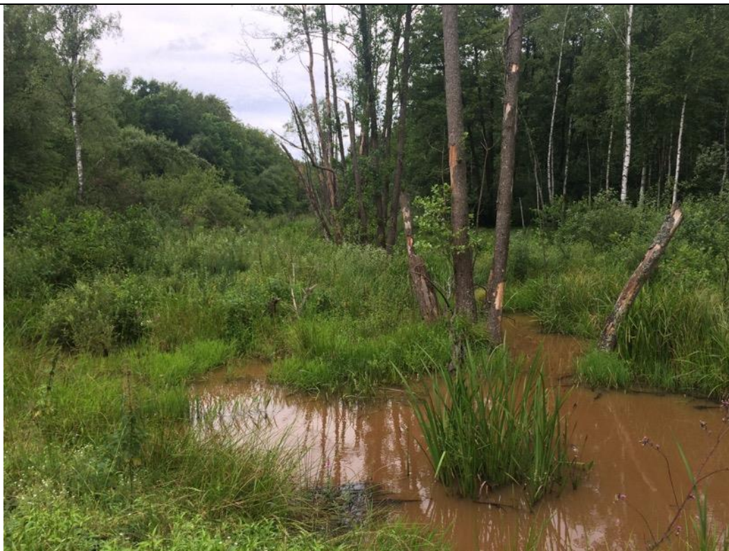
Rozlewiska bobrów stanowiące siedliska godowe i rozrodu kumaków. W dniu poprzednim wystąpiły silne opady i burze, stąd zmętnienie wody.