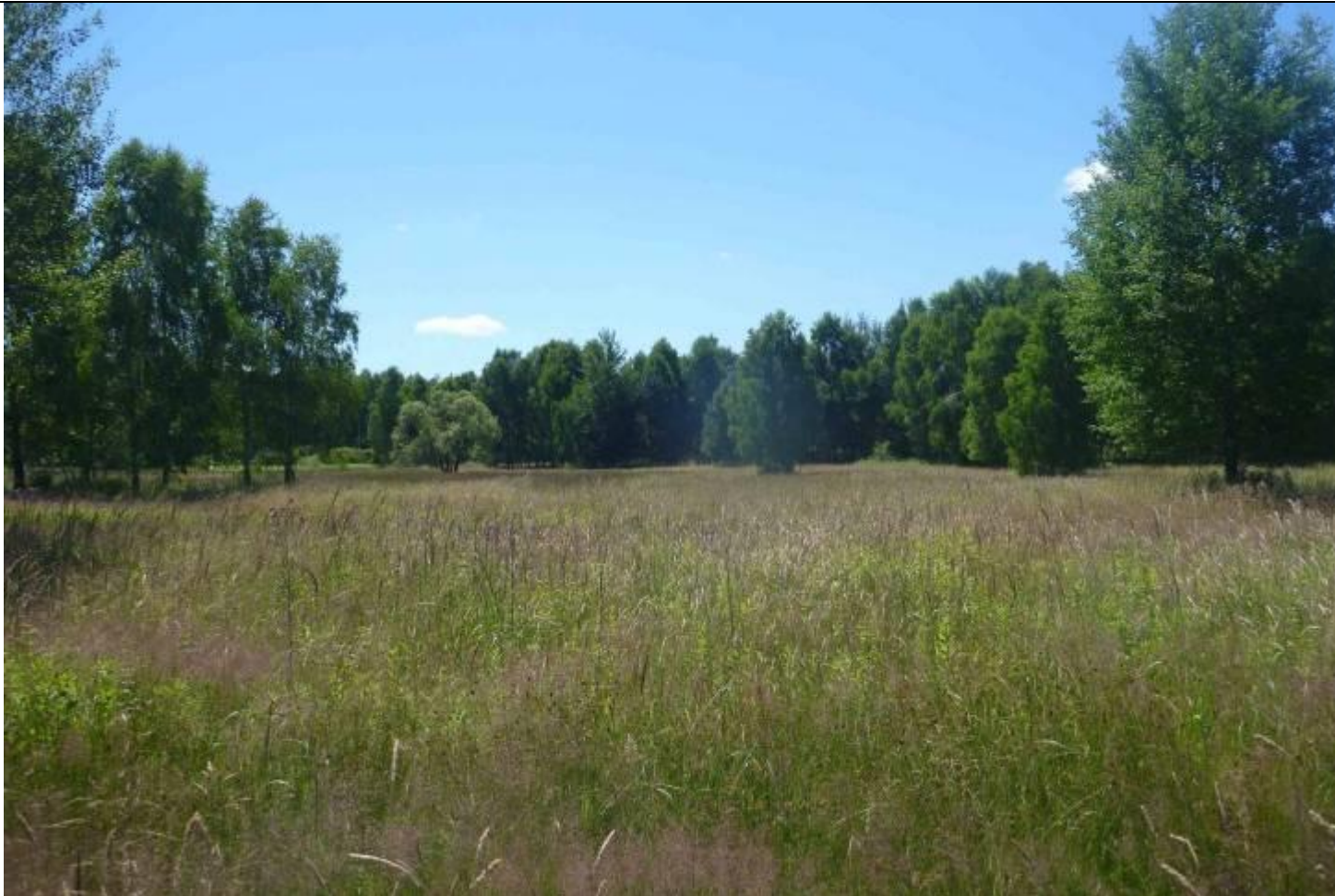
Fot. Siedlisko czerwńczyka nieparka Lycaena dispar Haworth 1802