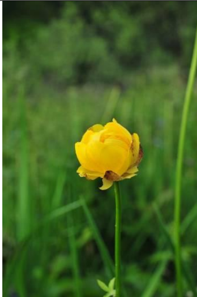
Fot. Pełnik europejski Trollius europaeus .