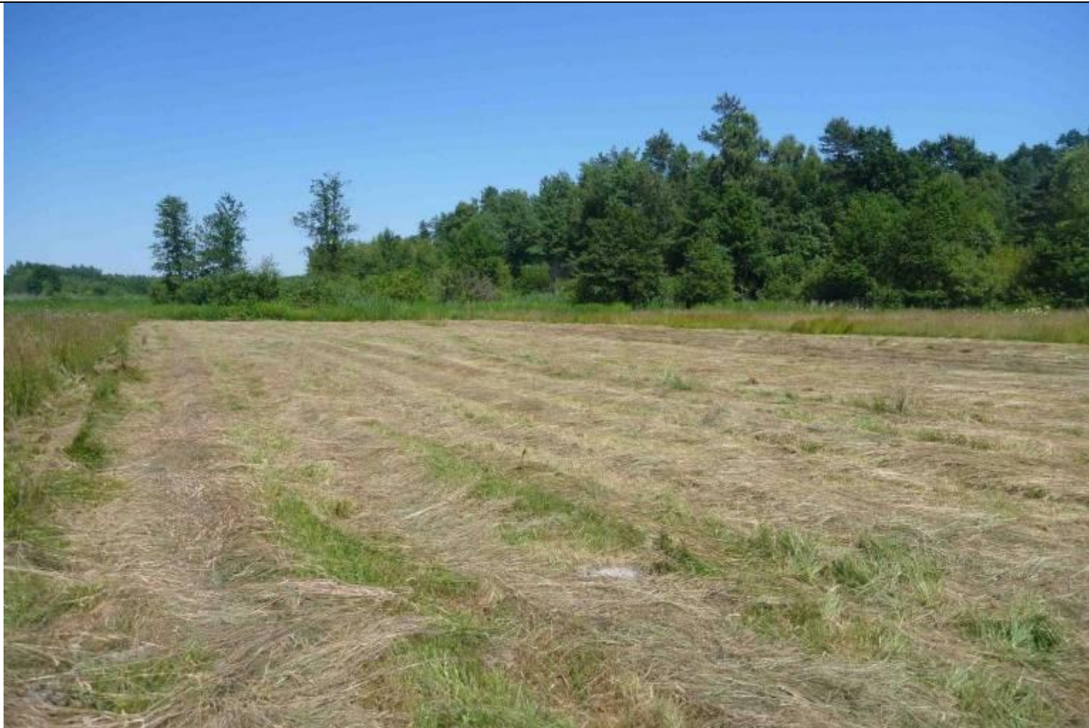
Fot. Siedlisko modraszkek nausitous wykoszone w nieodpowiednim terminie