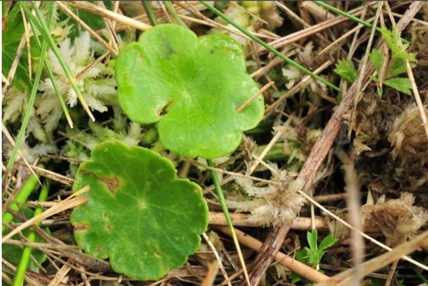
Fot. Wąkrota zwyczajna Hydrocotyle vulgaris