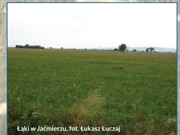
Łąki w Jaćmierzu

Łąki z okolic Jaćmierza w przeszłości miały charakter łąk podmokłych, jednak kilka lat przed II wojną światową zostały zmeliorowane, co zmieniło ich skład gatunkowy. Obecnie są to wilgotniejsze postaci łąk rajgrasowych z udziałem niektórych gatunków łąk wilgotnych.