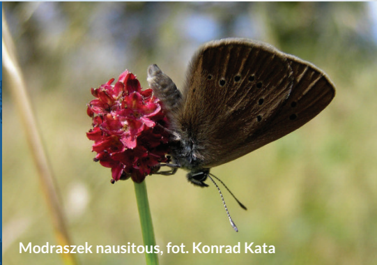
Modraszek nausitous, fot. Konrad Kata

Celem ochrony jest utrzymanie powierzchni i składu gatunkowego ekstensywnie użytkowanych łąk oraz cennej lepidopterofauny.