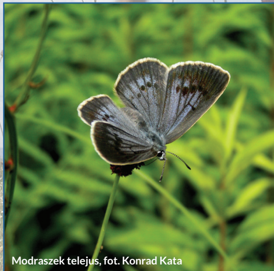
Modraszek telejus

W obszarze zdiagnozowano jeden z największych płatów tradycyjnie użytkowanych i bogatych w gatunki łąk w łuku Karpat (rodzaj siedliska z załącznika I Dyrektywy Siedliskowej 65/10). Przetrvanie tego siedliska możliwe będzie jednak pod warunkiem utrzymania ekstensywnej gospodarki (wykaszanie).