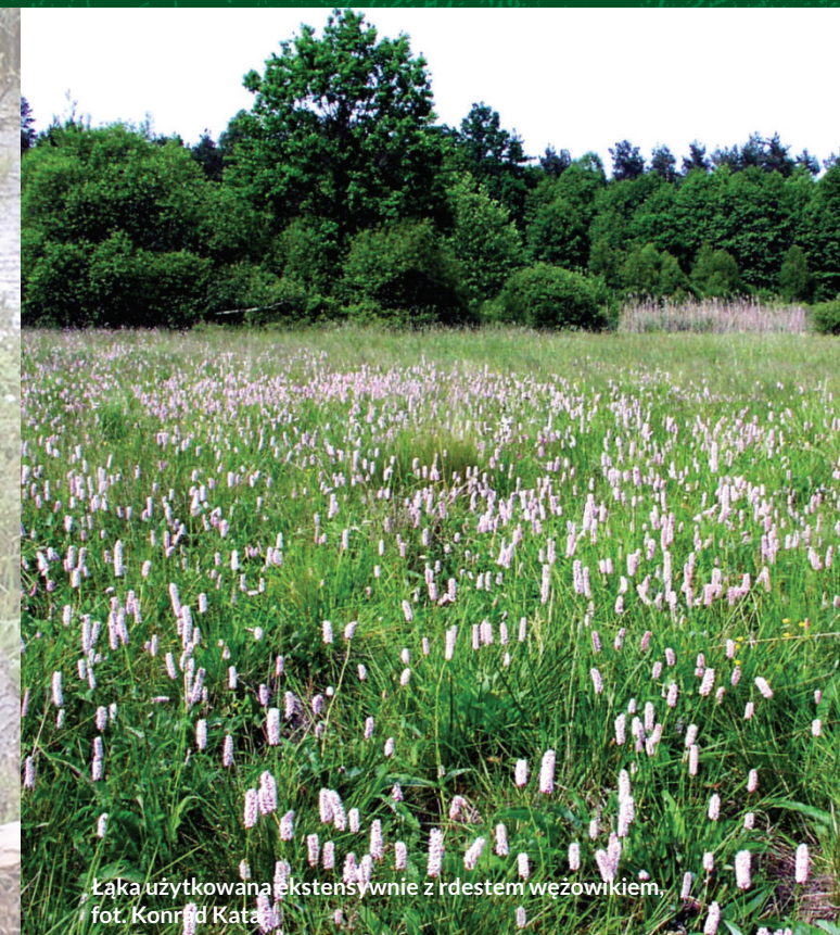
Łąka użytkowana ekstensywnie z rdestem weżówkiem.