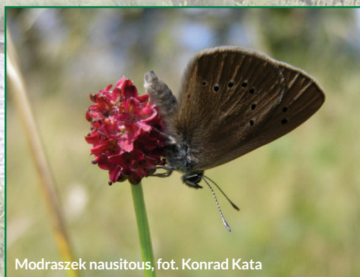
Modraszek nausitous

świeżych i wilgotnych. Występują tu cztery gatunki motyli ujęte w załączniku II Dyrektywy Siedliskowej: czerwończyk fioletek Lycaena helle , czerwończyk nieparek Lycaena dispar , modraszek telejus Maculinea teleius oraz modraszek nausitous Maculinea nausithous , którym towarzyszy kilka innych gatunków motyli, nieujętych w Dyrektywie, ale rzadkich w naszym kraju.