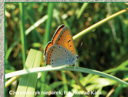
Czerwończyk nieparek

Podstawowym walorem przyrodniczym ostoi jest bogata lepidopterofauna związana z fitocenozą łąk