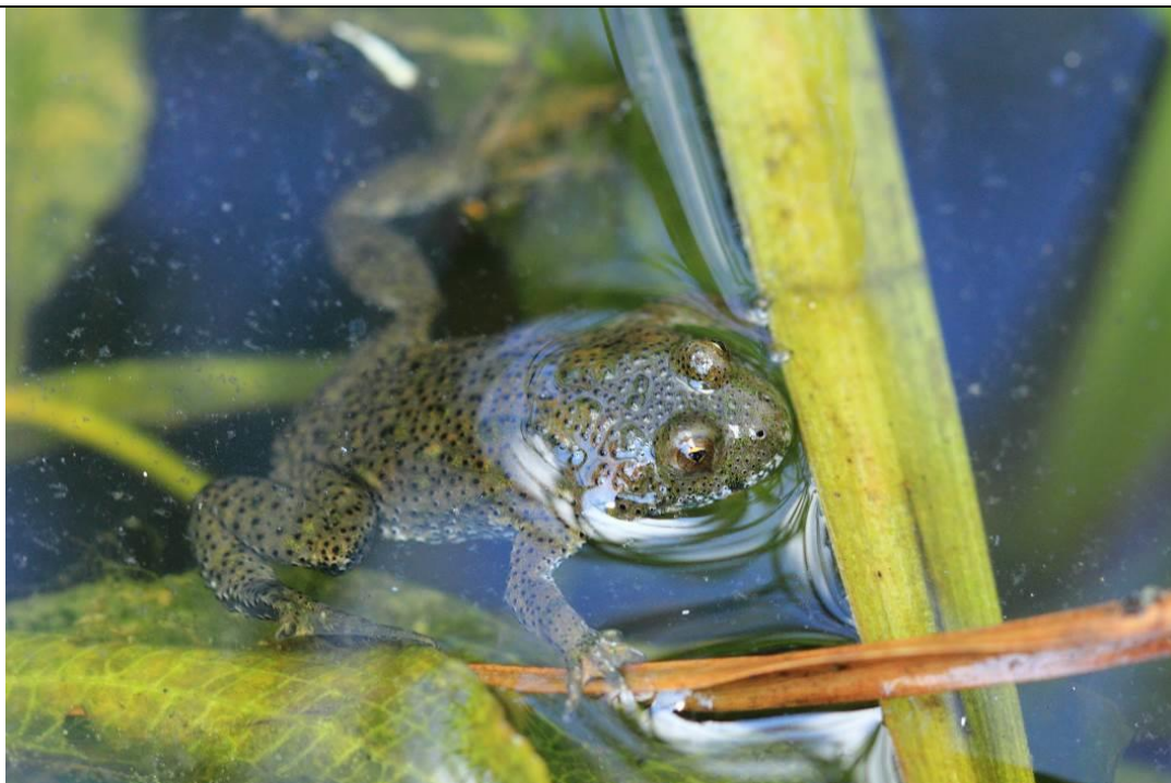
Kumak nizinny