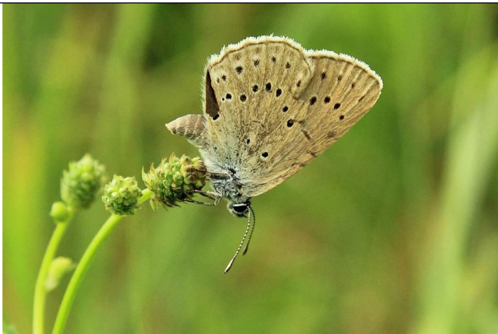
Modraszek telejus Phengaris teleius