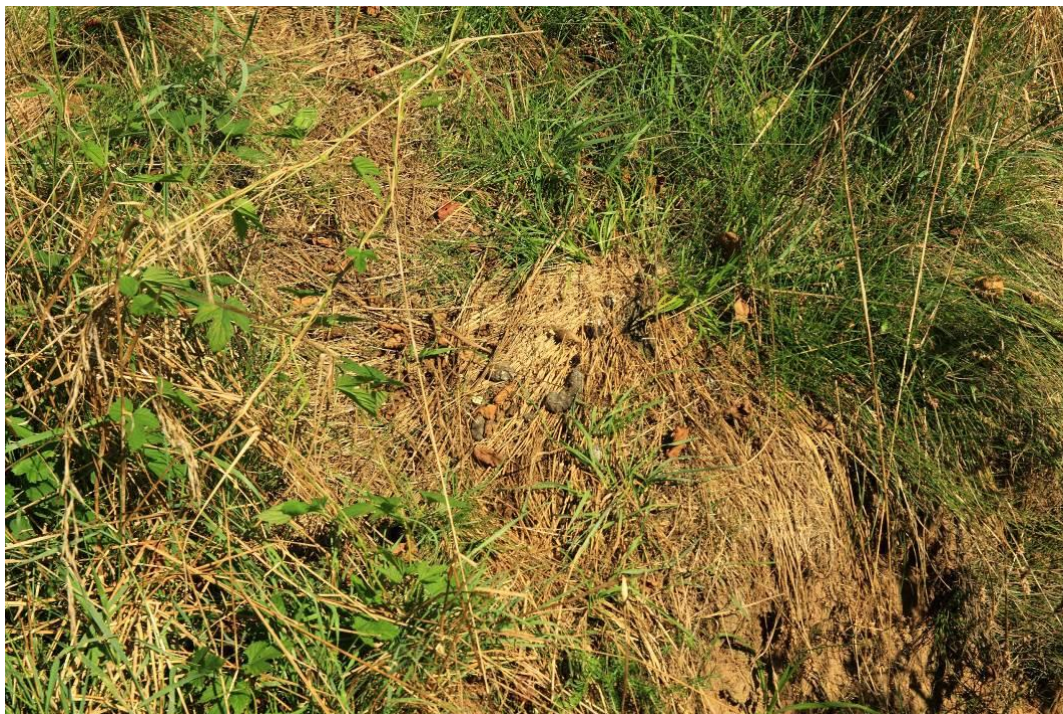
Odchody wydry

Ocena populacji: D – populacja nieistotna.