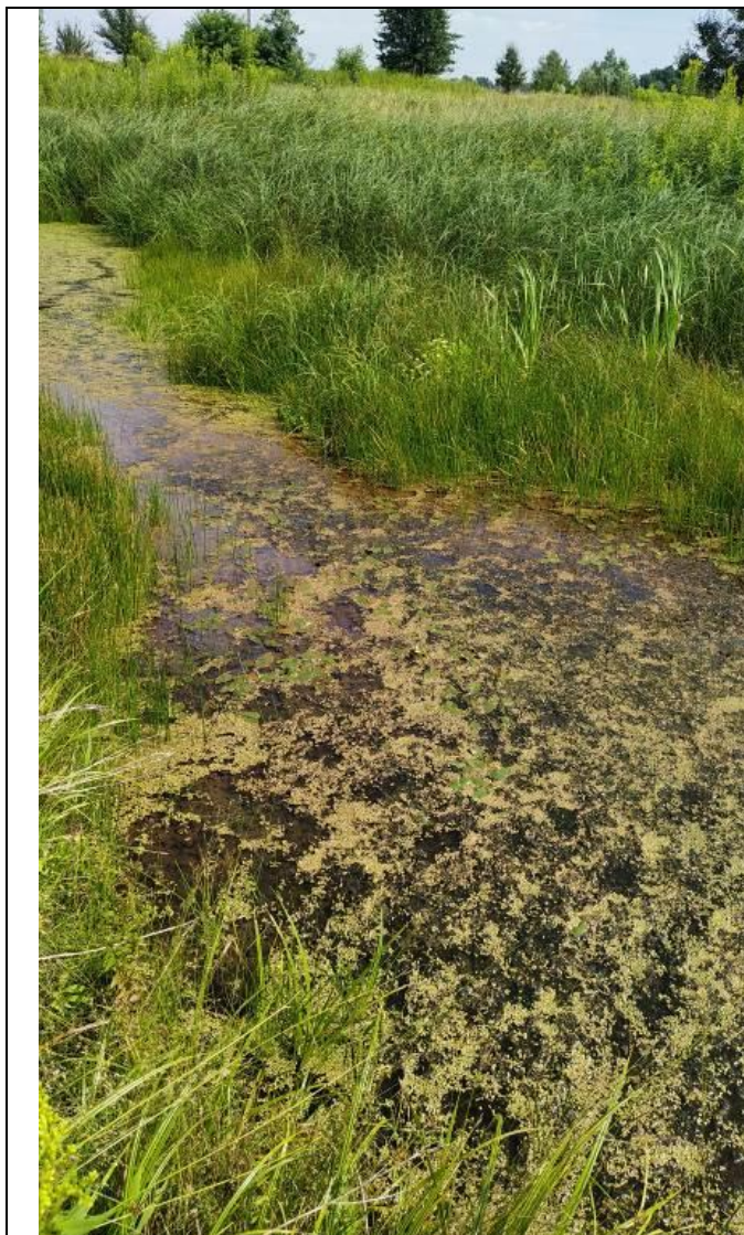
Fragment starorzecza