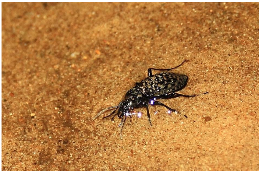
Biegacz urozmaicony

Nadane oceny dotyczą wyłącznie gatunku zlokalizowanego w części obszaru objętej opracowaniem. W związku z tym, iż opracowaniem objęto tylko niewielką część obszaru.