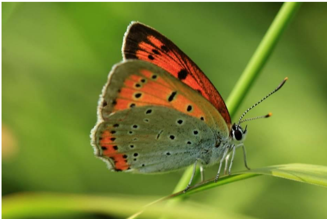
Czerwończyk nieparek