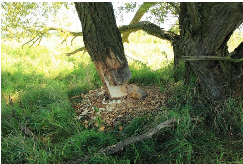
Ślad żerowania bobra

Ocena populacji D – populacja nieistotna.