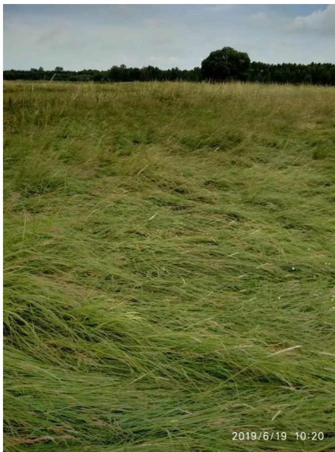
Zniekształcony płat na skutek nieregularnego koszenia

Gorzej zachowane płaty, ocenione na U1, charakteryzują się zaburzonym składem gatunkowym. W dużej mierze należą tutaj płaty o niewłaściwej gospodarce kośnej np. nieregularnie koszone. Zwykle liczba gatunków typowych jest niewielka oraz niskie są ich stopnie pokrycia. Rozprzestrzeniają się na nich ekspansywne gatunki rodzime takie jak np. trzcinnik piaskowy Calamagrostis epigajos , ostrożeń polny Cirsium arvense czy wiązówka błotna Filipendula ulmaria . Niską ocenę uzyskiwały również płaty intensywnie wypasane, gdzie również skład gatunkowy był ubogi.