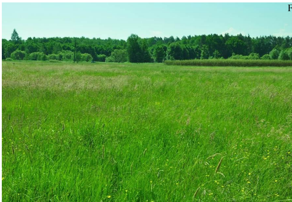
Fragment dobrze zachowanej łąki świeżej

Siedlisko 6510 jest reprezentowane przez 15 płatów o różnej powierzchni i różnym stanie zachowania. Zlokalizowane są w różnych częściach obszaru głównie nad rzeką Trzebośnica. Płaty najlepiej wykształcone charakteryzują się dużą liczbą gatunków typowych dla siedliska. Zespół Arrhenatherum elatioris reprezentowany jest głównie przez rajgras wyniosły Arrhenatherum elatius , ale pojawia się również bodziszek łąkowy Geranium pratense . Ze związku Arrhenatherion elatioris najczęściej, chociaż o niskim stopniu pokrycia, rosną dzwonek rozpierzchły Campanula patula , pępawa dwuletnia Crepis biennis i przytulia pospolita Galium mollugo . Liczne są gatunki z rzędu Molinietalia i klasy Molino-Arrhenatheretea np. krwawnik pospolity Achillea millefolium , wyczyniec łąkowy Alopecurus pratensis , kupkówka pospolita Dactylis glomerata , marchew zwyczajna Daucus carota , kłosówka wełnista Holcus lanatus czy brodawnik zwyczajny Leontodon hispidus .