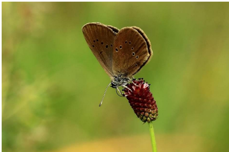
Modraszek nausitous