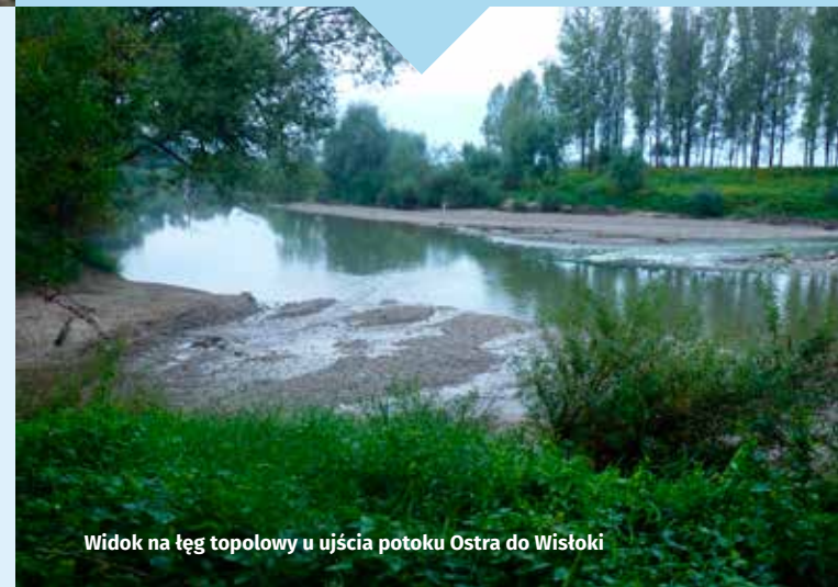
Widok na łąg topolowy u ujścia potoku Ostra do Wisłoki

W obrębie Wisłoki, jak i jej dopływów największe powierzchnie zajmują łągi wierzbowe, zarówno w postaci dojrzałej – Salicetum albo-fragilis , jak i inicjalnej – Salicetum triandro-viminalis . Terasy Wisłoki, w znacznym stopniu porośnięte są krzewiastymi formacjami wierzb wąskolistnych, pozostających w kompleksie przestrzennym z niżowymi ziołotołami nadrzeczными i pozostałościami, często w postaci