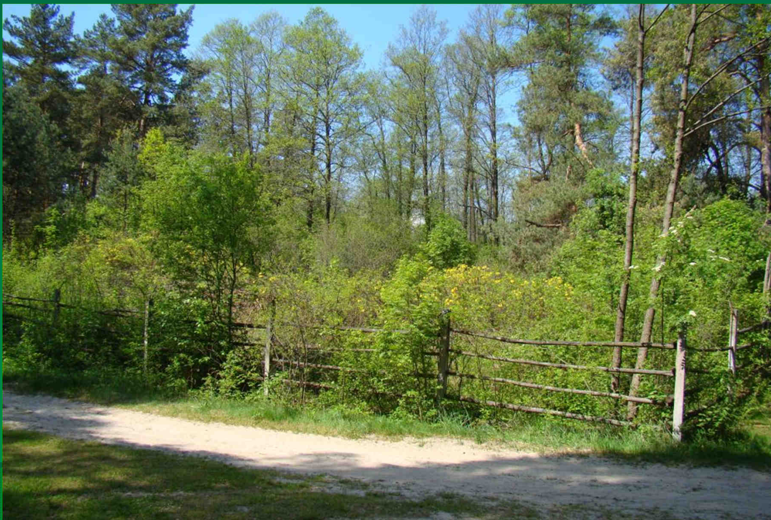
Widok rezerwatu od strony północno-wschodniej