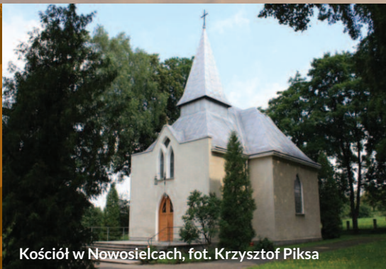
Kościół w Nowosielcach

Celem ochrony w tym obszarze jest zachowanie kolonii rozrodczych nocka dużego oraz utrzymanie właściwego stanu siedlisk przyrodniczych wykorzystywanych przez nietoperze jako żerowisko.