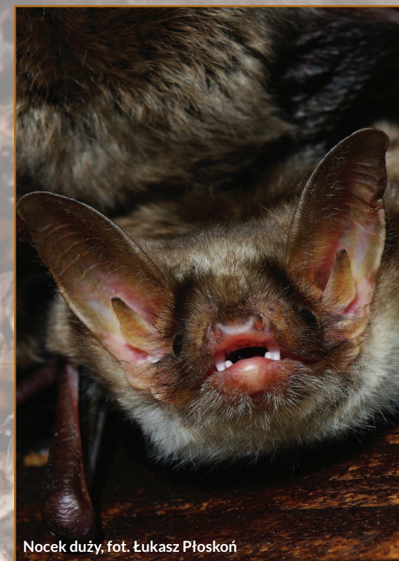
Nocek duży

W ostoi znajduje się jedna z największych znanych w województwie podkarpackim kolonii rozrodczych nocka dużego Myotis myotis , będącego gatunkiem