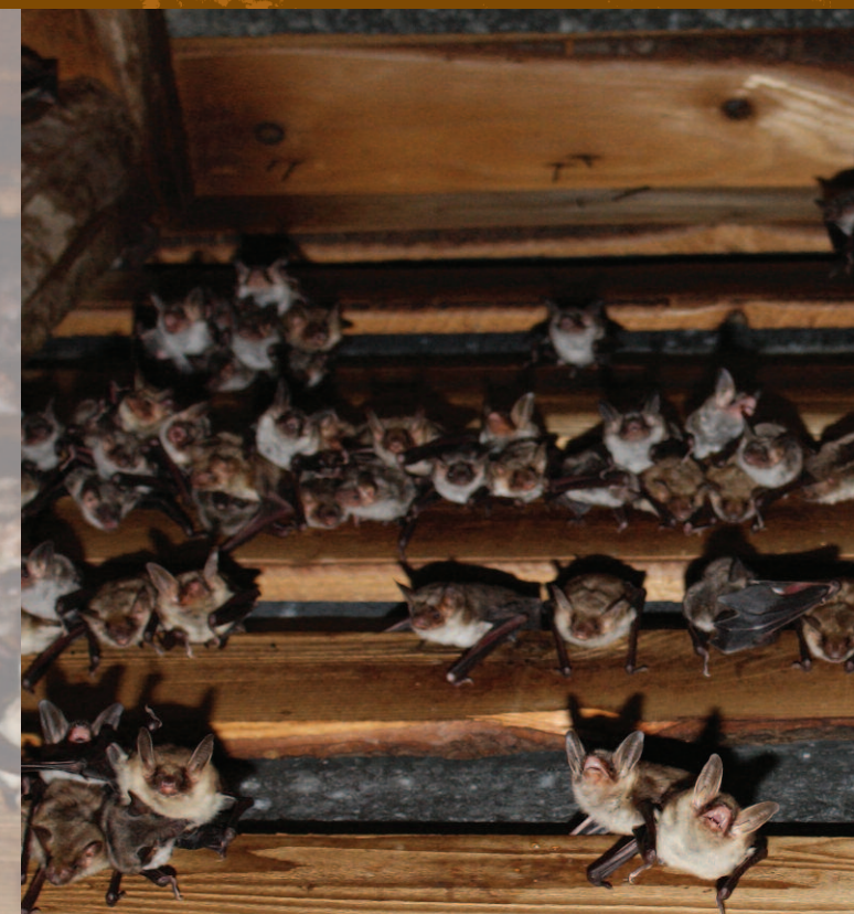
Kolonia nocka dużego, fot. Krzysztof Piksa