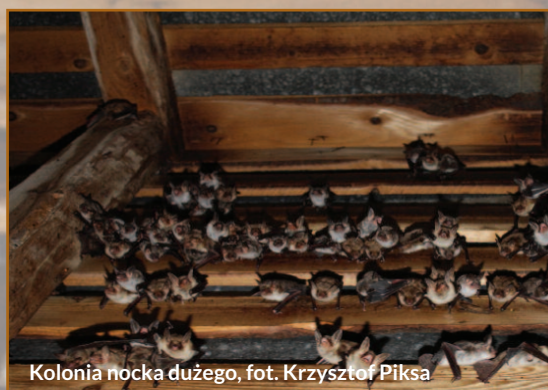
Kolonia nocka dużego

z załącznika II Dyrektywy Siedliskowej). Jej liczebność waha się w granicach 150-320 osobników. Kolonia ta zasiedla niewielki strych kościoła. W miejscu przebywania nietoperzy gromadzi się duża ilość guana nietoperzy.