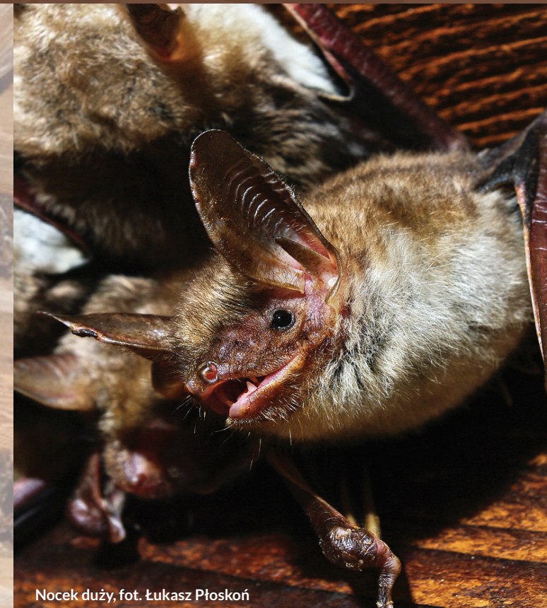
Nocek duży, fot. Łukasz Płoskoń