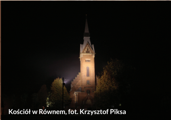
Kościół w Równem

Celem ochrony w tym obszarze jest zachowanie kolonii rozrodczych nocka dużego oraz utrzymanie właściwego stanu siedlisk przyrodniczych wykorzystywanych przez nietoperze.