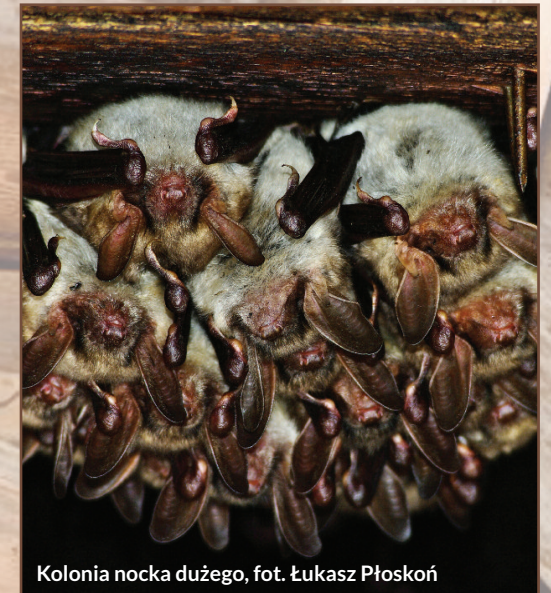
Kolonia nocka dużego

Świątynia znajduje się na niewielkim wzniesieniu nieopodal ruchliwej drogi krajowej, w obrębie zabudowań wsi Równe. Z trzech stron otoczona jest wysokim murem i kilkudziesięcioletnimi drzewami