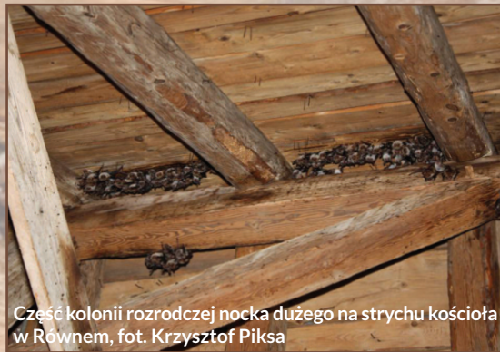
Część kolonii rozrodzkiej nocka dużego na strychu kościoła w Równem

(częściowo silnie ogłowionymi). Omawiany obszar w promieniu kilku kilometrów od obiektu pokrywają głównie tereny rolnicze i lasy.