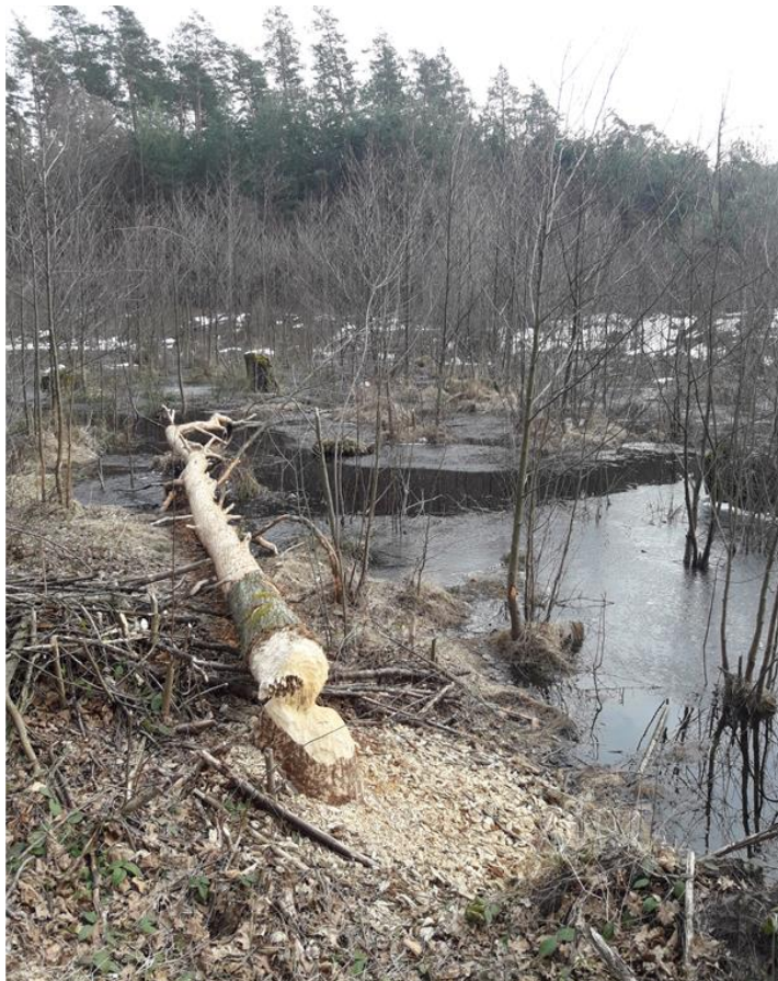
Fot. 8. Świeże zgryzienia bobrowe

Nie stwierdzono aktualnych zagrożeń, natomiast zagrożenia potencjalne związane są z bliskością głównych dróg oraz obecnością przepustów, stąd jako zagrożenie potencjalne można wymienić śmiertelność na drogach. Sąsiedztwo pól uprawnych i terenów prywatnych jest na obszarze sporadyczne, może jednak stwarzać potencjał konfliktów z działalnością bobrów, co z kolei może skutkować niszczeniem tam bobrowych i żeremi oraz kłusownictwem.