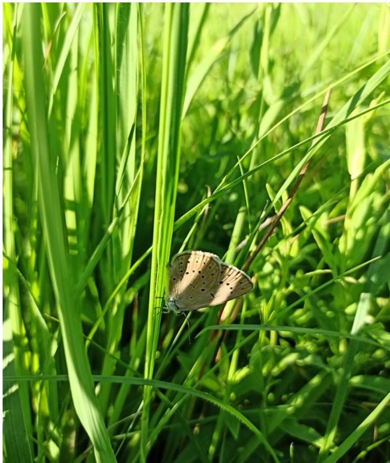
Fot. 10. Imago modraszka telejusa Phengaris teleius