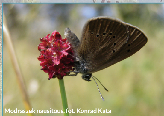
Modraszek nausitous

Na uwagę zasługuje występowanie w obszarze populacji pełnika europejskiego Trollius europaeus oraz liczne występowanie rzadkich gatunków motyli: modraszek telejus Maculinea nausithous , modraszek nausitous Maculinea telejus związanych z rośliną żywicielską – krwisiągłem lekarskim oraz czerwończyk nieparek Lycaena dispar .