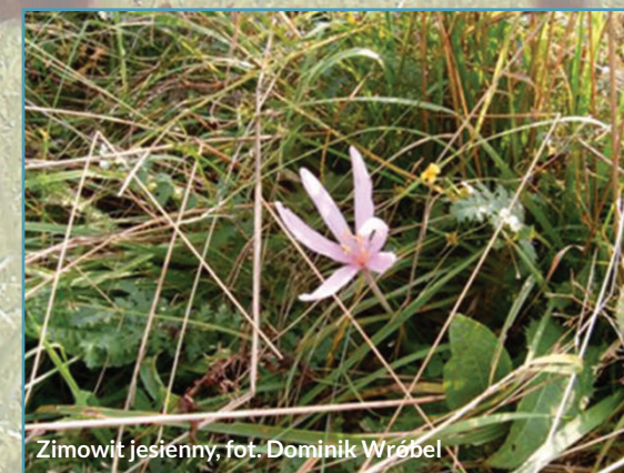
Zimowit jesienny

Łąki w Ladzinie stanowią jeden z największych płatów tradycyjnie użytkowanych i bogatych w gatunki łąkowe wschodniej części Karpat (siedlisko z załącznika I Dyrektywy Siedliskowej – 6510 – niżowe łąki świeże).