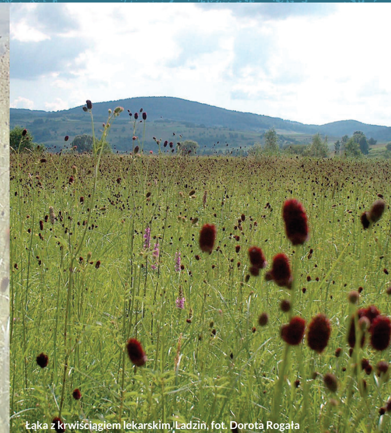
Łąka z krwisiągkiem lekarskim, Ladzin