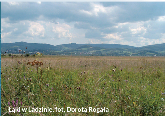
Łąki w Ladzinie

Celem ochrony obszaru jest utrzymanie powierzchni i składu gatunkowego ekstensywnie użytkowanych łąk oraz cennej lepidopterofauny.