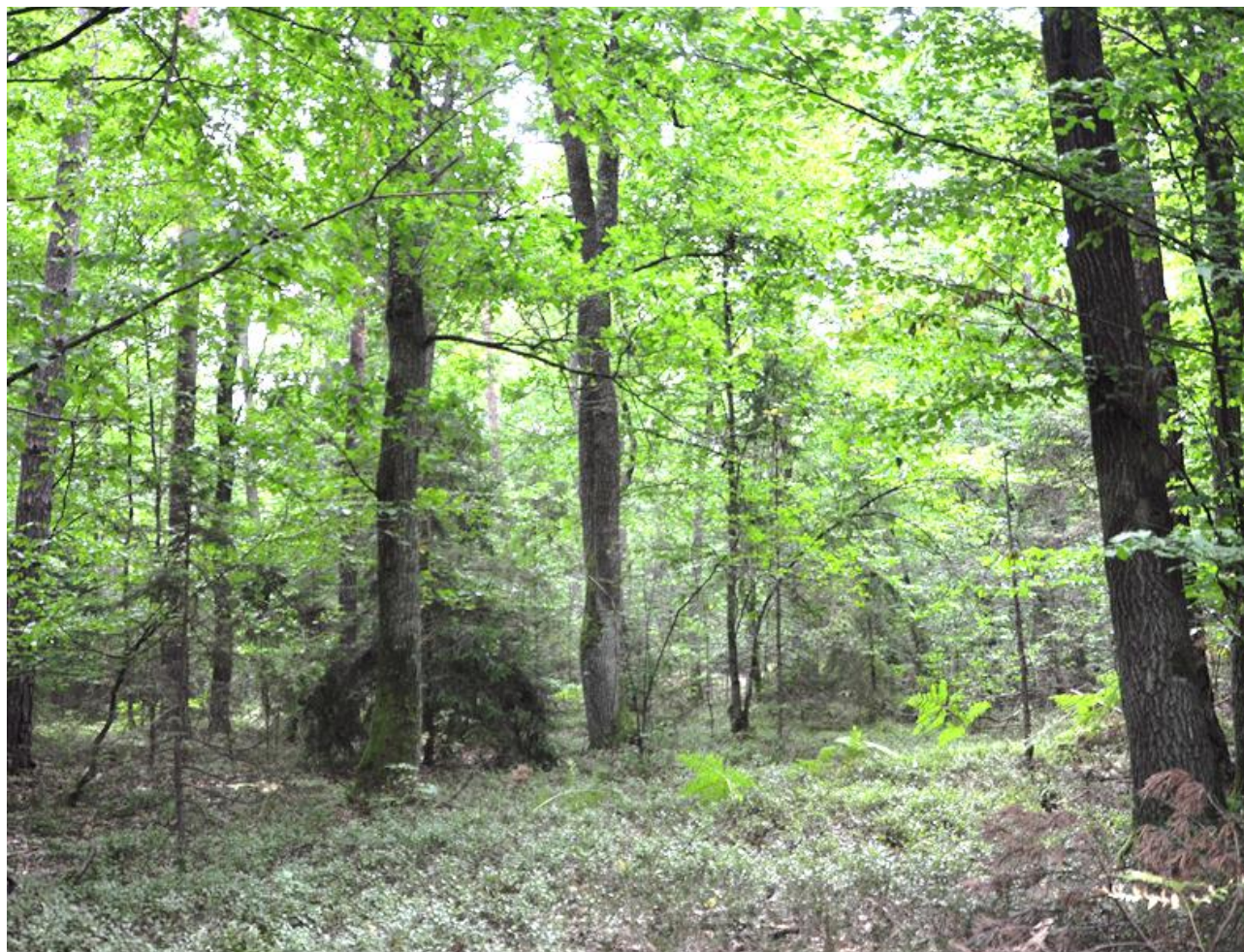
Fot. 6. Kwaśne dąbrowy (fot. A. Przemyski)