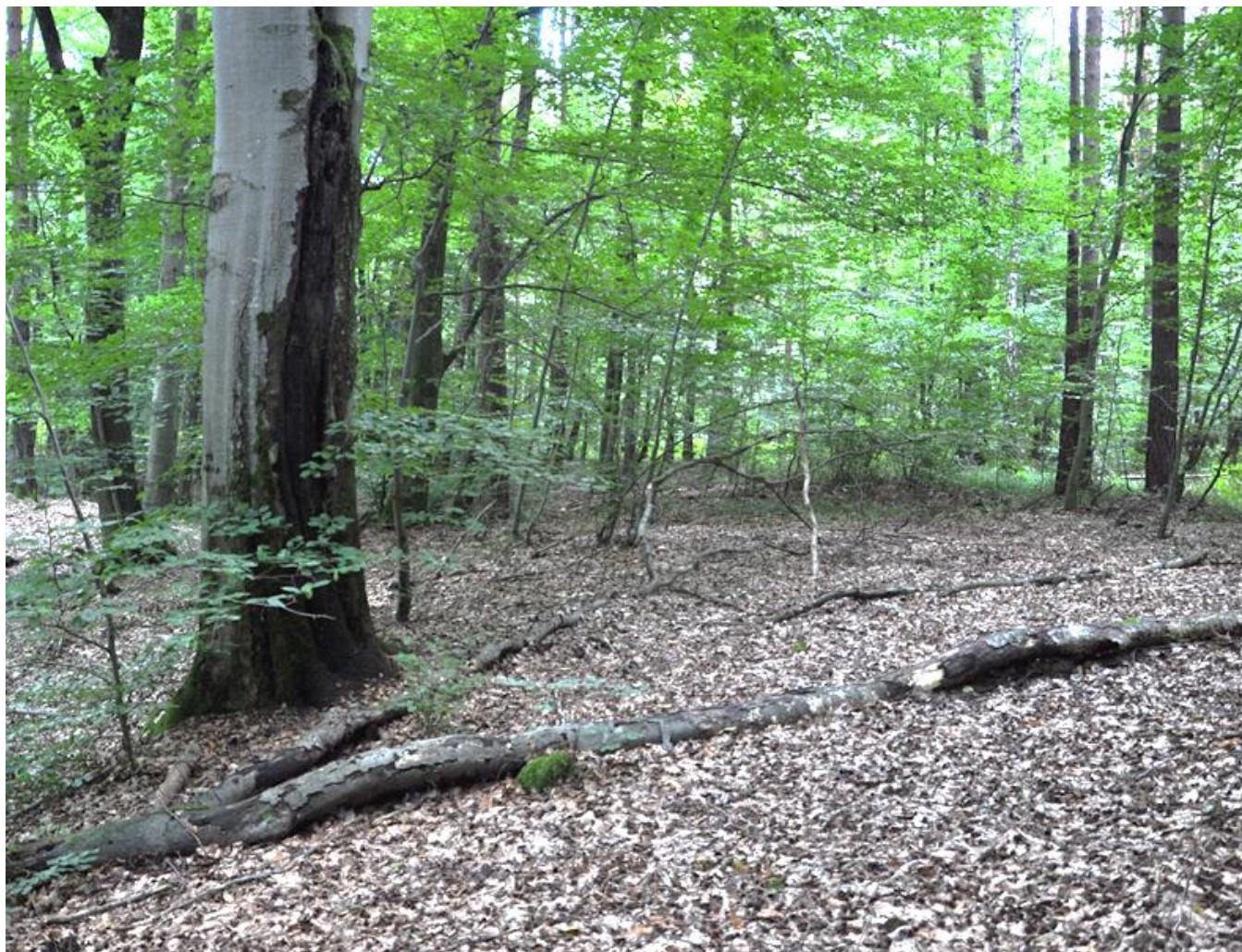
Fot. 3. Kwaśna buczyna