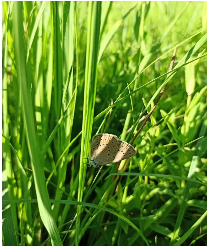
Fot. 10. Imago modraszka telejusa Phengaris teleius