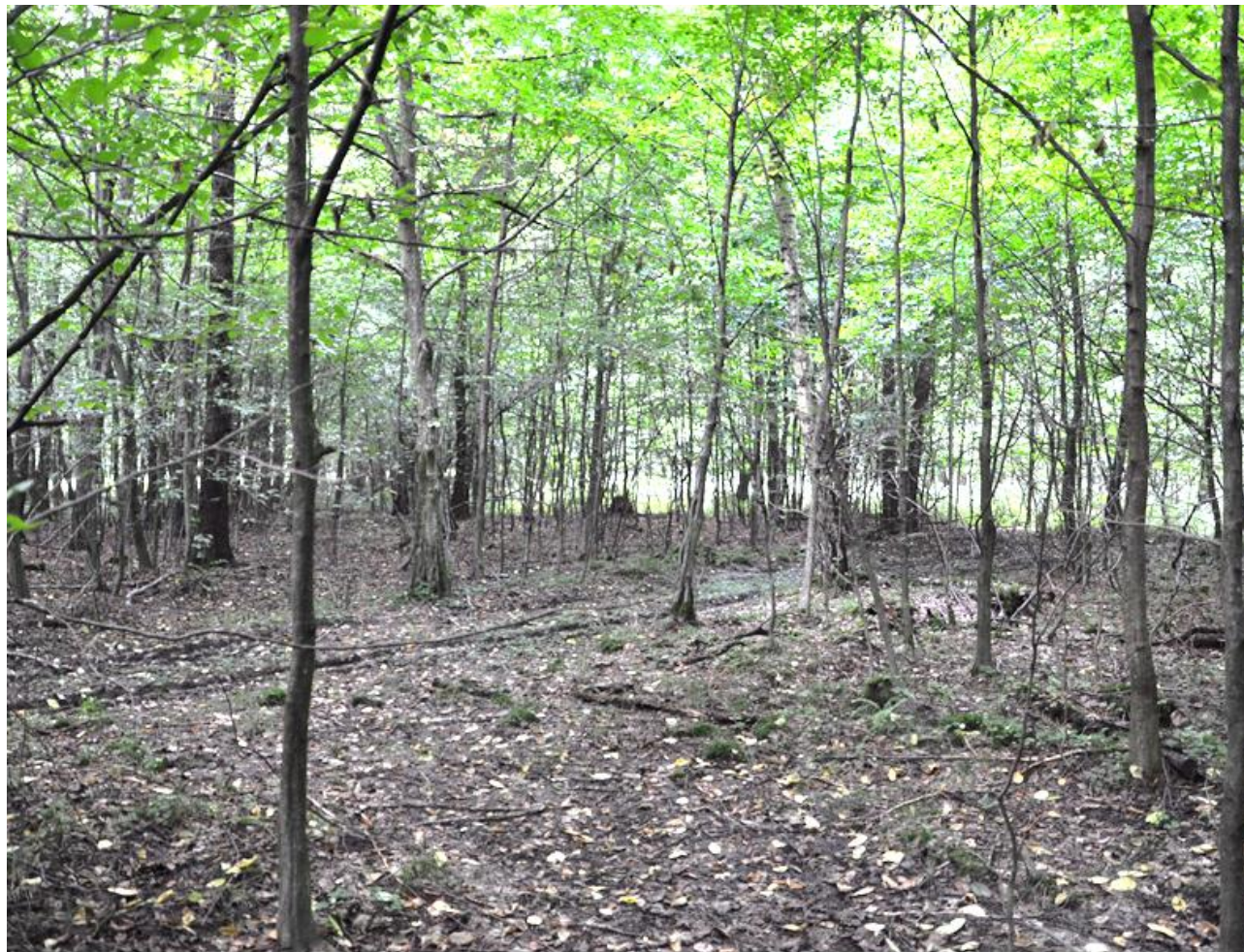
Fot. 4. Juwenilny fragment płatu gądu subkontynentalnego