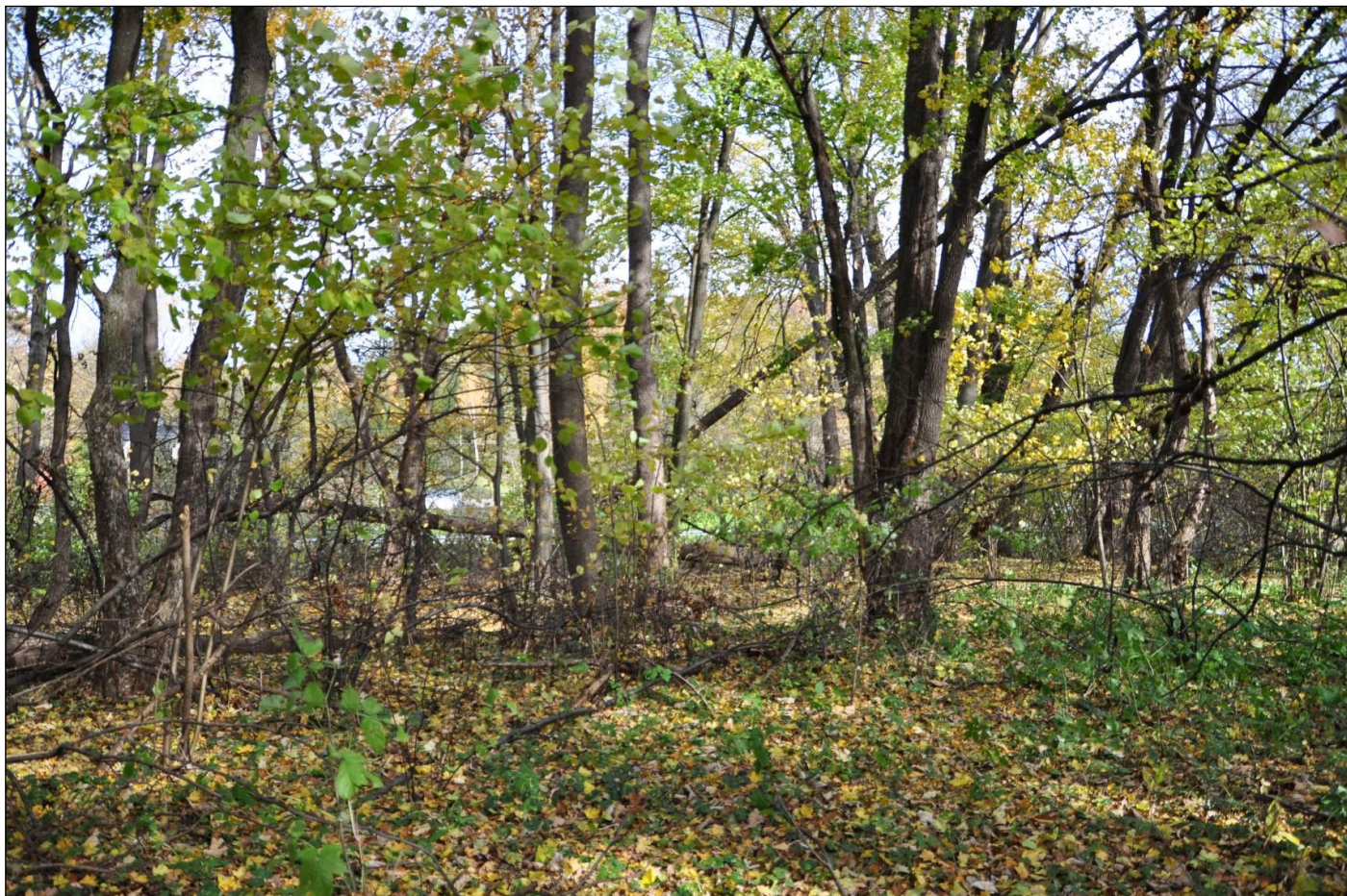
Fot. 7. Łęgowe lasy dębowo-wiązowo-jesionowe ( Ficario-Ulmetum )

Zagrożeniem dla siedliska jest ekspansja gatunków obcych i ekspansywnych. Innym zagrożeniem na przedmiotowym obszarze jest bardzo mała ilość pozostawionego martwego drewna, wiek drzewostanu.