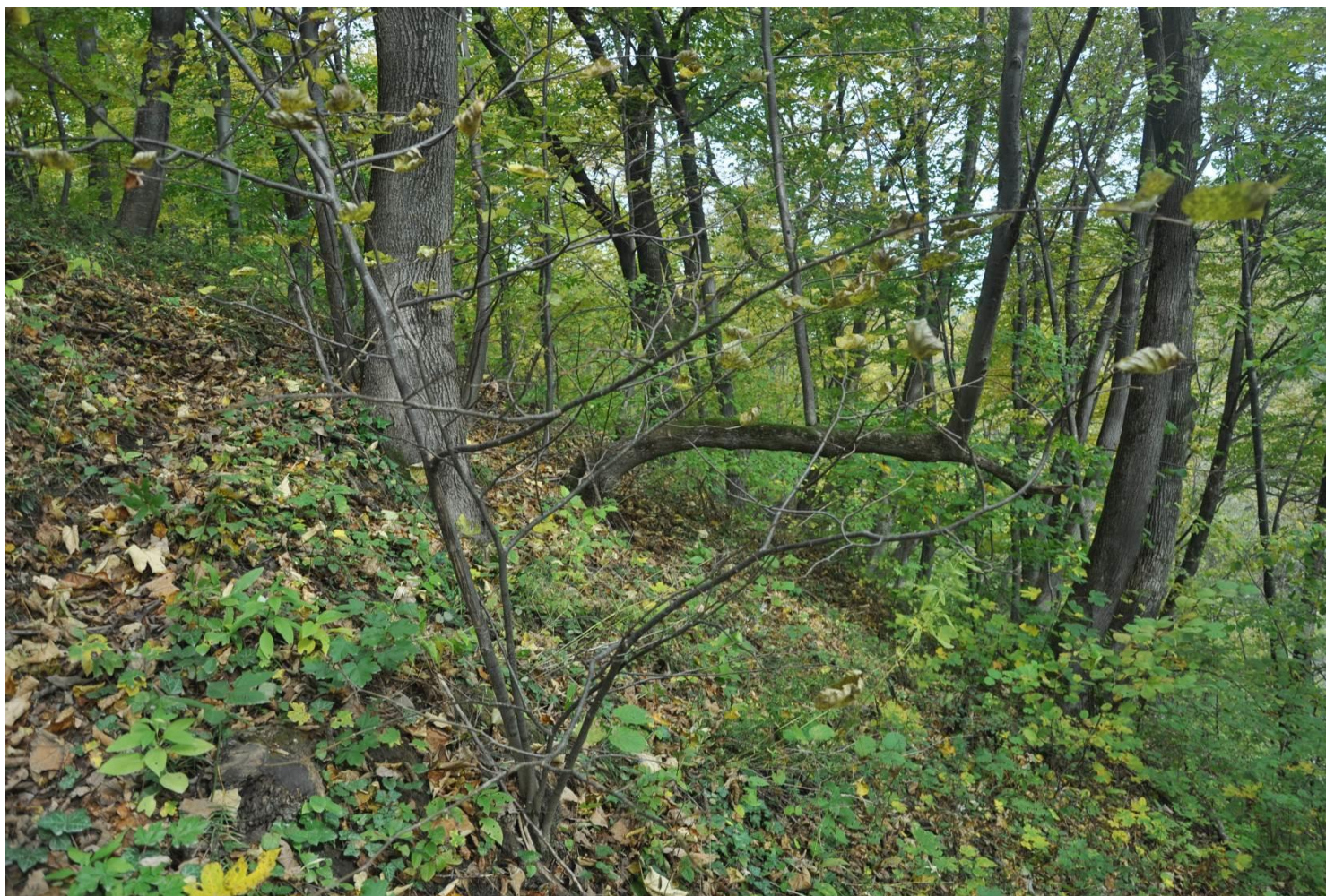
Fot. 6. Lasy klonowo lipowe w obszarze.