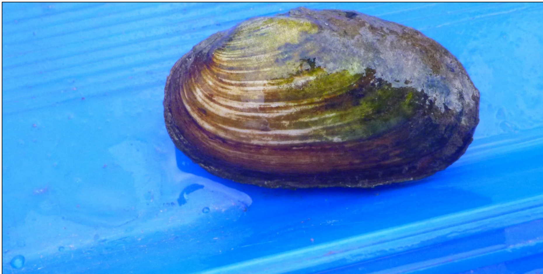
Fot. 19. Skójka gruboskorupowa Unio crassus .