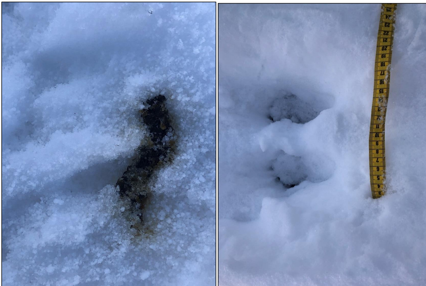
Fot. 11 i 12. Odchody i tropy wydry Lutra lutra

Nie stwierdzono aktualnych zagrożeń, natomiast zagrożenia potencjalne związane są z bliskością głównych dróg (i potencjalną śmiertelnością na nich) oraz sąsiedztwem terenów zabudowanych (i związanym z nimi potencjalnym kłusownictwem).