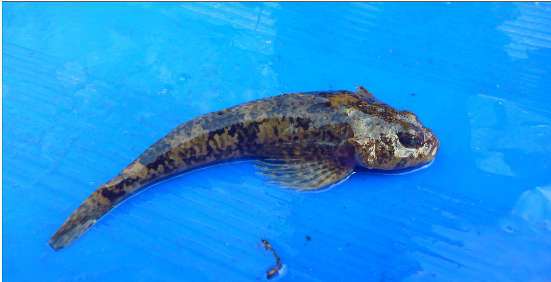
Fot. 10. Głowacz białopłetwy Cottus gobio