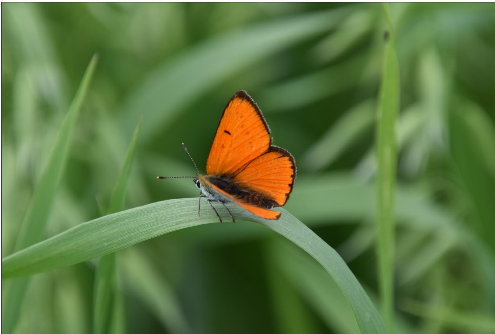
Fot. 13. Czerwończyk nieparek Lycaena dispar