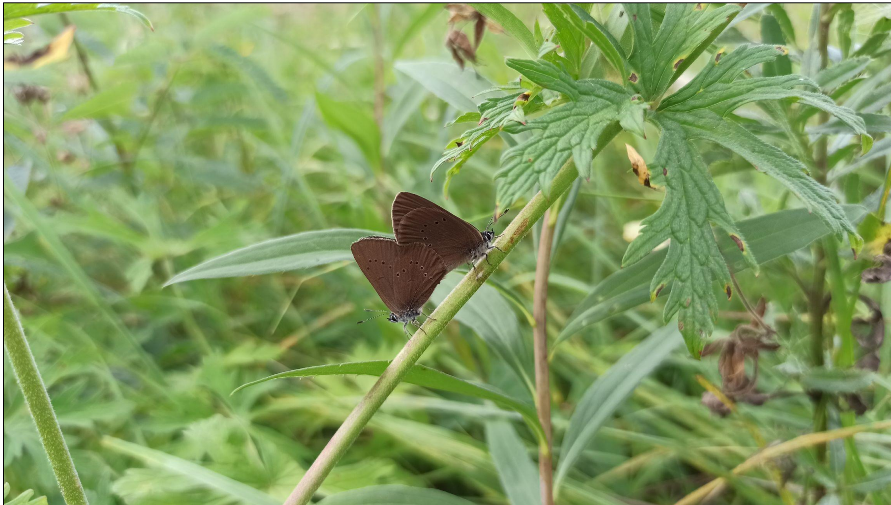
Fot. 14. Modraszek nausitous Phengaris nausithous