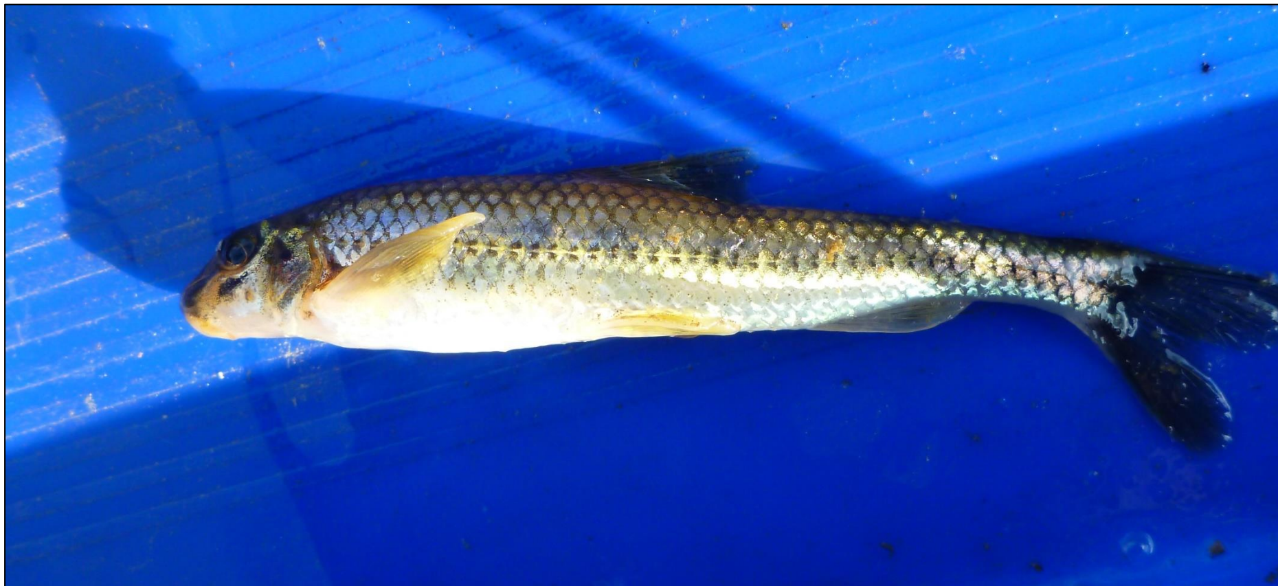
Fot. 18. Kiełb Kesslera Romanogobio kesslerii