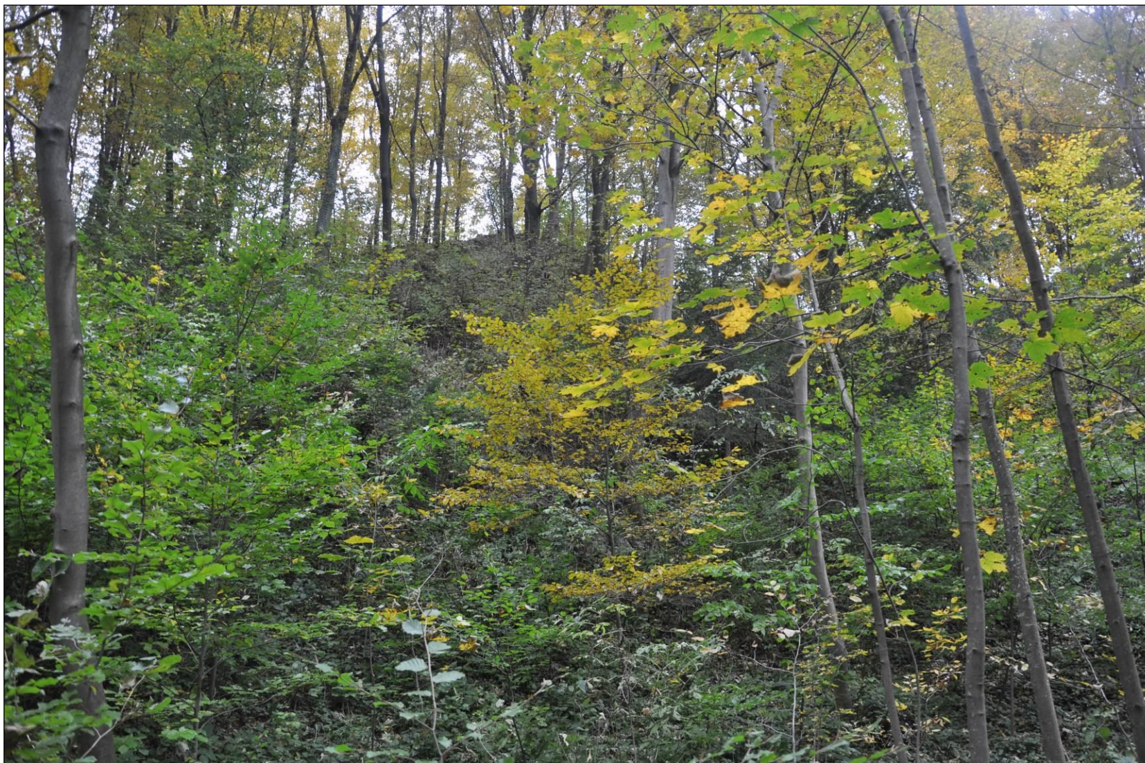
Fot. 3. Grąd środkowoeuropejski i subkontynentalny ( Galio-Carpinetum , Tilio-Carpinetum )