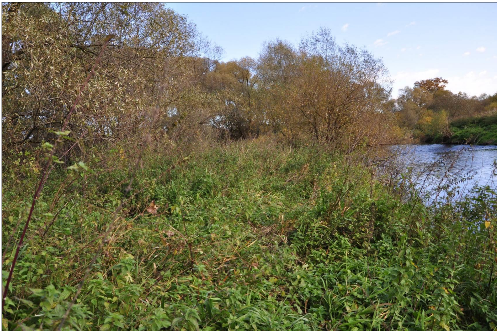
Fot. 5. Ziołorośla górskie ( Adenostylion alliariae ) i ziołorośla nadrzeczne ( Convolvuletalia sepium )