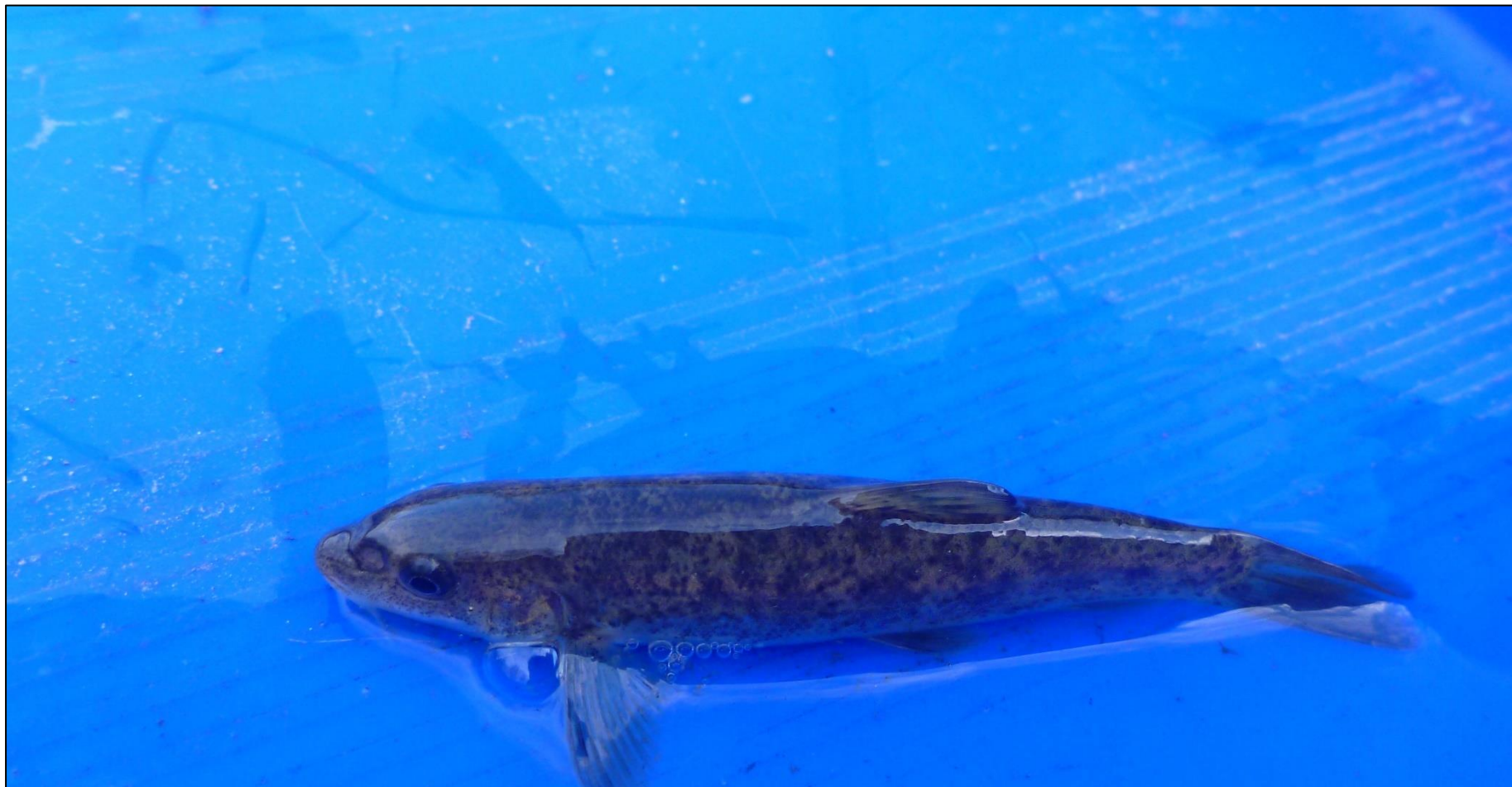
Fot. 9. Brzanka Barbus carpathicus