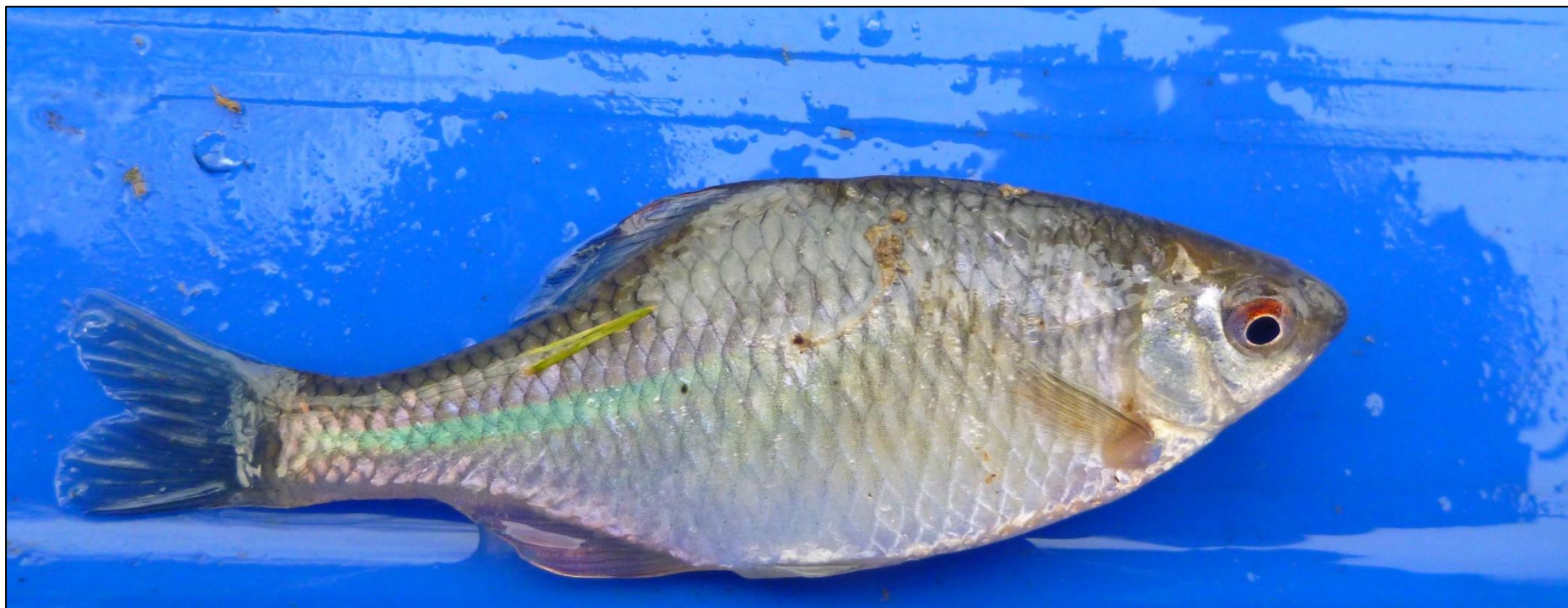
Fot. 16. Różanka Rhodeus amarus

Podstawowym zagrożeniem różanki jest postępująca degradacja środowiska wodnego, głównie zanieczyszczenia przemysłowe, które ograniczają bądź eliminują małże z rodziny skójkowatych. Małże skójkowate są wrażliwe na zmiany jakości wód, także regulacje naruszające substrat denny powodują eliminację małży, a razem z nimi różanek.