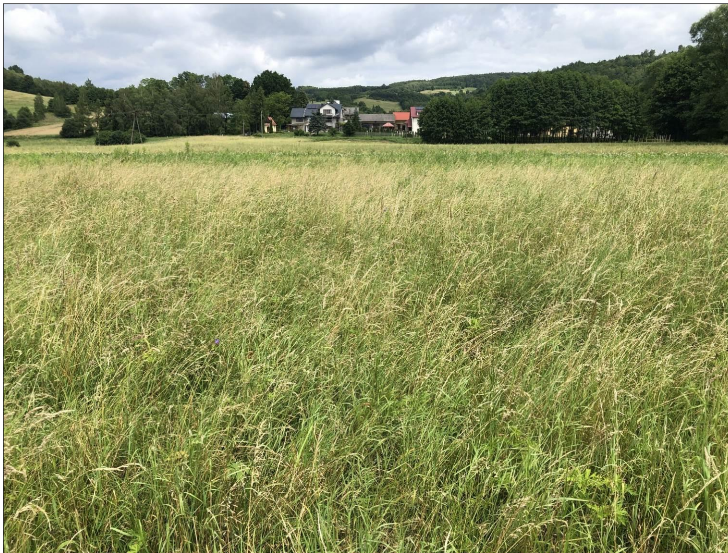
Fot. 2. Nizowe i górskie świeże łąki użytkowane ekstensywnie ( Arrhenatherion elatioris )