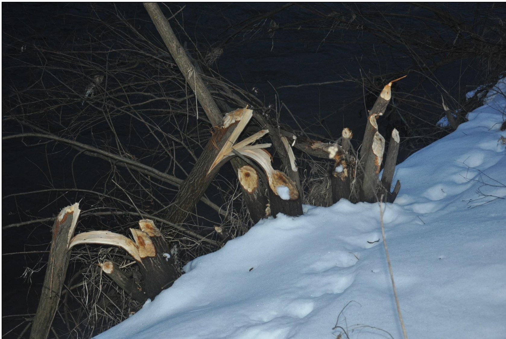
Fot. 20. Zgryzy bobrowe.