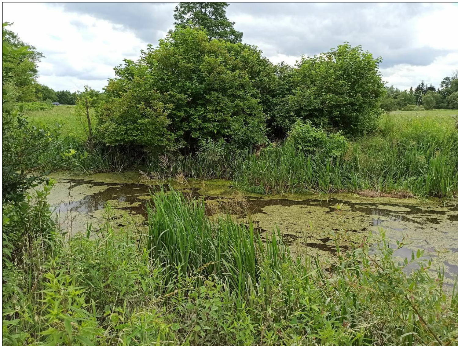
Fot. 8. Starorzeczka i naturalne eutroficzne zbiorniki wodne ze zbiorowiskami z Nympheion , Potamion