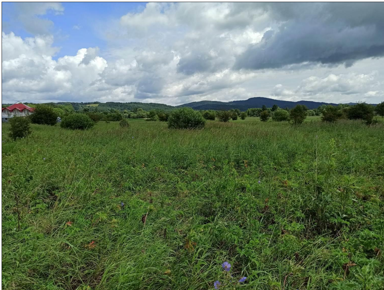
Fot. 1. Zmiennowilgotne łąki trzęślicowe ( Molinion )