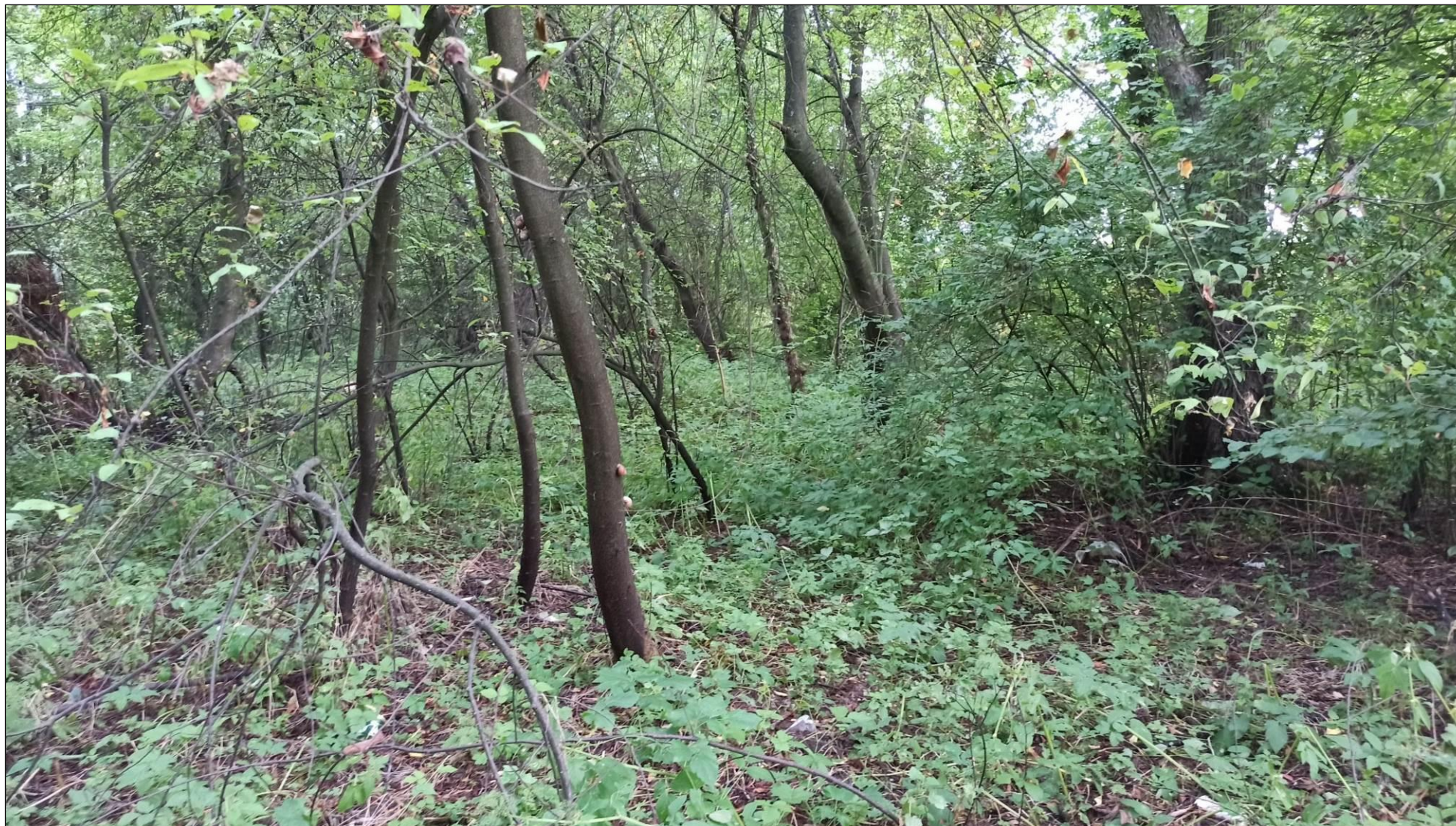
Fot. 4. Łęgi wierzbowe, topolowe, olszowe i jesionowe ( Salicetum albo-fragilis , Populetum albae , Alnenion glutinoso-incanae , olsy źródliskowe)