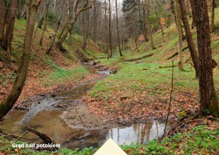
Grąd nad potokiem

Celem ochrony jest utrzymanie populacji dwóch gatunków owadów wymienionych w załączniku II Dyrektywy siedliskowej – biegacz urozmaicony i zgniotek cynobrowy oraz miejsc ich bytowania.