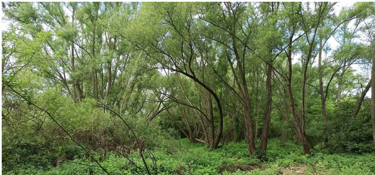
Łęg wierzbowy Salicetum albae

Stan siedliska w regionie kontynentalnym, wg. Raportu z Art. 17 DS., 2015-2018 r.: zły (U2)