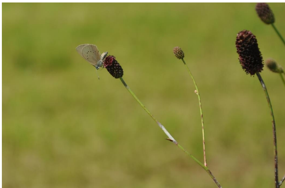
Modraszek nausitous Phengaris nausithous na roślinie żywicielskiej – krwiściągę lekarskim Sanguisorba officinalis , fot. Alojzy Przemyski.