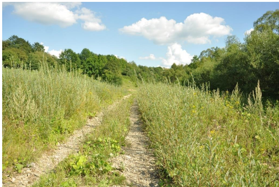
Płat siedliska 3240