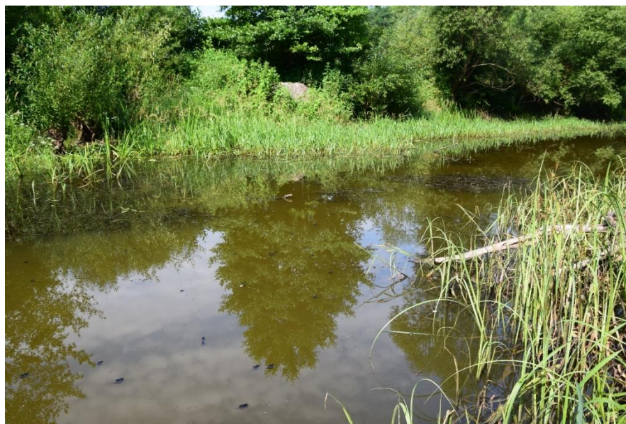
Płat siedliska 3150, fot. Jan Starus

Stan siedliska w regionie kontynentalnym, wg Raportu z Art. 17 DS., 2018 r.: zły (U2)