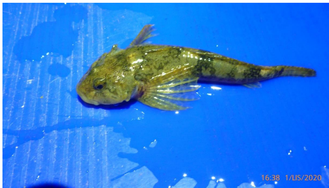
Głowacz białopłetwy Cottus gobio , fot. Krzysztof Tatoj.

Niewielkich rozmiarów ryba (15-17 cm) należąca do rodziny głowaczowatych Cottidae . Spłaszczona grzbietobrzusnie przybiera maczugowaty kształt. Na wierzchołku głowy znajdują się duże oczy. Jako przystosowanie do przydennej trybu życia poza kształtem ciała jest brak pęcherza pławnego. Głowacz białopłetwy nie jest pokryty łuskami, a po bokach mogą występować niewielkie kolce. Wyraźna linia naboczna przebiega w połowie wysokości ciała, od głowy do nasady płetwy ogonowej i jest cechą odróżniającą od innego gatunku głowacza pręgopłetwego Cottus poecilopus . Na grzbiecie obecne są dwie płetwy, ponadto płetwa odbytowa, ogonowa zaokrąglona, duże wachlarzowate płetwy piersiowe, a tuż pod ich nasadą płetwy brzuszne. W ubarwieniu ciała ryby dominuje szarobrazowy, przy czym brzuch i płetwy białe bądź białozółte. Głowacz białopłetwy zwykle żyje 4-5 lat. Dojrzałość płciową osiąga w drugim lub trzecim roku. Prowadzi nocny tryb życia, w ciągu dnia ukrywając się pod kamieniami. Pod względem wymagań ekologicznych wykazuje wąskie specjalizacje. Optymalnym siedliskiem są rzeki o charakterze podgórskim lub wyżynnym (Witkowski 2004).