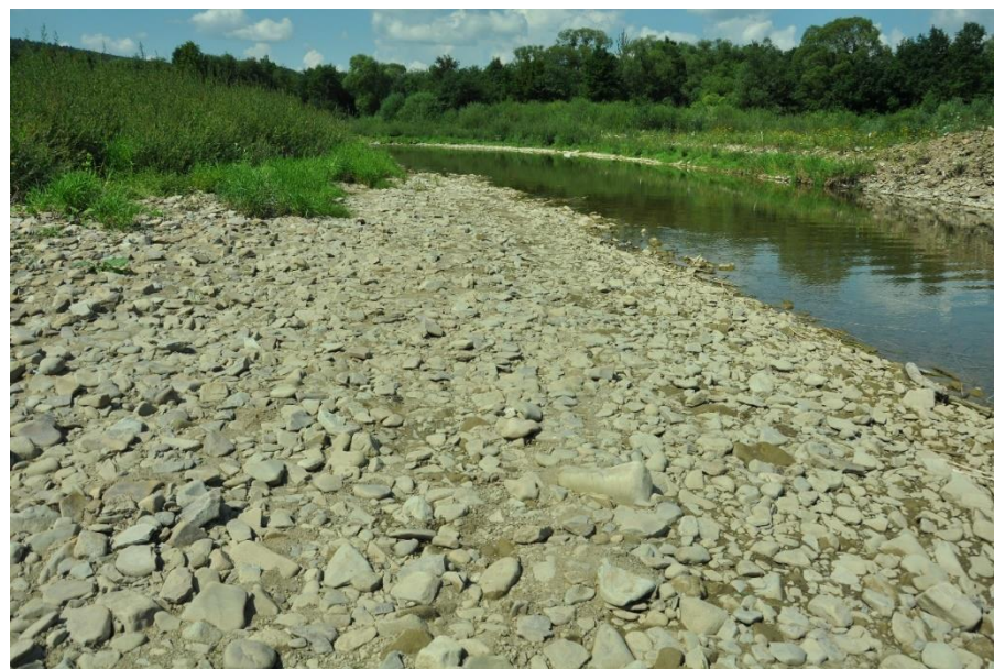
Płat siedliska 3220

Stan siedliska w regionie kontynentalnym, wg Raportu z Art. 17 DS., 2018 r.: niezadowolający (U1)