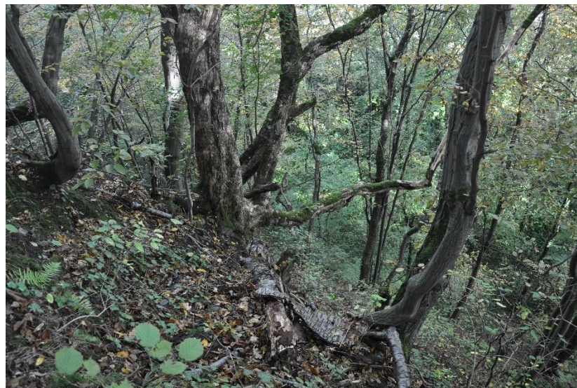
Płat siedliska 9180