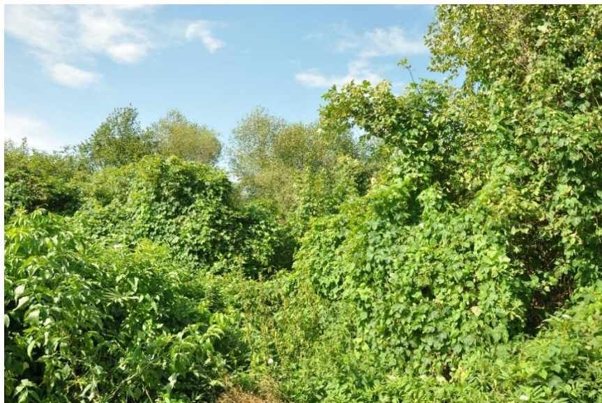
Ziolorośla nadrzecne ( Convolvuletalia sepium )