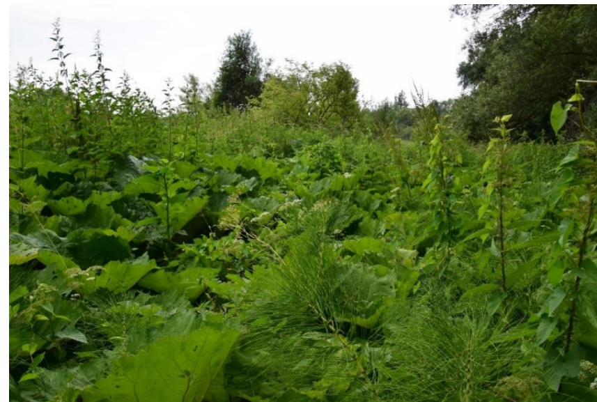
Ziolorośla górskie ( Adenostylion alliariae ) z dominacją lepiężników Petasites sp.