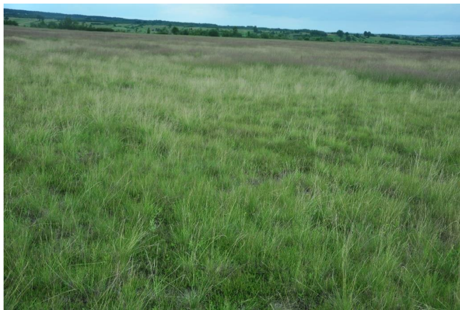
Murawa bliźniczkowe – siedlisko 6230, fot. Jan Starus

Termin, w którym prowadzone były badania to czerwiec – sierpień 2020 r. oraz dodatkowe obserwacje w 2021 r.