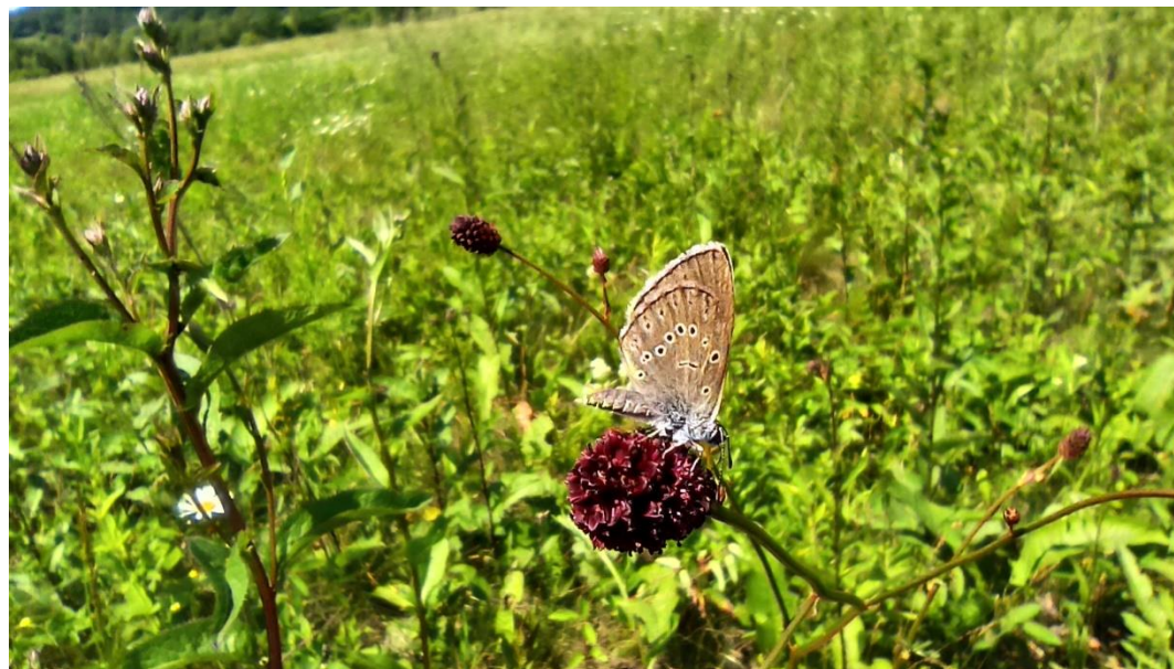
Modraszek telejus Phengaris teleius na krwiściagu lekarskim Sanguisorba officinalis