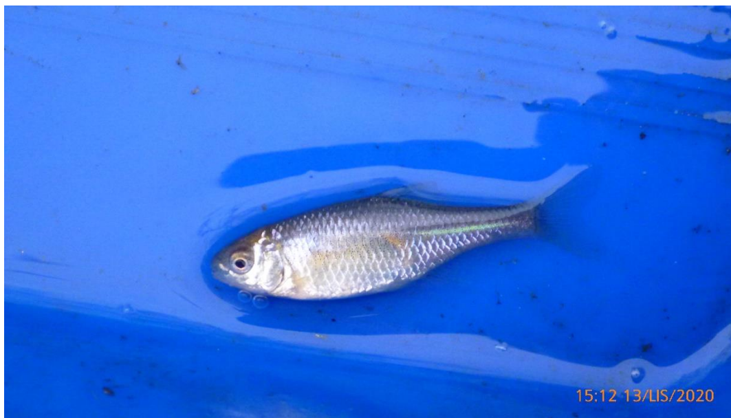
Różanka Rhodeus amarus , fot. Krzysztof Tatoj.

Stan gatunku w regionie kontynentalnym, wg Raportu a Art. 17 DS. 2015-2018 r.: właściwy (FV)