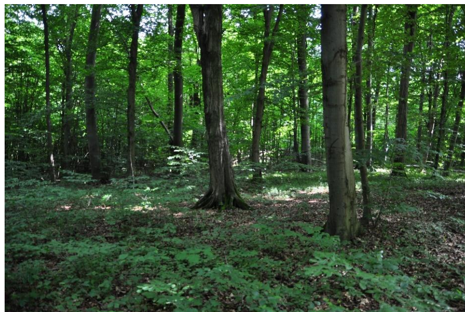
Grąd subkontynentalny Tilio-Carpinetum

Stan siedliska w regionie kontynentalnym, wg. Raportu z Art. 17 DS., 2015-2018 r.: zły (U2)