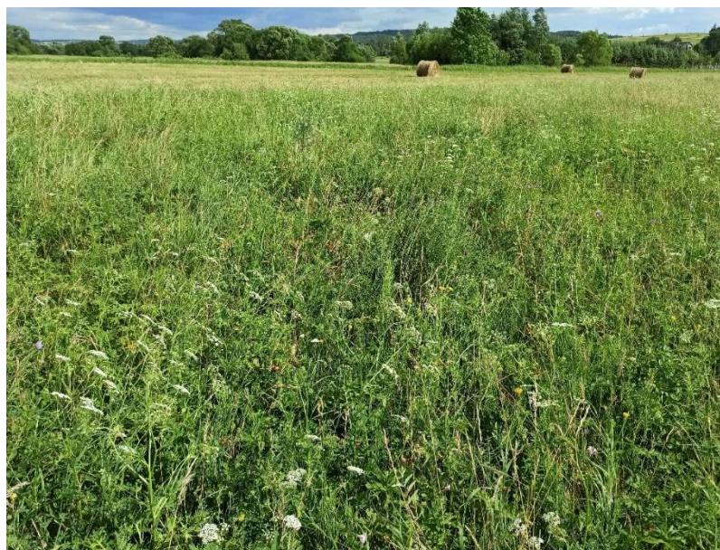
Płat łąki świeżej ze związku Arrhenatherion

W obszarze objętym opracowaniem stwierdzono 36 płatów łąk świeżych. Lokalizują się głównie na terenie położonym pomiędzy miejscowością Dobrynia a Zawadka Osiecka oraz Nowym Żmigrodem a Kobyłanami. Charakteryzowały się obecnością niemal wszystkich gatunków typowych dla siedliska. Na niektórych płatach odnotowano również chronione gatunki roślin: zimowit jesienny Colchicum autumnale , centuria pospolita Centaureum erythraea czy goryczka krzyżowa Gentiana cruciata . Miejscami zaznacza się obecność ekspansywnych roślin: trzcinnika piaskowego Calamagrostis epigejos , śmiałka darniowego Deschampsia caespitosa , perzu właściwego Elymus repens , w tym również bodziszka łąkowego Geranium pratense (gatunek charakterystyczny dla 6510). Z gatunków inwazyjnych zaobserwowano: nawłóć późną Solidago gigantea , przymiotno białe Erigeron annuus , rudbeckię nagą Rudbeckia laciniata . Termin, w którym prowadzone były badania to czerwiec-wrzesień 2020 r., listopad 2021 r., a także dodatkowe badania uzupełniające w czerwcu 2022 r.