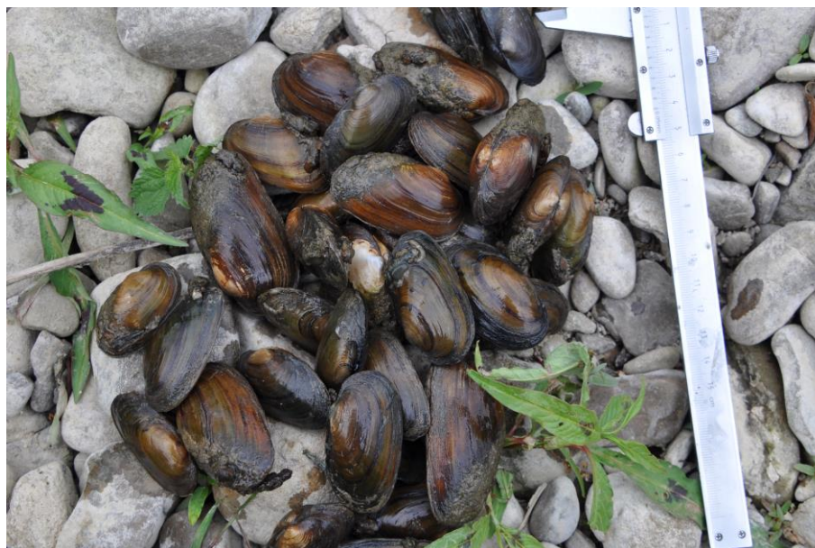
Ławica skójki gruboskorupowej Unio crassus

Stan gatunku w regionie kontynentalnym, wg Raportu a Art. 17 DS. 2015-2018 r.: niezadowolający (U1)