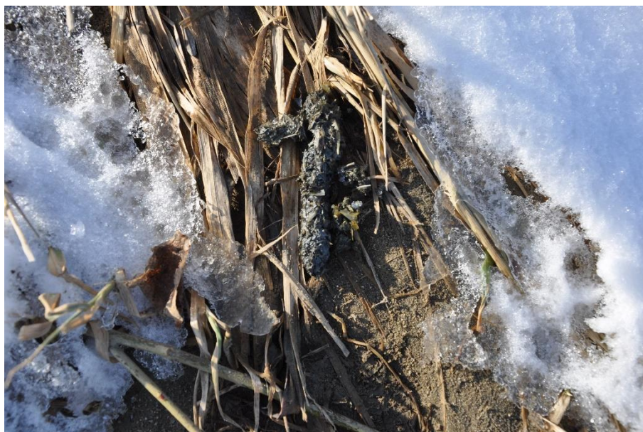
Odchody wydry z widocznymi rybimi łuskami