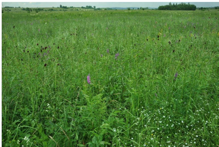
Płat łąki zmiennowilgotnej z krwiściągiem pospolitym i mieczykiem dachówkowatym

Stan siedliska w regionie kontynentalnym, wg Raportu z Art. 17 DS., 2018 r.: niezadowolający (U1)