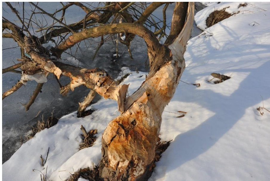
Świeże zgrzyzy bobrowe, fot. Alojzy Przemyski