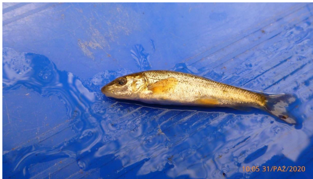
Brzanka Barbus carpathicus

Brzanka należy do rodziny karpiowatych Cyprinidae . Rzadko przekracza 25 cm długości i masę 200 g, przy czym samce są mniejsze od samic. Ciało jest nieco bocznie spłaszczone i wydłużone. Na pysku obecne 2 pary wąsów. Grzbiet przybiera brunatny kolor, natomiast boki złociste z ciemnymi plamkami. Żywi się bezkręgowcami, znajdującymi się na dnie, głównie larwami owadów. Tarło rozpoczyna się w maju bądź czerwcu, kiedy temperatura osiąga ok. 17 stopni i może trwać do lipca, z uwagi, iż ikra składana jest w trzech partiach. Jest to gatunek bytujący w ciekach, o kamienistym dnie, na obszarach podgórskich i górskich, zaś nieobecny w wodach stojących (Amirowicz 2012).