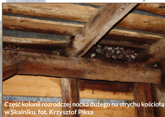
Część kolonii rozrodczej nocka dużego na strychu kościoła w Skalniku

kościół nie zachowały się, pozostały jedynie obrazy z dwóch kwater ołtarzowych z ok. 1530 r. W 1962 roku kościół stał się Sanktuarium Matki Bożej Bolesnej „Królowej Gór”.