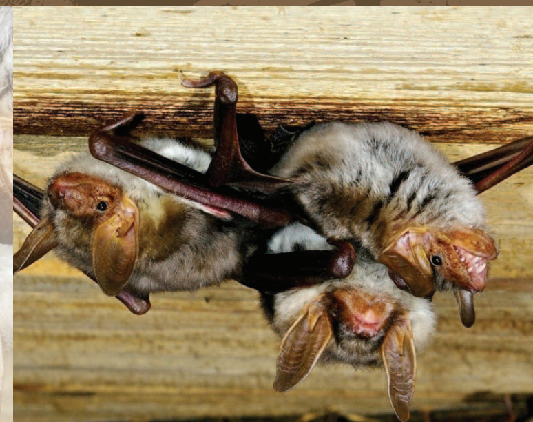
Nocki duże