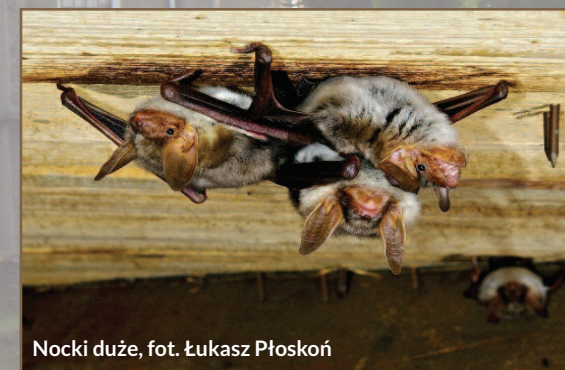
Nocki duże

Świątynia jest murowana, posiada jedną wieżę, która pokryta jest blachą. Ze wszystkich stron obiekt otoczony jest niewysokim kamiennym murkiem i kilkudziesięcioletnimi drzewami (lipy, jesiony, klony i dęby). Parafia w Skalniku jest prawdopodobnie jedną z najstarszych parafii w południowej Polsce, powstała po 1375 r. Obecny murowany kościół wybudowany został w latach 1909-1911. Poprzednie dwa drewniane