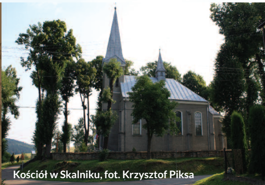
Kościół w Skalniku

Celem ochrony w tym obszarze jest zachowanie kolonii rozrodczych nocka dużego oraz utrzymanie właściwego stanu siedlisk przyrodniczych wykorzystywanych przez nietoperze jako żerowisko.