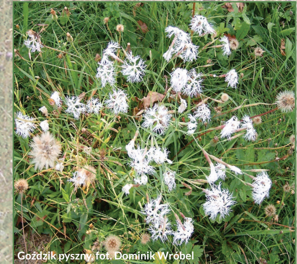
Goździk pyszny

Wartość przyrodnicza obszaru wynika w pierwszym rzędzie z występowania dobrze zachowanych siedlisk zmiennowilgotnych łąk trzęślicowych. Łąki tego typu związane są zwykle z dolinami dużych rzek, ich lokalizacja na terenach podgórskich należy natomiast do rzadkości. Za zupełny wyjątek trzeba uznać płaty o tak bogatym składzie florystycznym jak te w okolicy Józefowa.