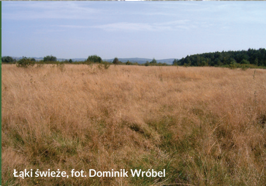
Łąki świeże

Celem ochrony jest zachowanie bogactwa flory i fauny łąk trzęślicowych oraz utrzymanie właściwego stanu pozostałych siedlisk przyrodniczych: muraw bliźniczkowych, łąk świeżych, łęgów i grądów.