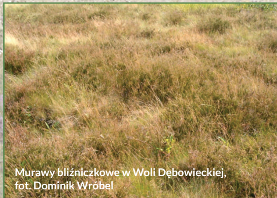
Murawy bliźniczkowe w Woli Dębowieckiej, fot. Dominik Wróbel

Na łąkach koło Józefowa znajdują się ważne regionalnie stanowiska chronionych i rzadkich gatunków roślin naczyniowych. Do największych osobliwości należą selernica żytkowana Cnidium dubium i groszek błotny Lathyrus palustris – gatunki wybitnie niżowe, sporadycznie występujące w południowej części naszego kraju. W przypadku groszku błotnego łąki józefowskie stanowią jedyne potwierdzone obecnie stanowisko w Karpatach.