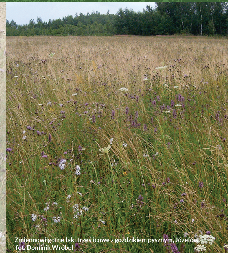
Zmiennowilgotne łąki trzęślicowe z goździkiem pysznym, Józefów