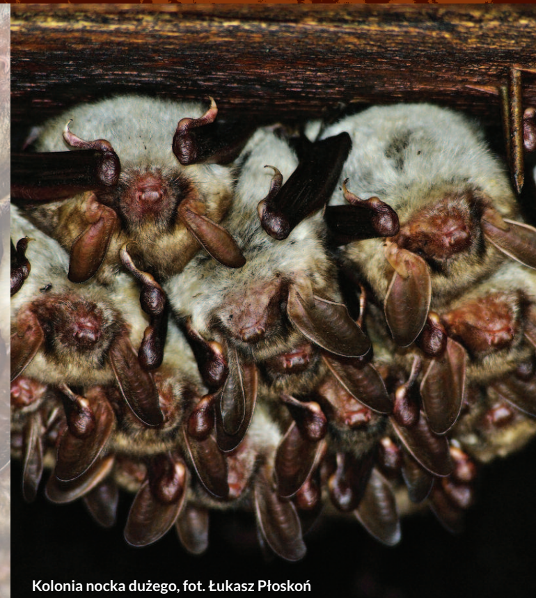
Kolonia nocka dużego