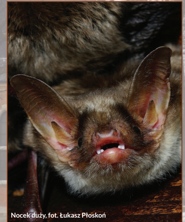
Nocek duży

W ostoi stwierdzono największą znaną w województwie podkarpackim kolonię rozrodczą nocka dużego Myotis myotis - gatunku nietoperza z załącznika