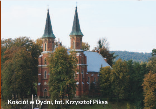
Kościół w Dydni

Celem ochrony w tym obszarze jest zachowanie kolonii rozrodczej nocka dużego oraz utrzymanie właściwego stanu siedlisk przyrodniczych wykorzystywanych przez nietoperze jako żerowiska.