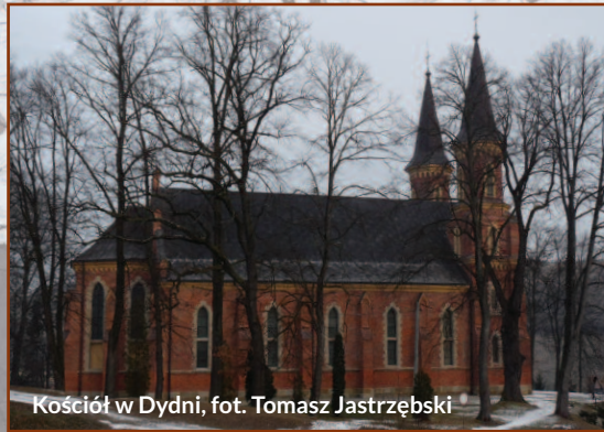
Kościół w Dydni, fot. Tomasz Jastrzębski

II Dyrektywy Siedliskowej (liczebność waha się w granicach 200-380 osobników).