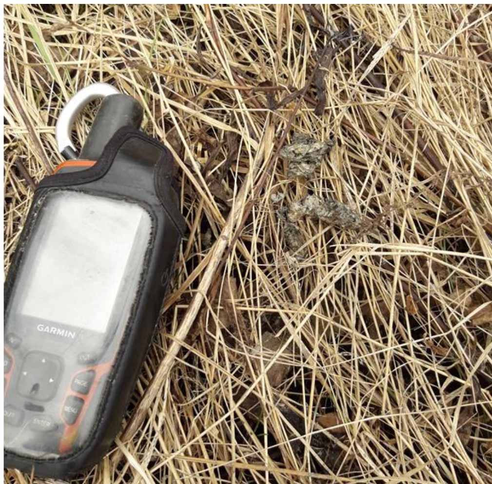
Fot. 9. Odchody wydry Lutra lutra