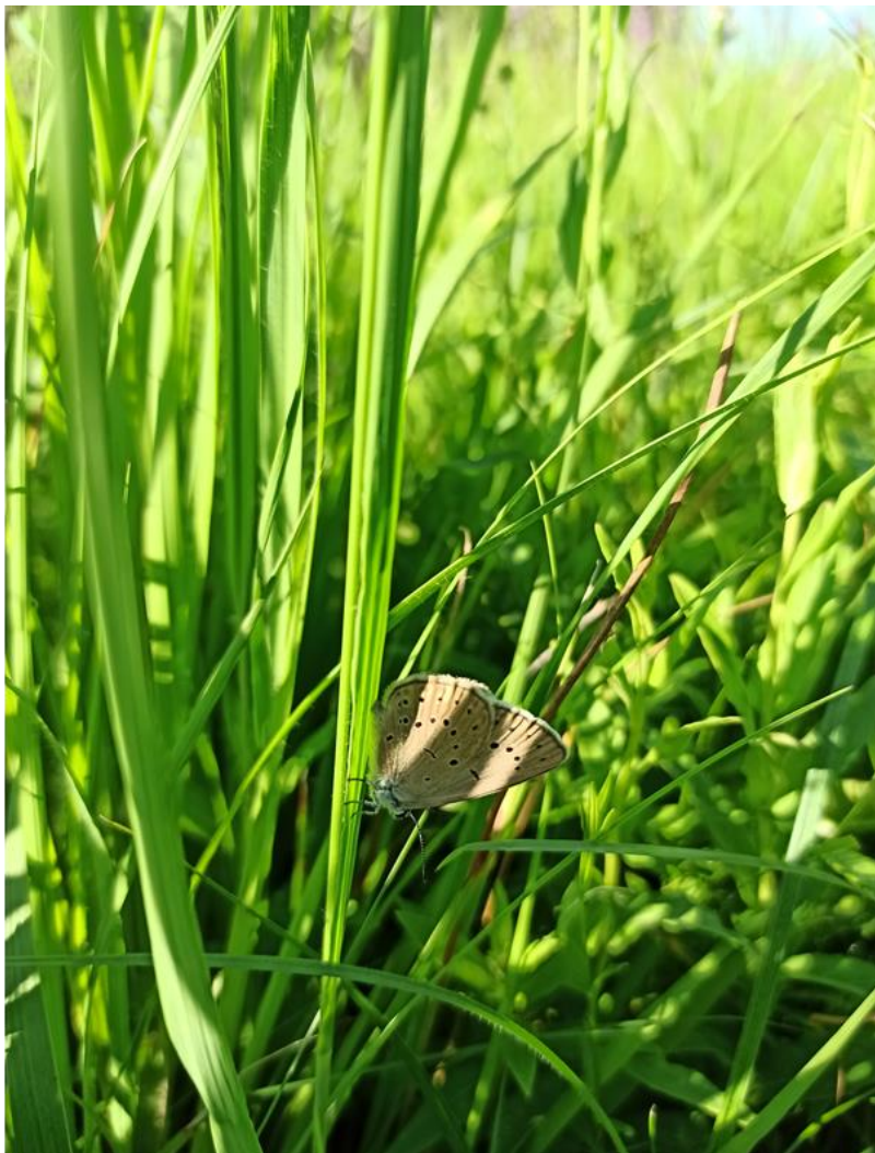
Fot. 10. Imago modraszka telejusa Phengaris teleius