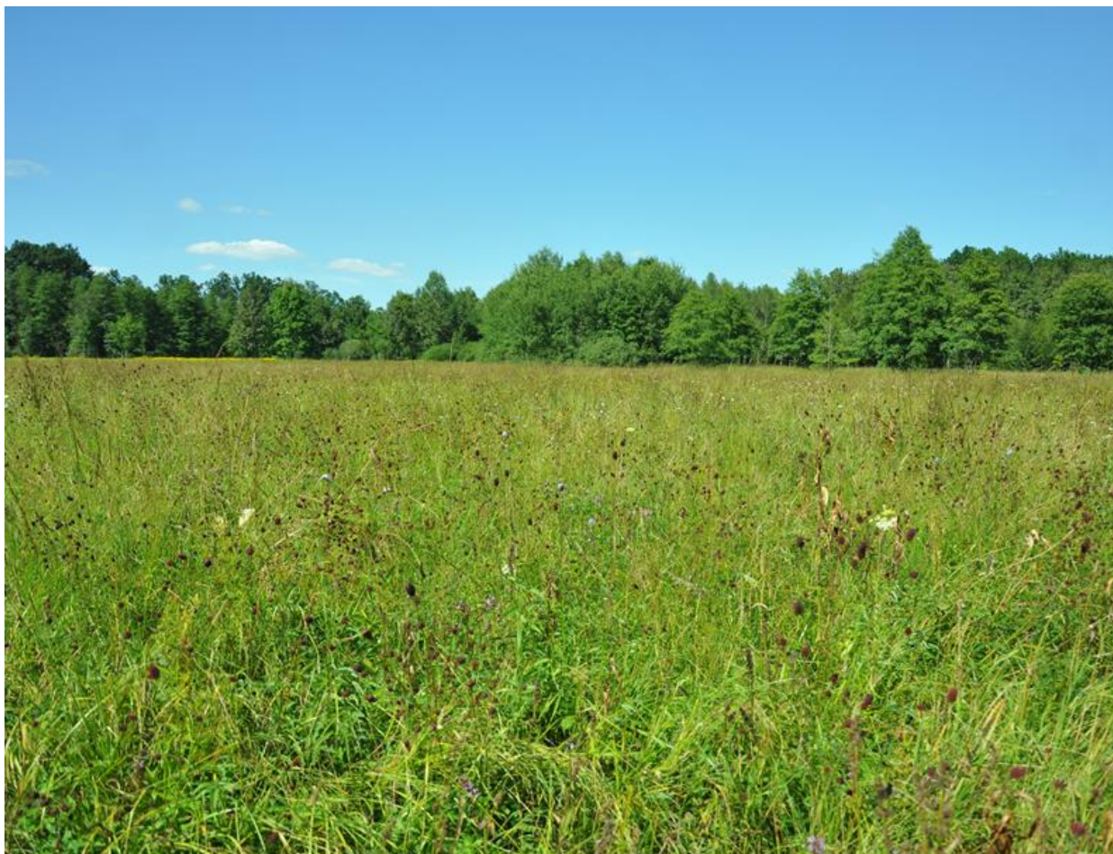
Fot. 1. Płat łąki trzęślicowej

Najistotniejszymi zagrożeniami istniejącymi dla siedliska 6410 są: sukcesja na skutek braku użytkowania, obecność gatunków ekspansywnych (trzcinnik piaskowy Calamagrostis epigejos , śmiełek darniowy Deschampsia caespitosa ) i inwazyjnych (nawłoc późna Solidago gigantea ), nagromadzenie materii organicznej.