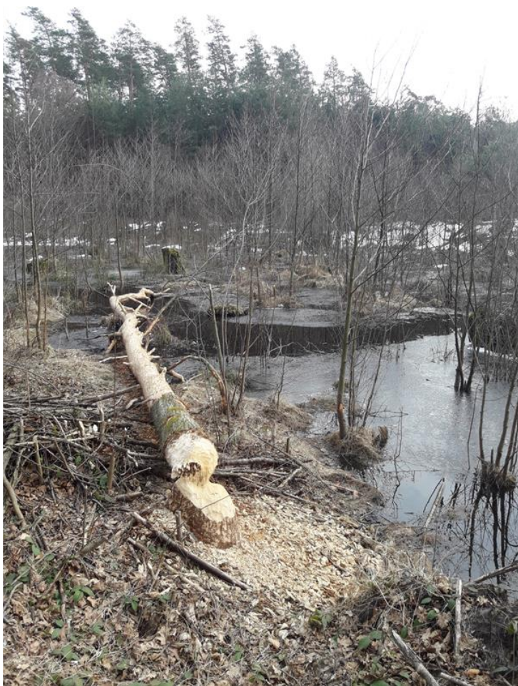
Fot. 8. Świeże zgryzienia bobrowe

Nie stwierdzono aktualnych zagrożeń, natomiast zagrożenia potencjalne związane są z bliskością głównych dróg oraz obecnością przepustów, stąd jako zagrożenie potencjalne można wymienić śmiertelność na drogach. Sąsiedztwo pól uprawnych i terenów prywatnych jest na obszarze sporadyczne, może jednak stwarzać potencjał konfliktów z działalnością bobrów, co z kolei może skutkować niszczeniem tam bobrowych i żeremi oraz kłusownictwem.