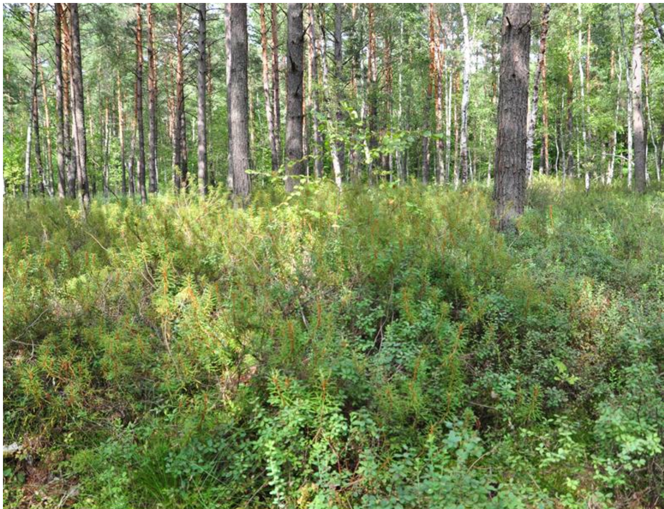
Fot. 5. Sosnowy bór bagienny Vaccinio uliginosi-Pinetum