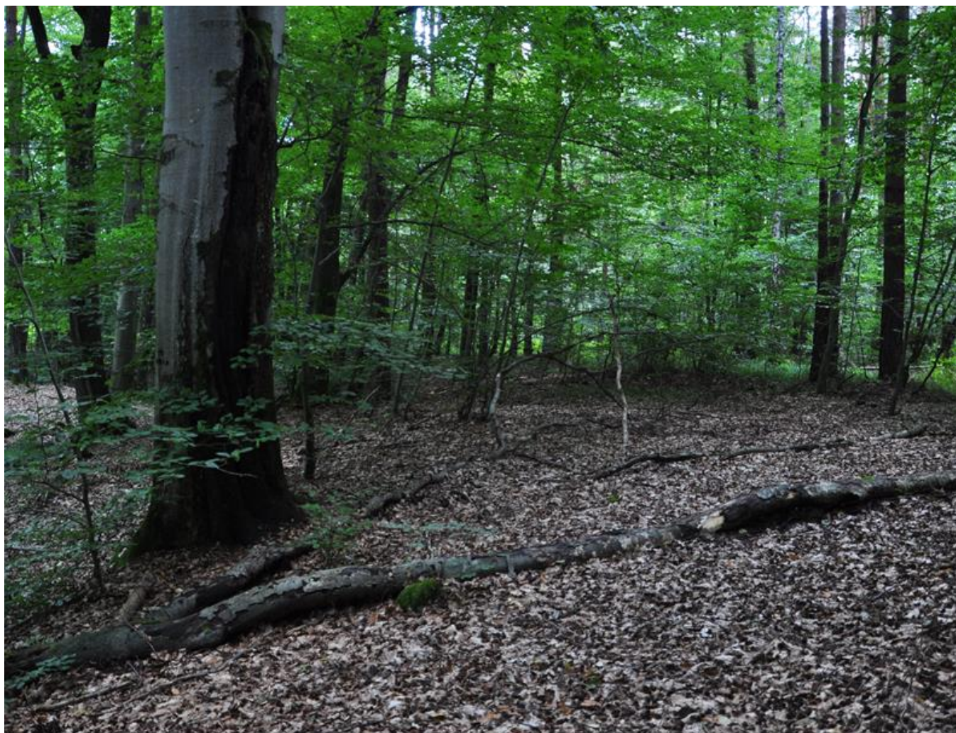
Fot. 3. Kwaśna buczyna