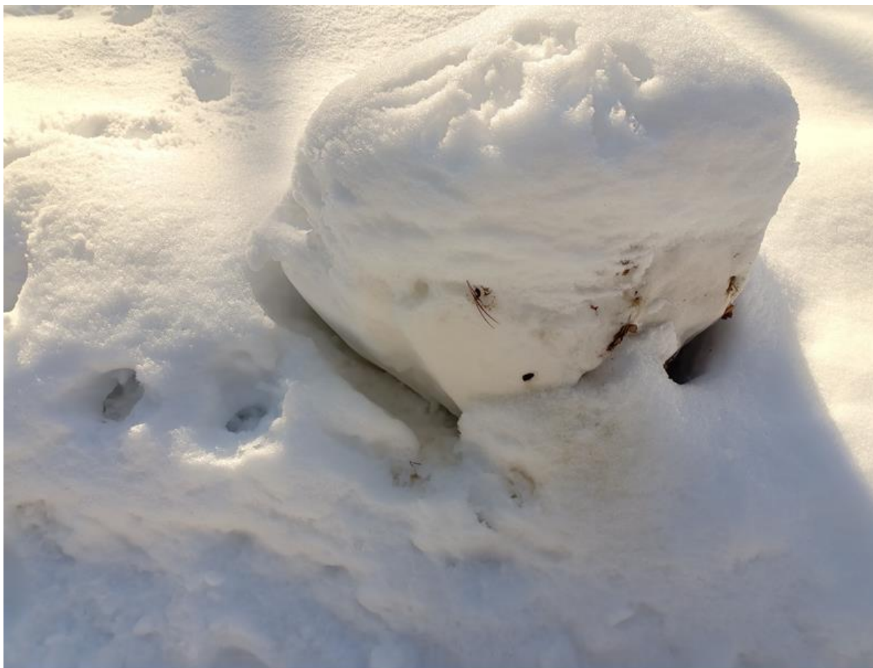
Fot. 7. Znakowanie moczem i tropy wilka Canis lupus