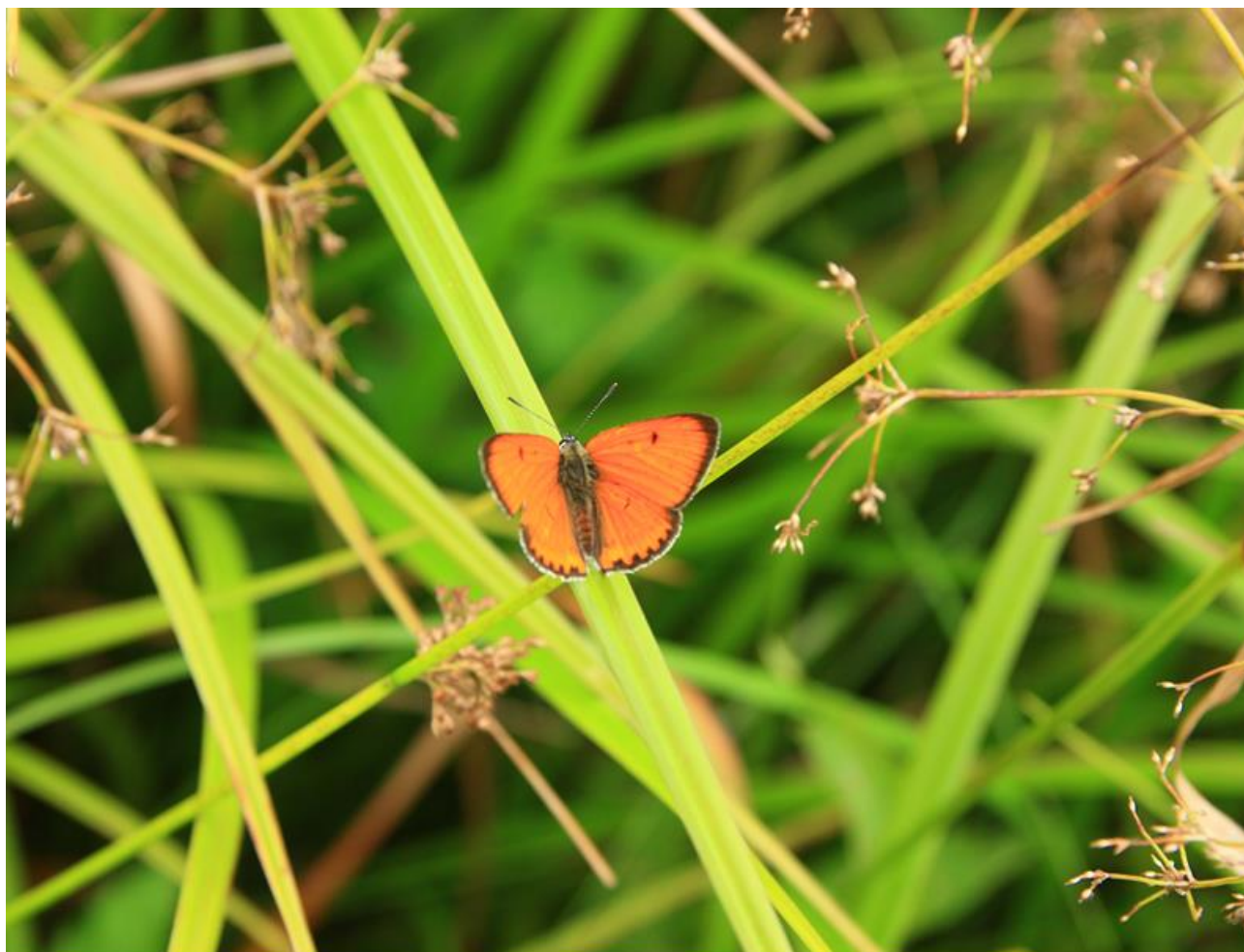
Fot. 11. Samiec czerwończyka nieparka Lycaena dispar