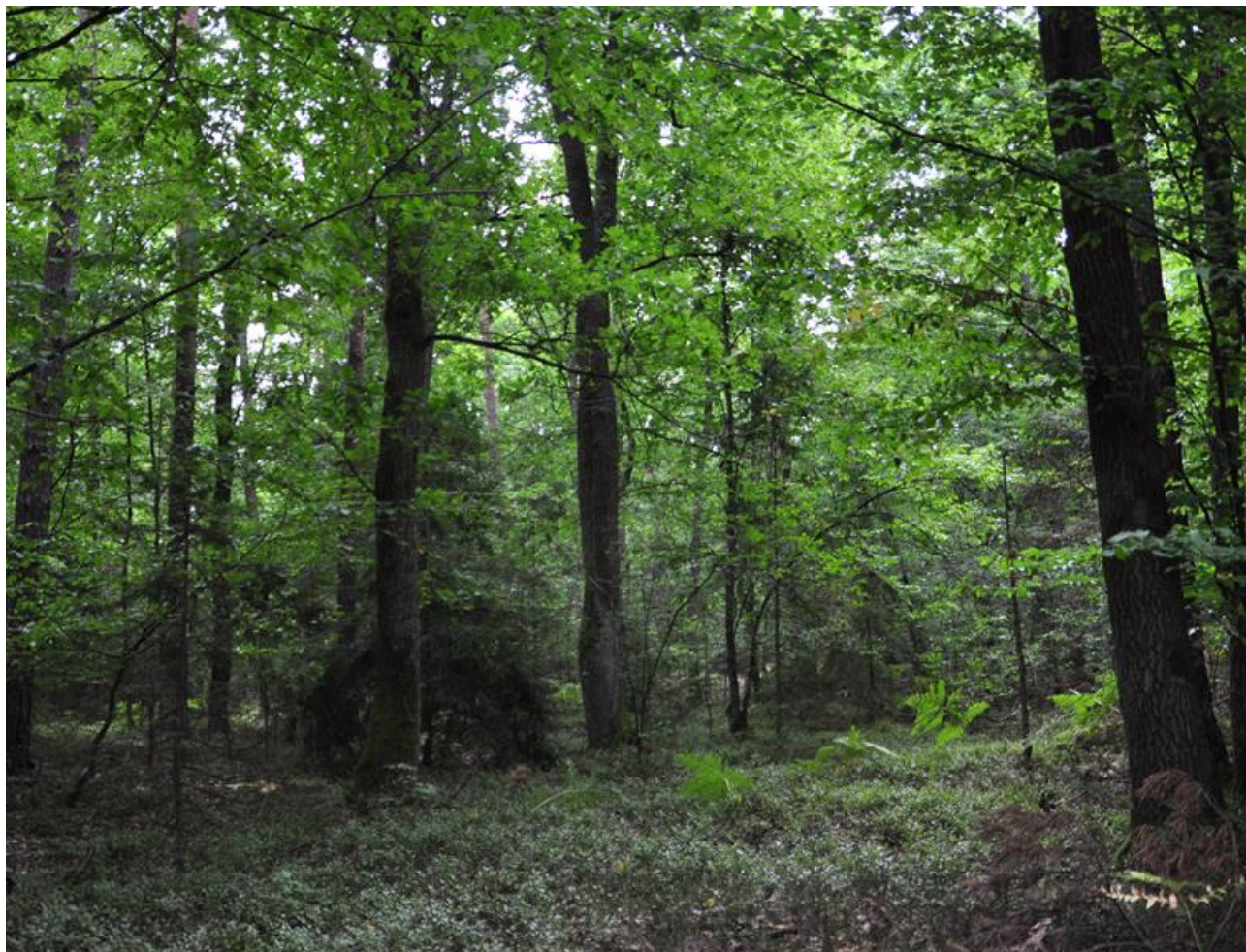
Fot. 6. Kwaśne dąbrowy (fot. A. Przemyski)