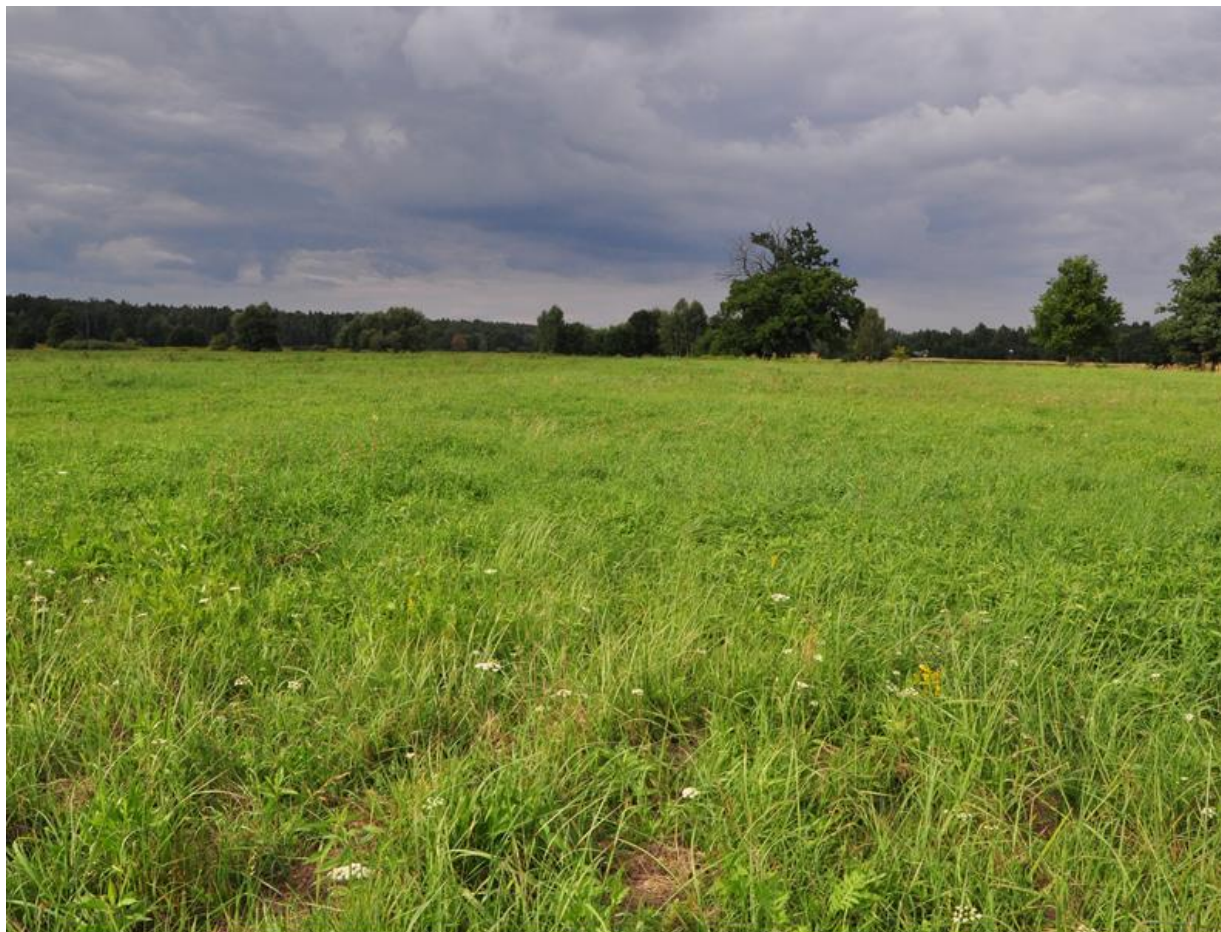
Fot. 2. Płat łąki świeżej