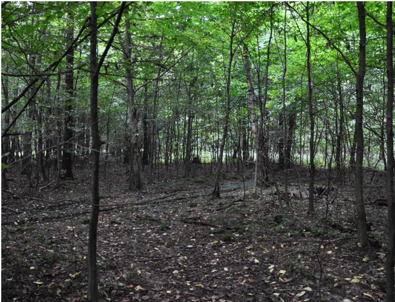
Fot. 4. Juwenilny fragment płatu grądu subkontynentalnego