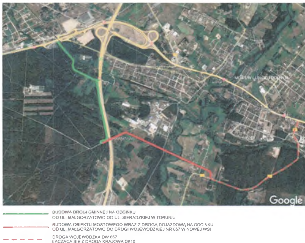
rys. nr 1 Schemat inwestycji

Natężenie ruchu przyjęte w modelu obliczeniowym nie uwzględnia rzeczywistych potoków ruchu generowanych w godzinach szczytu przez drogę krajową DK10, drogę wojewódzką DW 657 jak również ruchu ciężkiego generowanego przez zakłady przemysłowe zlokalizowane na terenie parku przemysłowego w Lubiczu Dolnym.