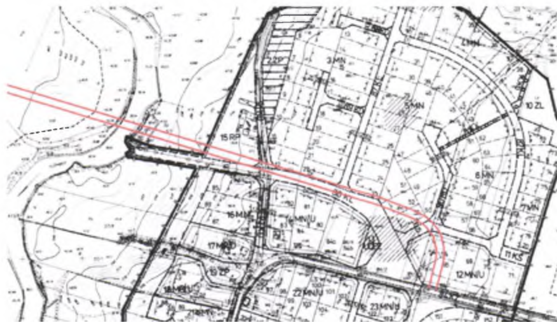
rys. nr 4 Przebieg inwestycji na tle obowiązującego planu zagospodarowania części wsi Nowa Wieś

Jak wykazano na poniższych analizach graficznych inwestycja jest sprzeczna z obowiązującym miejscowym planem zagospodarowania części wsi Nowa Wieś oraz części wsi Lubicz Dolny – Małgorzatowo.