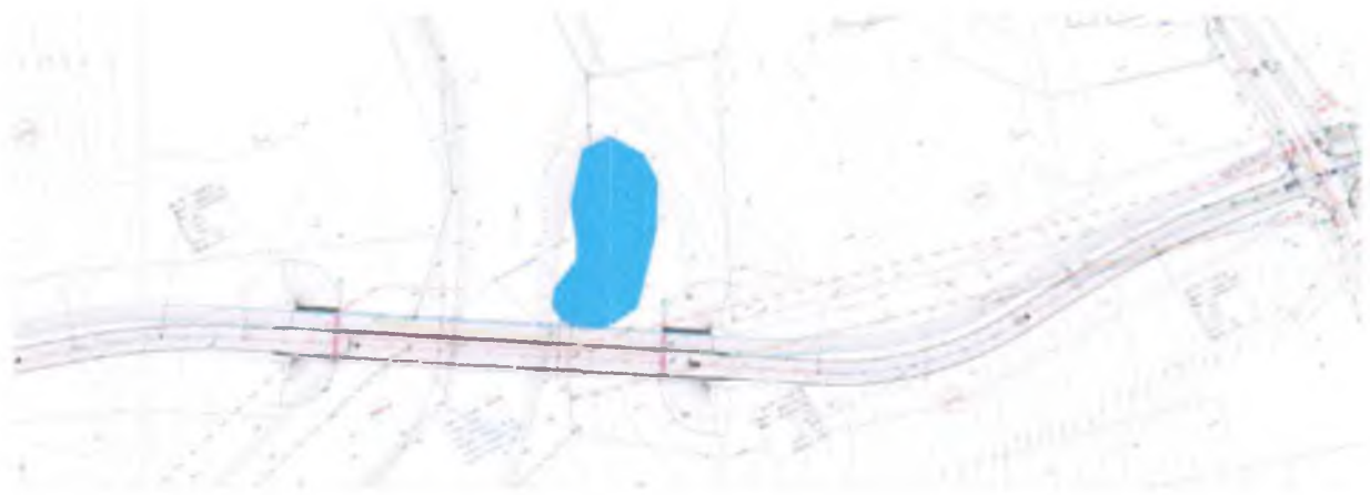
rys. nr 3 Wariant inwestycji niekolidujący ze starorzeczem Drwęcy. Starorzecze oznaczono kolorem niebieskim.