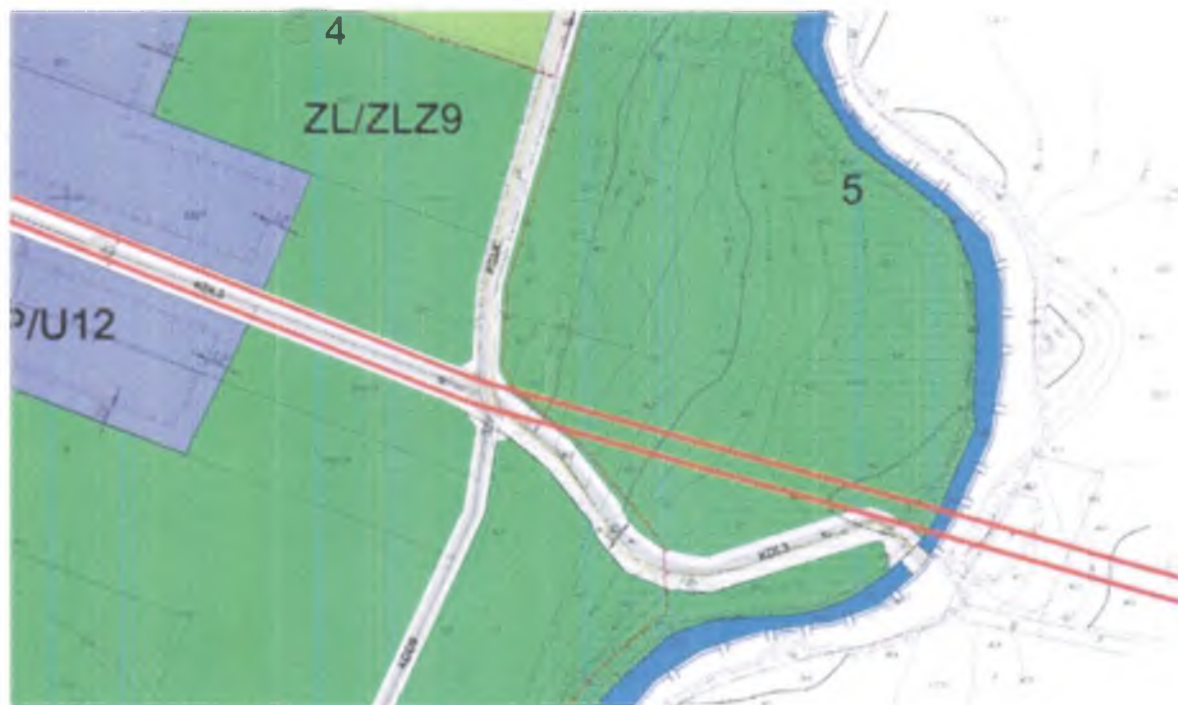
rys. nr 5 Przebieg inwestycji na tle obowiązującego planu zagospodarowania części wsi Lubicz Dolny – Małgorzатовo.

4. W raporcie, w punkcie dot. analizy możliwych konfliktów społecznych w związku z realizacją planowanego przedsięwzięcia ( str. 21 ) pominięto protesty mieszkańców 3 sołectw : Nowa Wieś , Lubicz Górny i Lubicz Dolny (kopie w załączeniu).