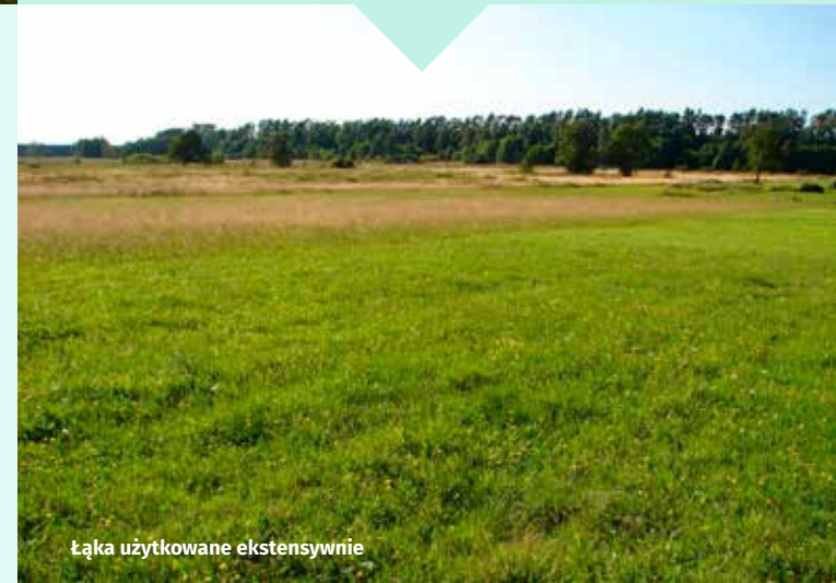
Łąka użytkowane ekstensywnie

Podstawowym walorem obszaru jest dobrze zachowany kompleks borów bagiennych i śródleśnych torfowisk przejściowych , wykształconych w rozległych obniżeniach terenu. Pierwszą grupę ekosystemów reprezentuje sosnowy bór bagienny – Vaccinio uliginosi-Pinetum , drugą – kilka zespołów torfowiskowych, m. in. zespół turzycy nitkowatej – Caricetum lasiocarpae , mszar przygiętkowy – Rhynchosporium albae oraz zespół wełnianki wąskolistnej i torfowca kończysteo – Eriophoro angustifolii-Sphagnetum recurvi .