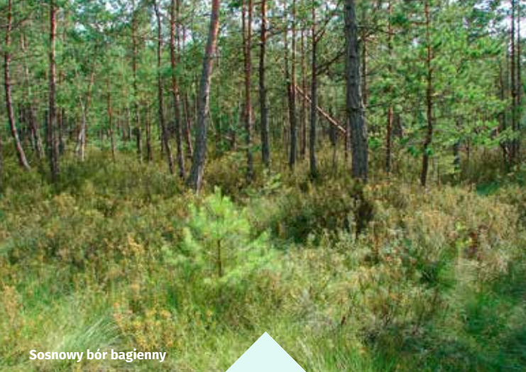
Sosnowy bór bagienny

Celem ochrony w tym obszarze jest utrzymanie arealów i właściwego stanu borów bagiennych oraz śródleśnych torfowisk przejściowych.