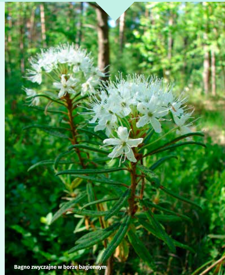
Bagno zwyczajne w borze bagiennym