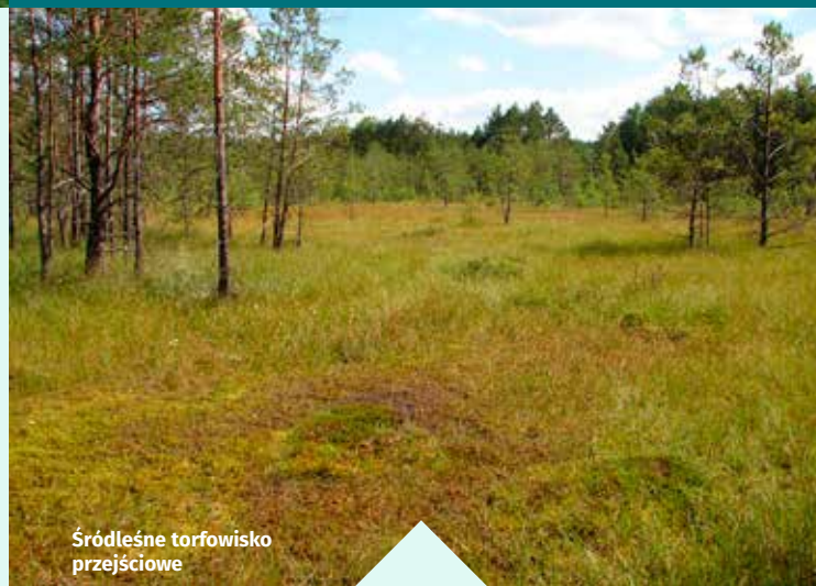
Śródleśne torfowisko przejściowe

Pozostałe, cenne przyrodniczo, siedliska to łąg olszowy , a w południowo-wschodniej części ekstensywnie użytkowane łąki świeże .