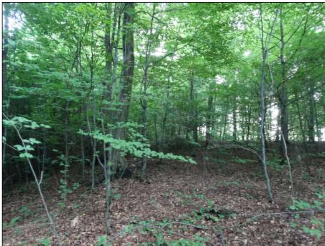
Juvenilny płat grądu typowego

pospolitą Corylus avellana . Runo zróżnicowane, ubogie w grądzie typowym i wysokim, znacznie bogatsze w grądzie niskim, nawiązujące do runa łąkowego. Uboższe płaty charakteryzują się występowaniem gatunków acydofilnych, typowych dla siedlisk mezotroficznych, w tym kosmatki gajowej Luzula luzuloides . Występuje tu także nieczelnica szerokolistna Dryopteris dilatata , gajowiec żółty Galeobdolon luteum , podagrycznik pospolity Aegopodium podagraria oraz nalot drzew i krzewów.