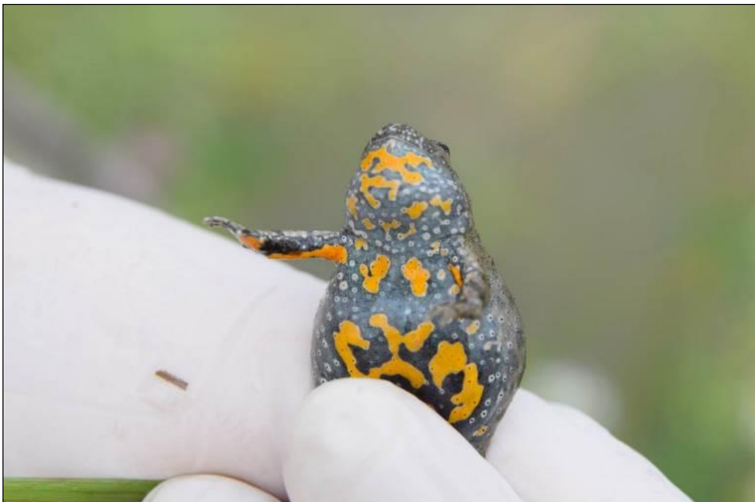
Fot. 2. Kumak nizinny Bombina bombina