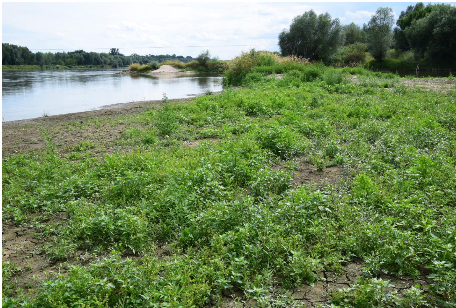
Fot. 2. Płat siedliska 3270 Zalewane muliste brzegi rzek z roślinnością Chenopodium rubri p.p. i Bidention p.p. w miejscowości Ciszycą, gmina Koprzywnica, fot. J. Starus