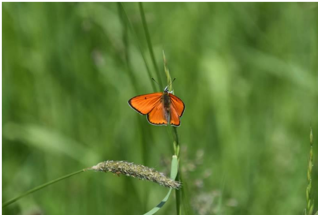
Fot. 3. Czerwończyk nieparek Lycaena dispar

Zagrożeniem dla gatunku jest zmiana warunków siedliskowych miejsc występowania, w tym przede wszystkim melioracje i osuszanie terenów podmokłych, gdzie występuje szczaw lancetowaty Rumex hydrolapatum ; najczęściej wykorzystywany jako roślina żywicielska dla larw motyla i w związku z tym tam też najliczniej występują osobniki dorosłe - imago. Kolejnym zagrożeniem jest częściowe zaniechanie koszenia, w wyniku czego uruchomione zostają procesy zarastania wkraczanie gatunków inwazyjnych i ekspansywnych.