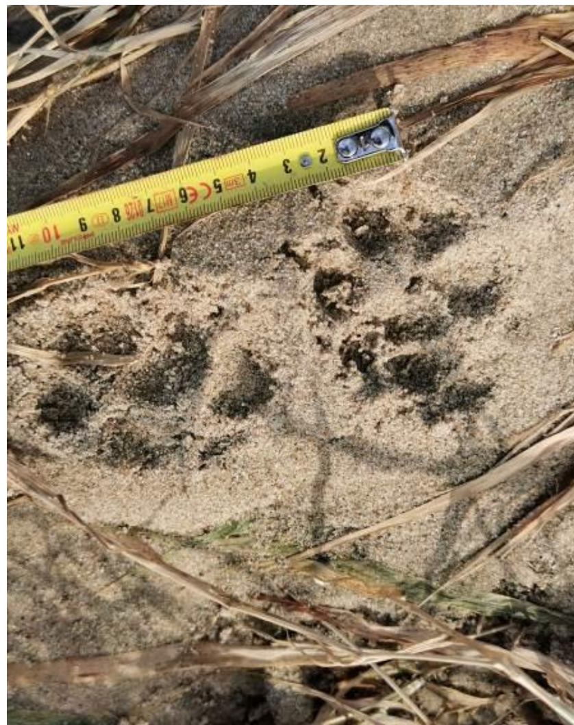
Fot. 10. Tropy wydry Lutra lutra