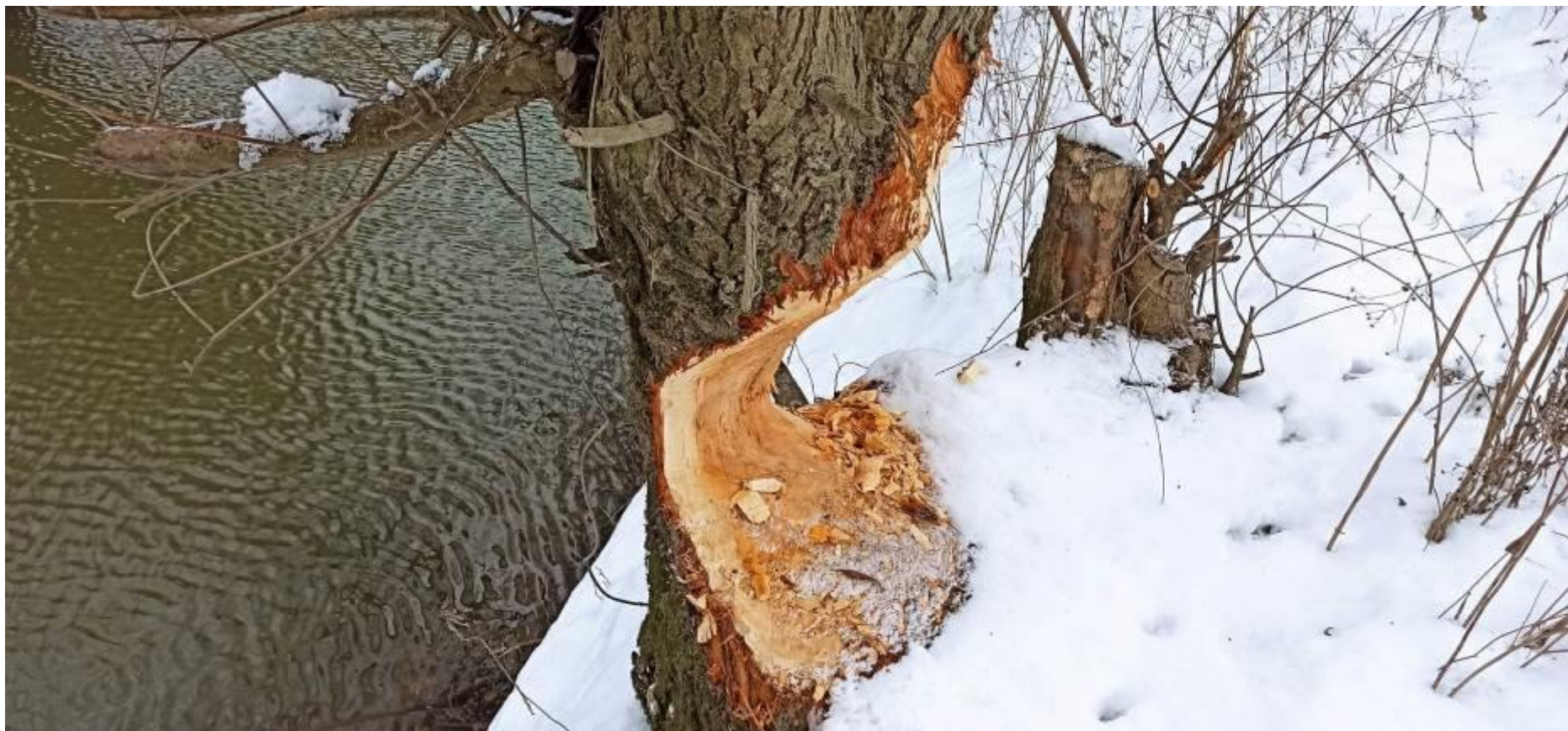
Fot. 9. Ślady obecności bobra Castor fiber