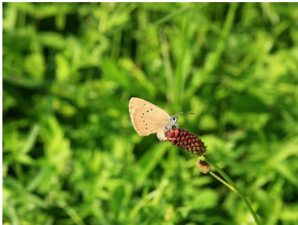
Fot. 4. Samica modraszka nausitousa Phengaris nausithous składająca jaja w kwiatostanie krwiściągą lekarskiego Sanguisorba officinalis