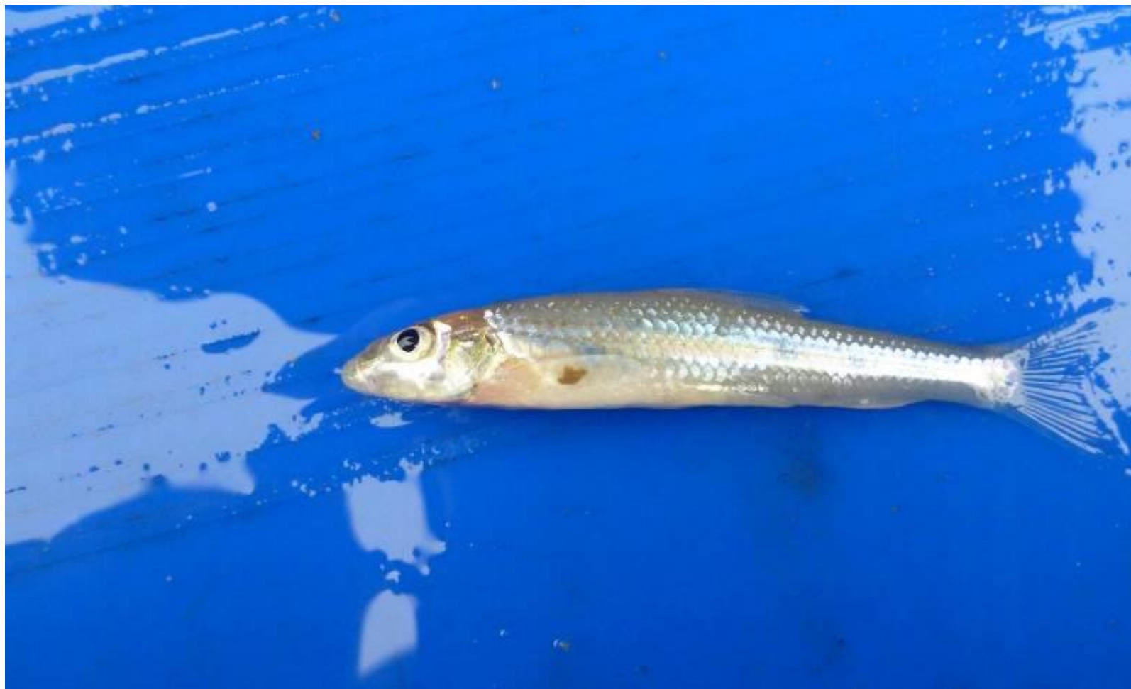
Fot. 5. Kiełb białopłetwy Romanogobio albipinnatus