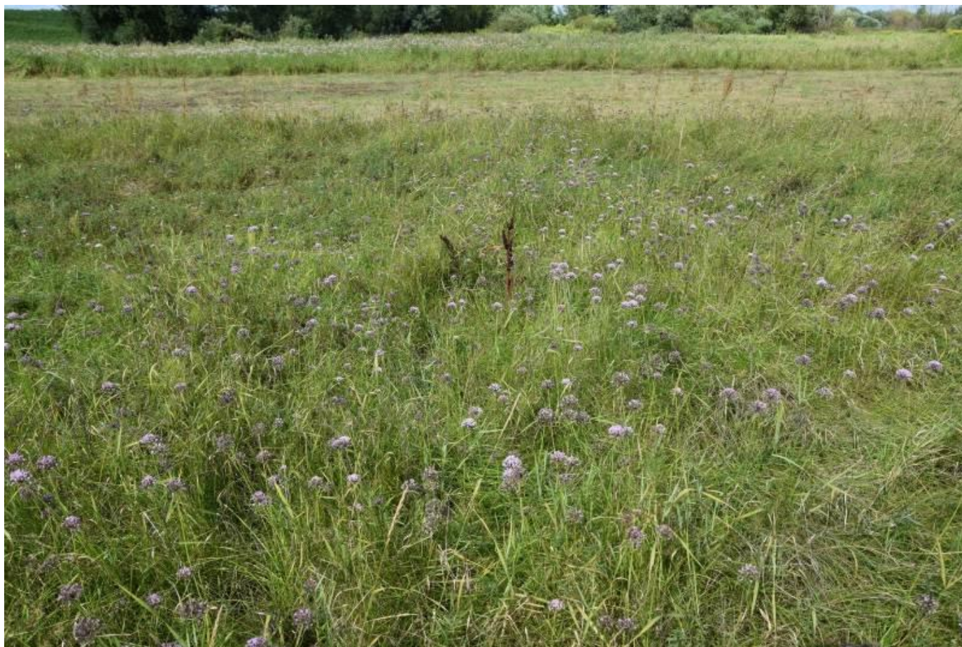
Fot. 5. 6440 Łąka selernicowa ( Cnidion dubii ) z dominującym czosnku kąowego Allium angulosum , fot. A. Przemyski