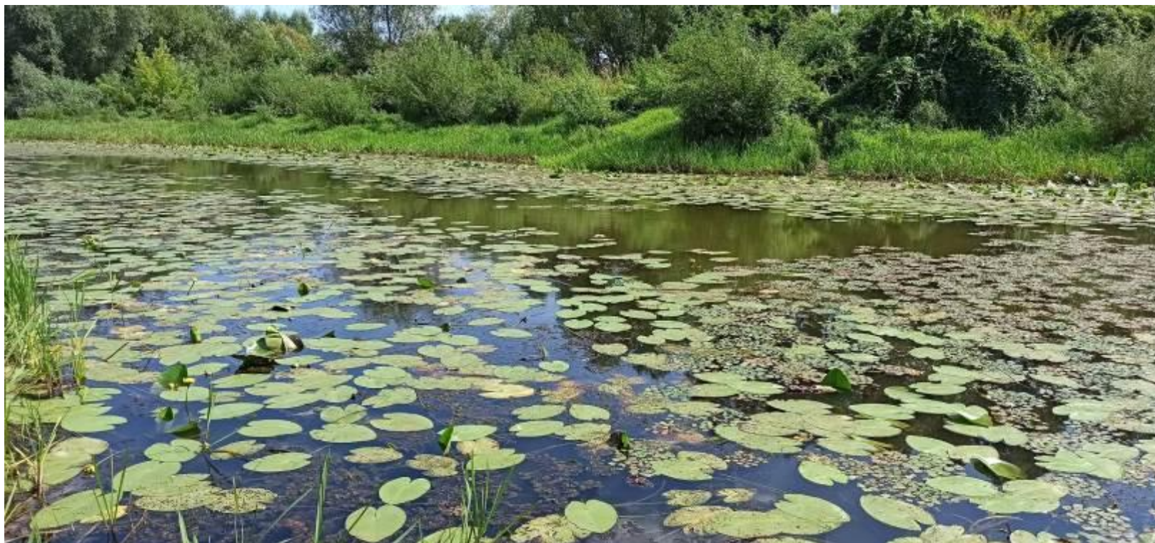
Fot. 1. Siedlisko 3150 starorzecza i naturalne eutroficzne zbiorniki wodne ze zbiorowiskami z Nymphaeion , Potamion