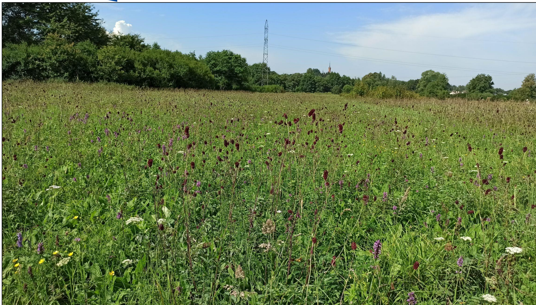
Fot. 15. Siedlisko modraszków telejusa Phengaris teleius i nausitousa Phengaris nausithous