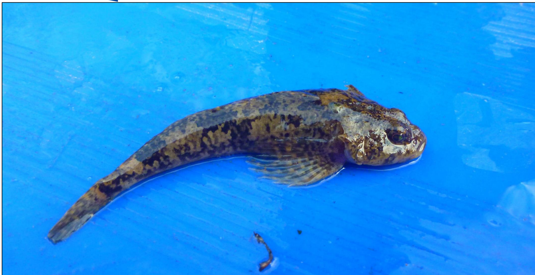
Fot. 10. Głowacz białopłetwy Cottus gobio