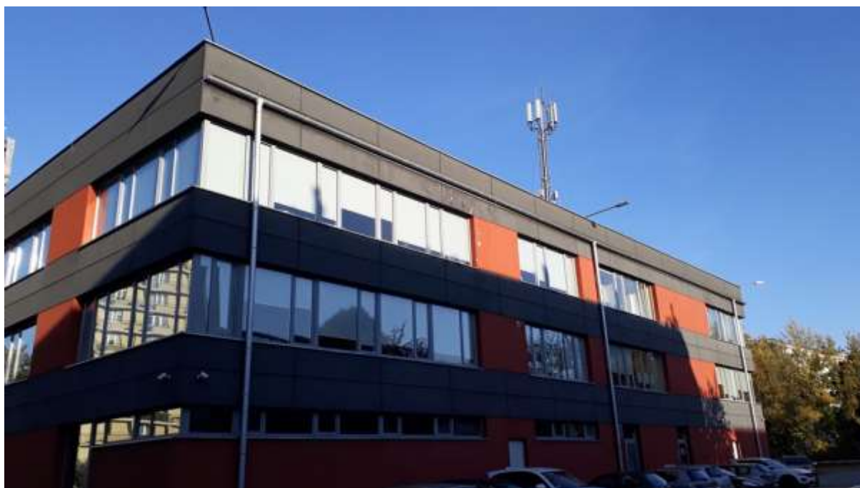
Fot. 1: Widoki anten stacji bazowej ID: 55314, zlokalizowanej: ul. Pocieszka 3, 85-519 Kielce