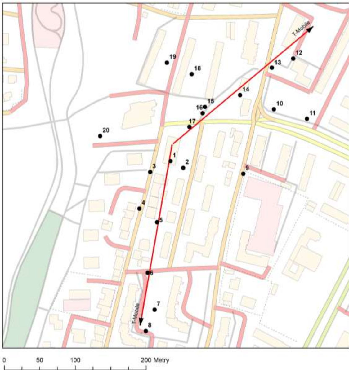
Rys. 1: Plan terenu, na którym znajduje się badana stacja bazowa

Lokalizacje pionów pomiarowych w otoczeniu badanej stacji bazowej przedstawiono na Rys. 1.