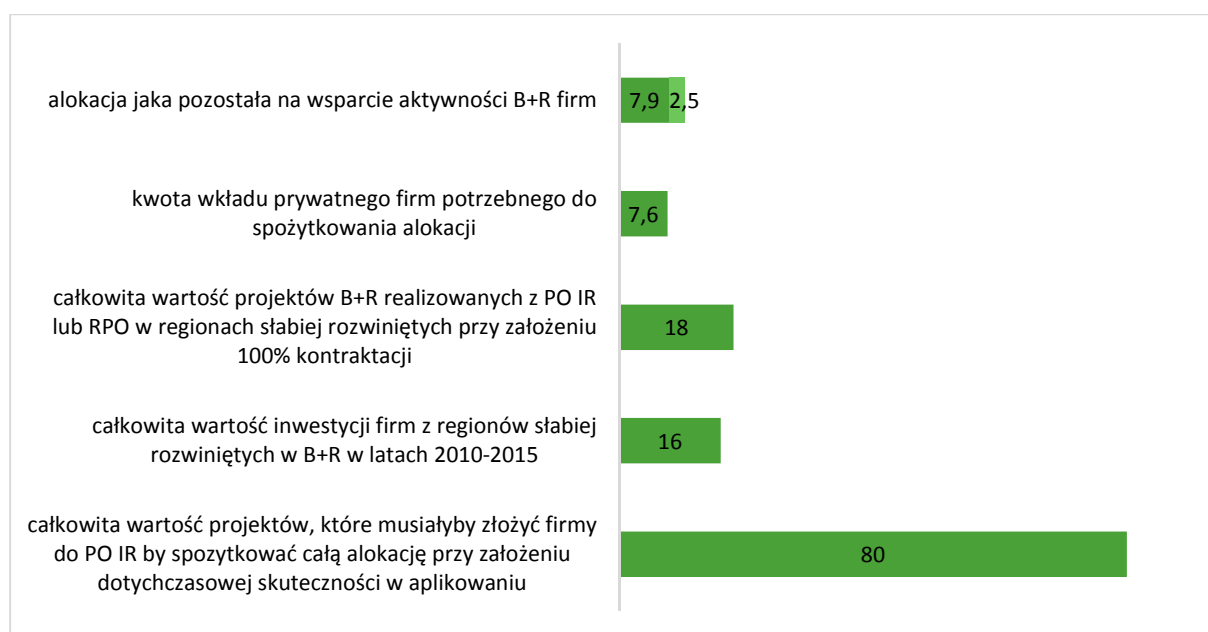
Wykres 2. Dane nt. zaangażowania finansowego firm w realizację projektów B+R