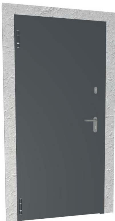
drzwi nr 1