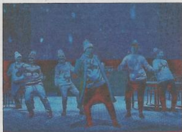
Twórcy spektaklu „Salto w tył” odbiorą Nagrodę im. Wyspiańskiego