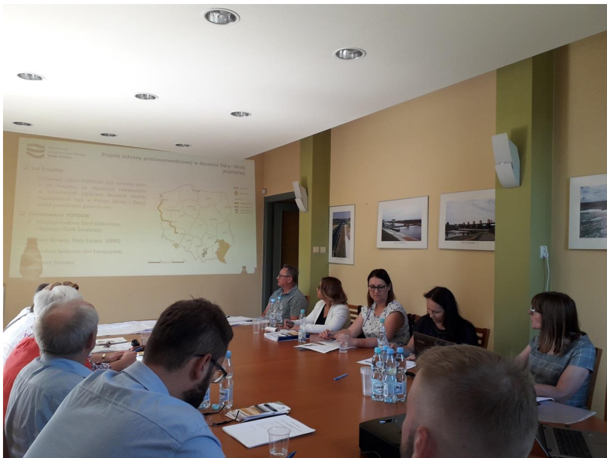
Photo 14. Public consultations for the Draft LA&RAP held in the office of PGW WP RZGW in Cracow – Water Supervision Unit in Cracow, Commune of Liszki, July 4, 2019.