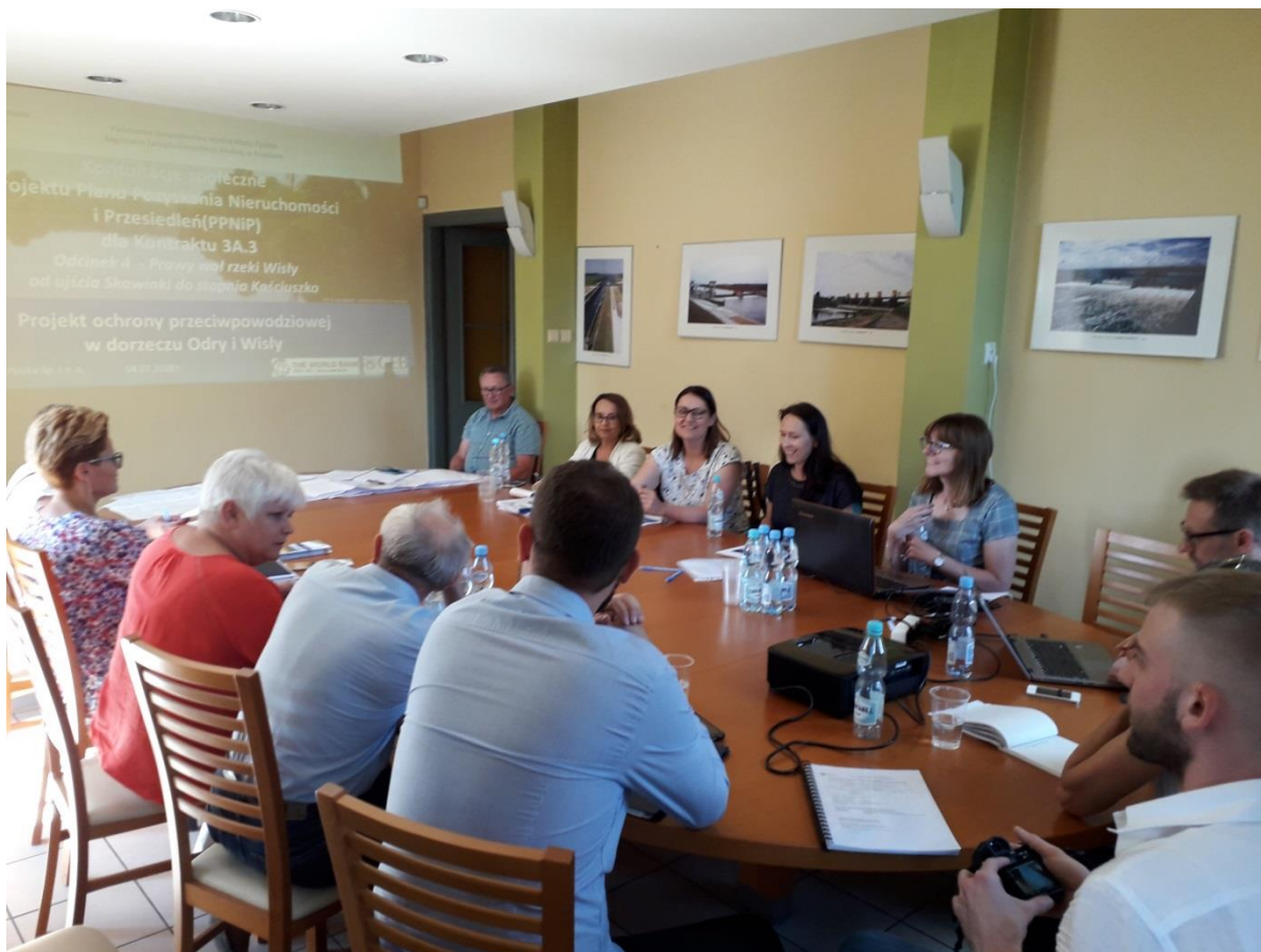
Photo 13. Public consultations for the Draft LA&RAP held in the office of PGW WP RZGW in Cracow – Water Supervision Unit in Cracow, Commune of Liszki, July 4, 2019.