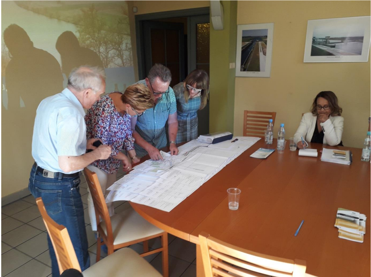
Photo 15. Public consultations for the Draft LA&RAP held in the office of PGW WP RZGW in Cracow – Water Supervision Unit in Cracow, Commune of Liszki, July 4, 2019.