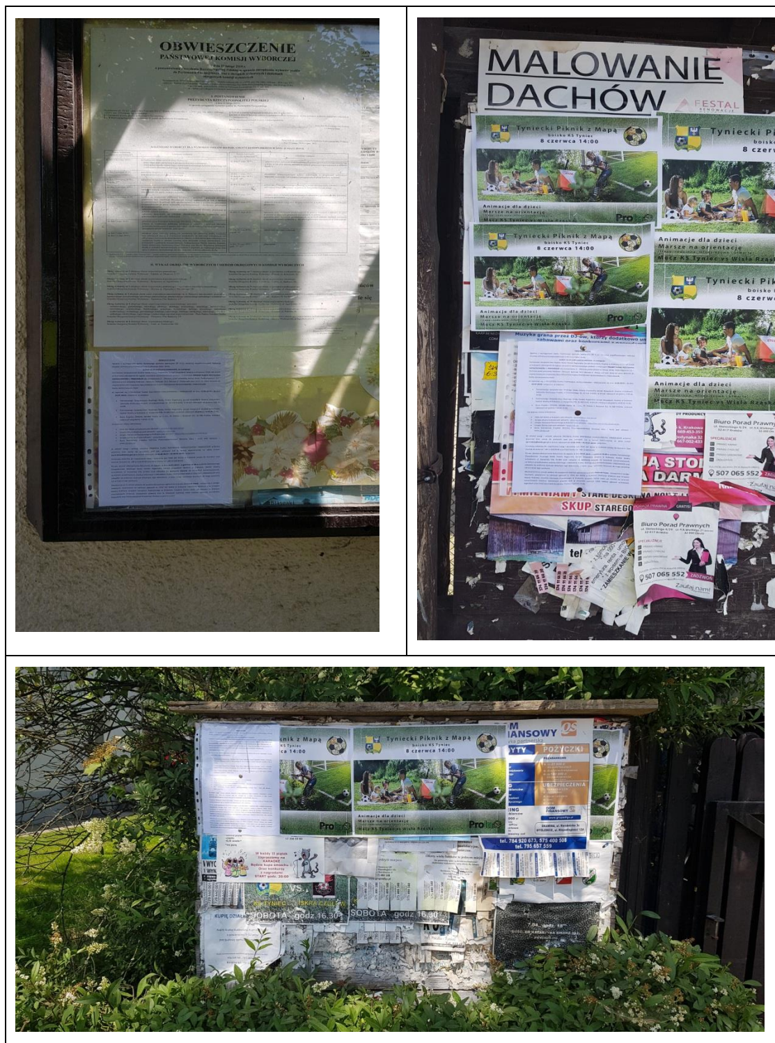
Photo 9-12. Announcement on public consultations for the Draft LA&RAP placed on a notice boards at performance sites (more photos available in archive of the PGW WP RZGW in Cracow).