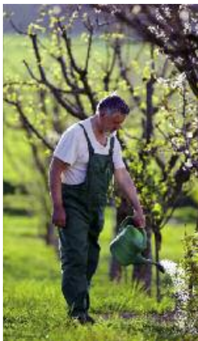
Prawo do uzyskania tzw. wcześniejszej emerytury rolniczej ma charakter wygasający

Przepisy tej ustawy nie zmieniają jednak dotychczasowej regulacji,