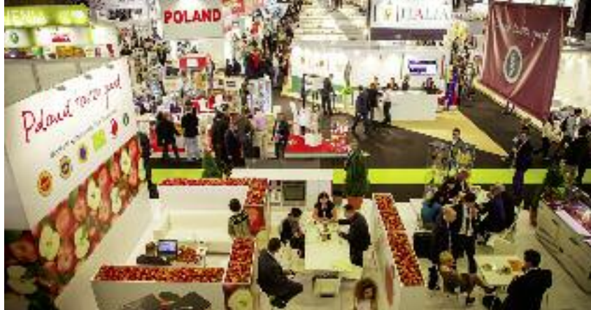
Strategia promocji żywności zakłada promowanie produktów rolnych i żywnościowych oraz metod ich produkcji i systemów jakości na rynku krajowym, wewnętrznym UE oraz w tzw. krajach trzecich

Strategia promocji żywności zakłada realizację działań informacyjnych i promocyjnych dotyczących rolnictwa i gospodarki żywnościowej, promowanie produktów rolnych i żywnościowych, metod ich produkcji, a także systemów jakości produktów rolnych i żywnościowych na rynku krajowym, wewnętrznym UE, a także w krajach tak zwanych trzecich. Pomimo, iż Unia Europejska pozostaje największym odbiorcą polskich produktów rolno-spożywczych, głównym motorem wzrostu będzie w przyszłości ekspansja na rynki pozaunijne. Dlatego też, strategia wyznacza priorytetowe kierunki promocji, które koncentru-