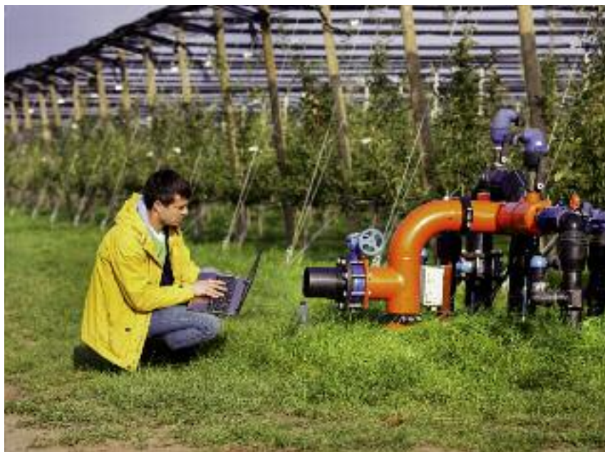
i zakładanie oraz wyposażenie sadów oraz plantacji wieloletnich