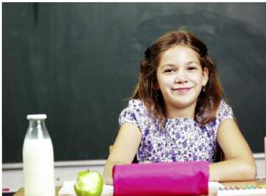
W rozpoczętym roku szkolnym z programu skorzysta ok. 2 mln uczniów z klas I-V szkół podstawowych