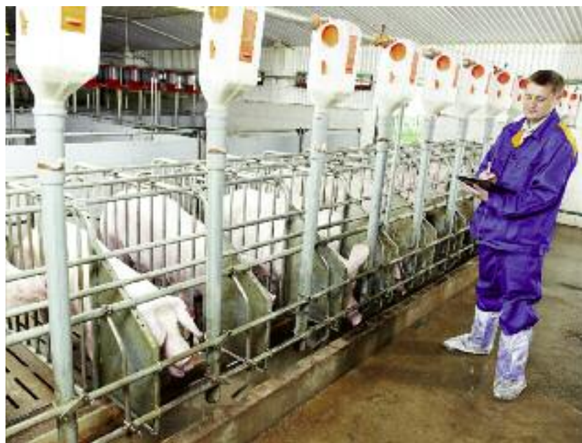
Producenci trzody chlewnej z obszarów objętych ASF mogli ubiegać się o pomoc w ramach tzw. pakietu Hogana, na realizację którego przeznaczono 98 mln zł

łania w kraju i na arenie międzynarodowej. Już w grudniu 2015 roku minister rolnictwa Krzysztof Jurgiel wystosował pismo do komisarza UE ds. zdrowia i bezpieczeństwa żywności Vytenisa Andriukaitisa, w którym wyrażał zaniepokojenie złą sytuacją epizootyczną na Ukrainie. Zapeloował do Komisji Europejskiej o podjęcie pilnych działań i konieczność zaproponowania stronie ukraińskiej natychmiastowego wsparcia finansowego w celu monitorowania, zwalczania i kontroli ASF na terytorium Ukrainy oraz zabezpieczenia granicy UE-Ukraina przed przeniesieniem się wirusa ASF. W grudniu Minister wystosował też pismo do ministra polityki rolnej i gospodarki żywnościowej Ukrainy Ołeksija Pawłenko, w którym zwracał uwagę na ten problem oraz na możliwość i konieczność zintensyfikowania współpracy strony ukraińskiej z Komisją Europejską. Kwestie dotyczące zwalczania wirusa i pomocy producentom trzody chlewnej podnoszone były przez Polskę wielokrotnie także podczas unijnej rady ministrów. Te zagadnienia znalazły się także we wspólnym oświadczeniu ministrów