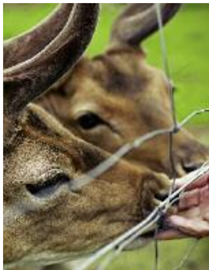
Pomoc może zostać przyznana na operacje obejmujące inwestycje związane z produkcją zwierzęcą wyłącznie w zakresie zwierząt trawożernych, w tym m.in. danieli