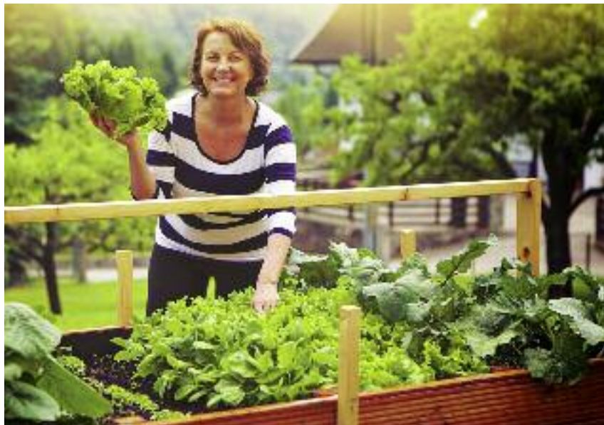
Rolnik przekazujący gospodarstwo może pozostawić sobie grunty rolne o powierzchni nie przekraczającej 0,5 ha, z zastrzeżeniem, że prowadzona na tych gruntach działalność rolnicza służyć będzie wyłącznie zaspokajaniu potrzeb własnych rolnika oraz osób pozostających z nim we wspólnym gospodarstwie

nie gospodarstwa o powierzchni równej co najmniej średniej powierzchni gruntów rolnych w gospodarstwie rolnym w województwie. Jeżeli gospodarstwo rolne jest położone na obszarze więcej niż jednego województwa za właściwe do ustalenia spełnienia tego kryterium uznaje się to, w którym jest położona największa część gruntów rolnych tego gospodarstwa, według stanu po przejściu gruntów rolnych od przekazującego.