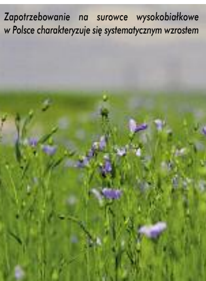
Zapotrzebowanie na surowce wysokobiałkowe w Polsce charakteryzuje się systematycznym wzrostem