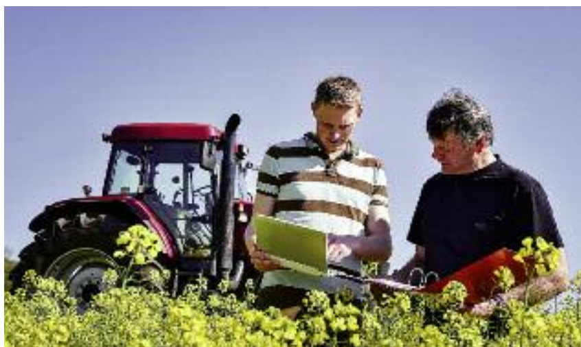
Rolnik przejmujący gospodarstwo rolne od przekazującego musi zostać wskazany przez wnioskodawcę we wniosku o przyznanie pomocy

Przepisy przewidują możliwość pozostawienia sobie przez rolnika gruntów rolnych o powierzchni nieprzekraczającej 0,5 ha z zastrzeżeniem, że działalność rolnicza prowadzona na tych gruntach może służyć wyłącznie zaspokajaniu potrzeb własnych rolnika oraz osób pozostających z nim we wspólnym gospodarstwie domowym. Do określenia wielkości gospodarstwa wnioskodawcy po zakończeniu prowadzenia działalności rolniczej przyjmowana jest powierzchnia gruntów rolnych posiadanych lub współposiadanych przez niego jak również przez jego małżonka.