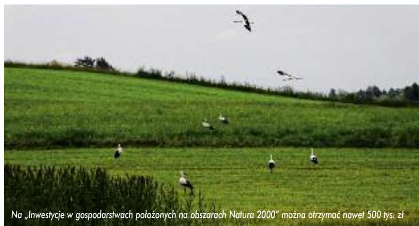
Na „Inwestycje w gospodarstwach położonych na obszarach Natura 2000” można otrzymać nawet 500 tys. zł

✓ zmiana profilu prowadzonej w gospodarstwie produkcji na produkcję zwierzęcą w zakresie zwierząt trawożernych.