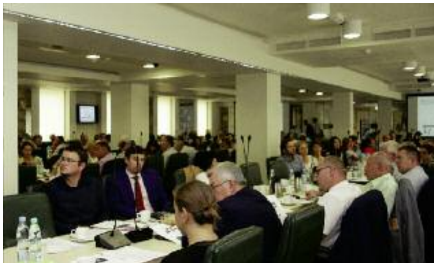
W konferencji uczestniczyli m.in. wojewodowie, reprezentanci WODR, instytutów naukowych i uczelni oraz organizacji i związków branżowych

gii rozwoju kapitału społecznego „Współdziałanie, kultura, kreatywność”, (4) Strategii Sprawne Państwo, (5) Krajowej Strategii Rozwoju Regionalnego, (6) Strategii rozwoju transportu, (7) Polityce Energetycznej Polski, (8) Polityce ekologicznej państwa].