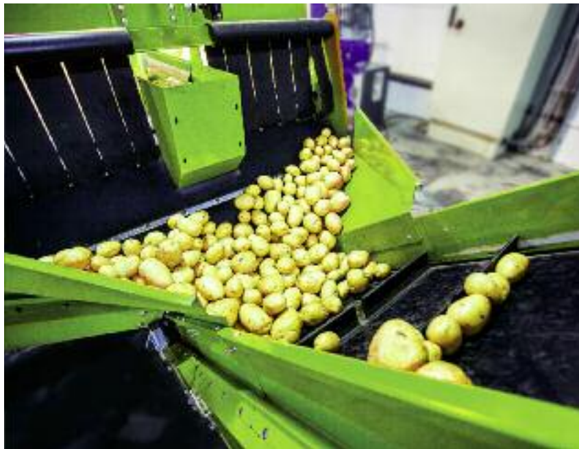
Preferencyjny kredyt można również przeznaczyć na zakup i instalację maszyn lub urządzeń do przetwarzania, przygotowania do przetwarzania oraz magazynowania produktów rolnych

Ponadto, gospodarstwa rolne, działy specjalne produkcji rolnej oraz podmioty zajmujące się rybacstwem śródlądowym w przypadku wystąpienia szkód spowodowanych przez suszę, grad, deszcz nawalny, ujemne skutki przezimowania, przymrozki wiosenne, powódź, huragan, piorun, obsunięcie się ziemi lub lawinę mogą zaciągać kredyty „klęskowe”. Kredyty „klęskowe” udzielane są przez banki w terminie do 12 miesięcy od daty oszacowania szkód przez komisję powołaną przez wojewodę i służą finansowaniu nakładów poniesionych po dniu wystąpienia szkody.