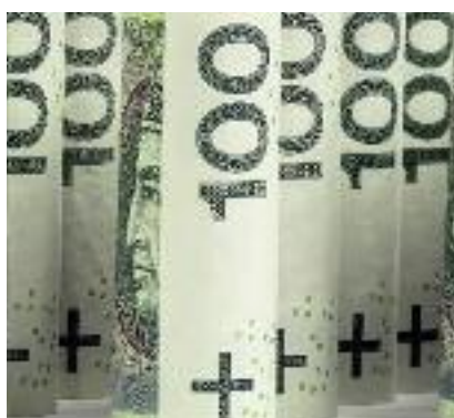
ARiMR dysponuje środkami finansowymi gwarantującymi pełen dostęp do preferencyjnych kredytów inwestycyjnych i „klęskowych”.

• zakup środków transportu do sprawnego przebiegu procesu technologicznego lub do magazynowania, a także zakup specjalistycznych środków transportu do dostaw surowca lub zbytu produktów.