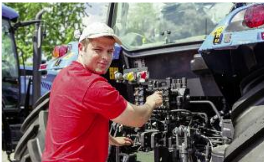
Największym zainteresowaniem w resortowych szkołach rolniczych cieszą się zawód technika mechanizacji rolnictwa

W 2017 r. budżet resortowych szkół rolniczych został określony na poziomie 211 436 tys. zł. W ramach tej kwoty 24 904 tys. zł przeznaczono na wydatki majątkowe. Ponadto zaplanowano środki w wysokości 5 790 tys. zł na wspól-