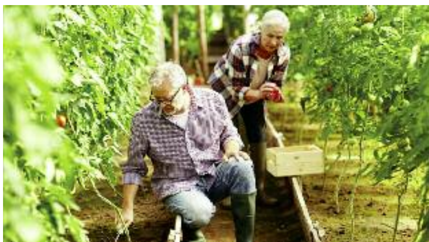
W 2016 r. liczba producentów ekologicznych w Polsce wyniosła ponad 23 tys.

cześnie wnioski o udzielenie dotacji jednostki naukowo-badawcze będą mogły składać do końca grudnia, a nie jak dotychczas do końca stycznia. Do dnia 30 września ogłoszone zostaną także tematy i obszary badawcze, w ramach których będzie można ubiegać się o uzyskanie dotacji (do tej pory wykaz ten był ogłaszany z końcem listopada). Wprowadzone zmiany zapewniają