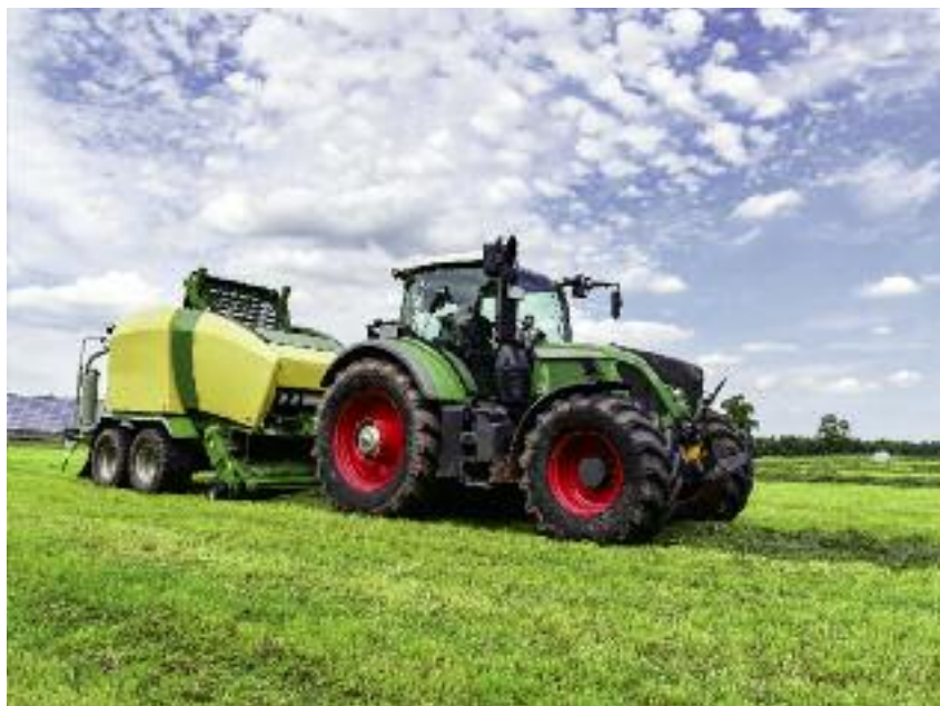
zakup sprzętu do uprawy, pielęgnacji, ochrony, nawożenia oraz zbioru roślin...

Zakupione lub zakupione i zainstalowane maszyny i urządzenia nie mogą mieć w dniu sprzedaży więcej niż 5 lat oraz nie mogły być wcześniej nabyte z wykorzystaniem środków publicznych. Również zakup użytków rolnych, budynków i budowli nie może być objęty po-