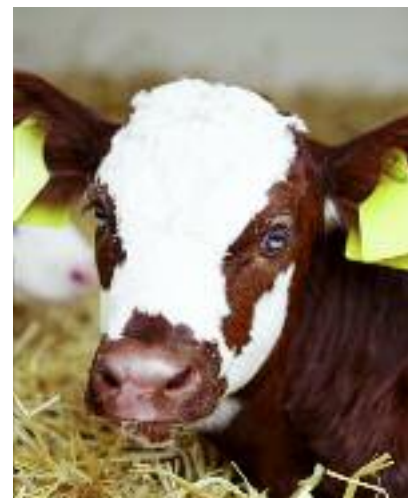
Środki trwałe zniszczone na skutek niekorzystnych zjawisk atmosferycznych można odtworzyć korzystając z tzw. kredytów „klęskowych”. Zakres przedmiotowy obejmuje m.in. zakup stada podstawowego inwentarza żywego...

spodarstw rolnych lub 8 mln zł dla działów specjalnych produkcji rolnej. Od kredytobiorcy nie wymaga się wkładu własnego.