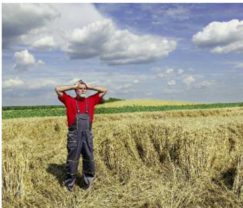
Od 4 września rolnicy, którzy ponieśli straty w wyniku klęsk żywiołowych mogą składać w ARiMR wnioski o pomoc

chowywania, magazynowania, przygotowywania do sprzedaży produktów rolnych (łącznie ze zlokalizowanymi w tych budynkach pomieszczeniami higieniczno-sanitarnymi), wraz z zakupem lub montażem instalacji technicznej, zakupem wyposażenia, kosztami rozbiórki i utylizacji materiałów szkodliwych pochodzących z rozbiórki pod warunkiem, że rozbiórka jest niezbędna do realizacji operacji;