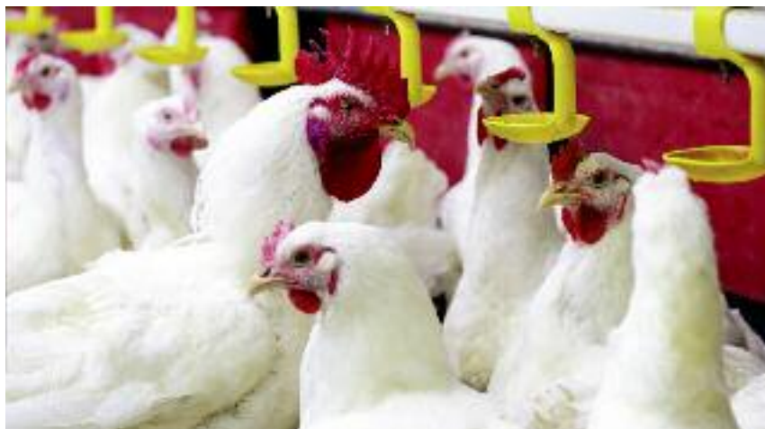
Z punktu widzenia wartości żywieniowej obecnie nie ma możliwości zastąpienia śrutu sojowej śrutami roślin strączkowych oraz śrutą rzepakową, której poziom w dawce pokarmowej nie można przekraczać, aby nie spowodować obniżenia produktywności u zwierząt