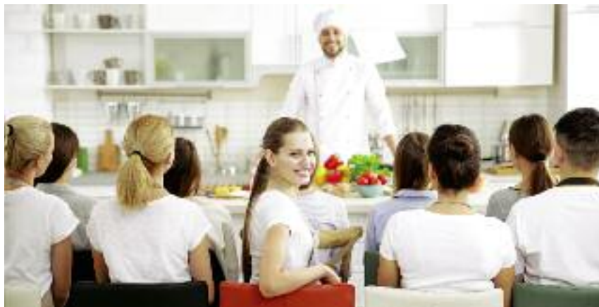
W zawodach związanych z żywnością i gastronomią kształcą się blisko 3 tys. osób

finansowanie realizacji, przez niektóre szkoły, projektów z udziałem środków UE, jak również związanych z tym budżet środków europejskich na poziomie 20 390 tys. zł.