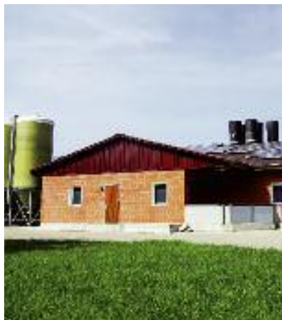
Preferencyjnym kredytowaniem może zostać m.in. objęta budowa, przebudowa i remont połączony z modernizacją budynków lub budowli służących do produkcji rolnej...

pląty do oprocentowania stosowane są jako pomoc de minimis ;