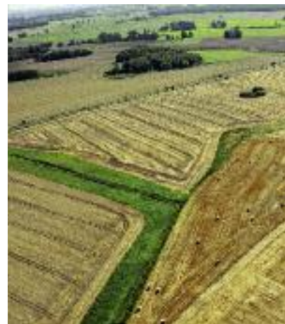
oraz zakup użytków rolnych ...

wego kredyt preferencyjny można uzyskać na realizację m.in. następujących inwestycji: