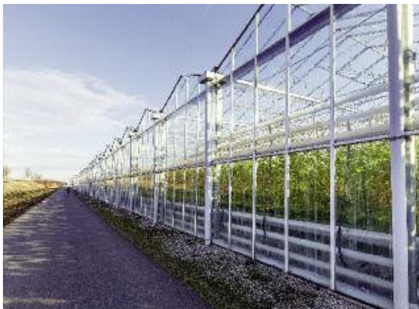
oraz odbudowę i niezbędne remonty szklarni i innych budynków i budowli służących do produkcji