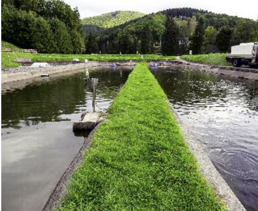
Kredyt z linii RR może zostać przeznaczony także na inwestycje w rybnictwie śródlądowym

Dopłaty do oprocentowania kredytu z linii Z, a także kredytów „kłęskowych” w przypadkach, gdy szkody wynoszą nie więcej niż 30% średniej rocznej produkcji rolnej, są stosowane jako pomoc de minimis w rolnictwie. Wysokość tej pomocy, udzielonej jednemu podmiotowi, nie może przekroczyć równowartości 15 000 euro w okresie trzech lat, tj. w bieżącym roku podatkowym i w ciągu poprzedzających go 2 lat podatkowych, z uwzględnieniem kwot pomocy de minimis w rolnictwie ze wszystkich tytułów. Natomiast dopłaty do oprocentowania kredytu z linii PR na zakup akcji lub udziałów udzielane są jako pomoc de minimis lub pomoc de