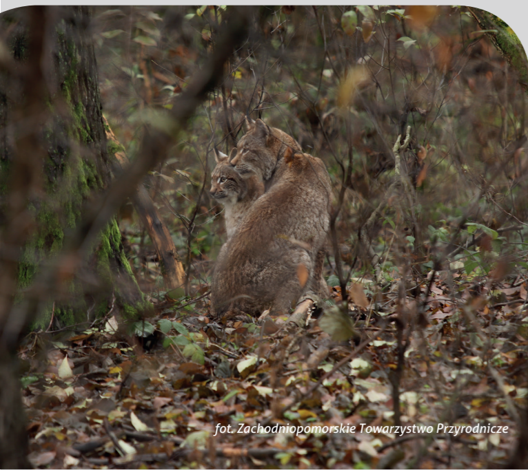
fot. Zachodniopomorskie Towarzystwo Przyrodnicze

Zdjęcia na okładce: wilk, żubr, bóbr - C. Korkosz, ryś - Ł. Limarowski