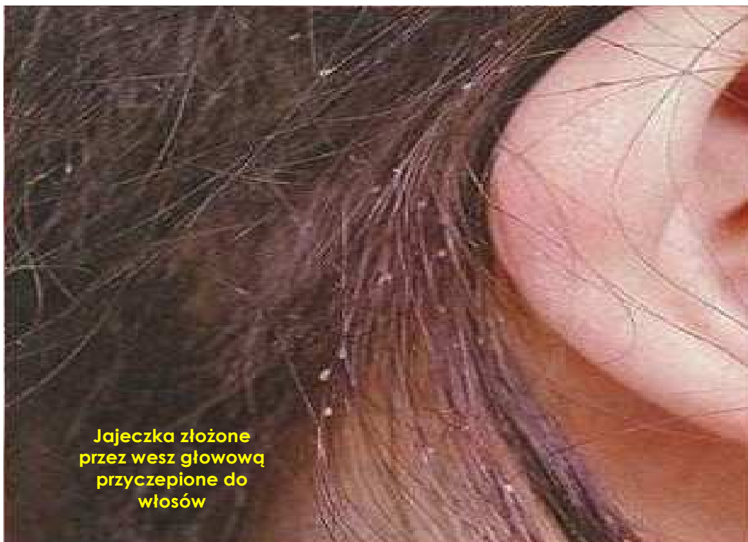
Jajeczka złożone przez wesz głowową przyklepione do włosów

Okres wylegania – cykl życiowy wszy składa się z 3 stadiów: jaja, larwy (3 stadia) i postaci dorosłej. W sprzyjających warunkach cały cykl życiowy trwa około 3 tygodni.