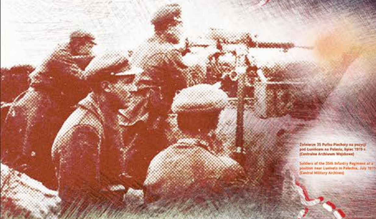
Żołnierze 35 Pułku Piechoty na pozycji pod Łunińcem na Polessiu, lipiec 1917 r. Soldiers of the 35th Infantry Regiment at a position near Luninets in Polesia, July 1917.