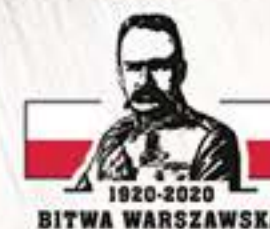
Polacy w Wilnie, październik 1920 r.