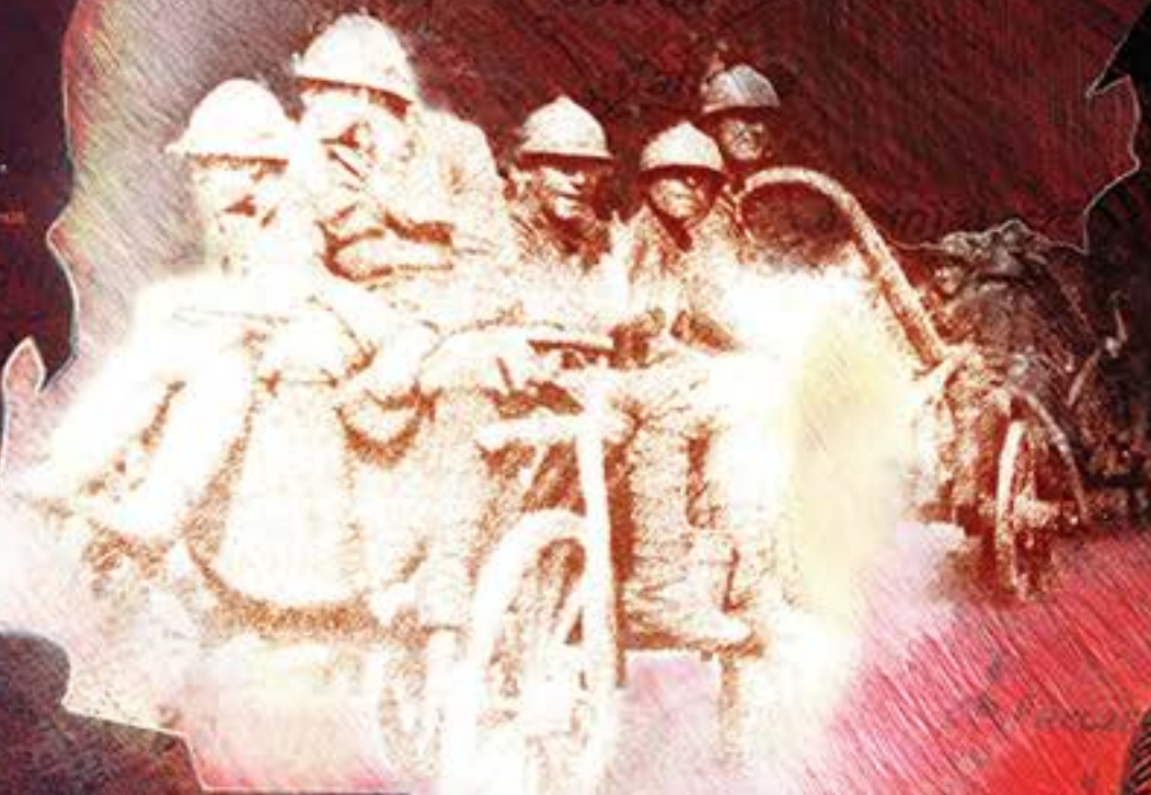
Soldiers of the 1st Pulaski Infantry Regiment during the Białystok offensive, August 1920.