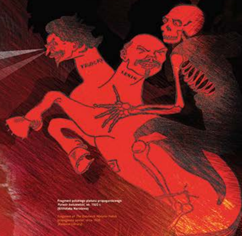
Fragment polskiego plakatu propagandowego Fundacja Józef Piłsudski, ok. 1920 r. Biblioteka Narodowa