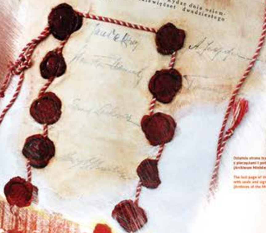
Detal strona traktatu rydzkiego z pieczęciami i podpisami stron

Wymiana dokumentów ratyfikacyjnych nastąpiła w Mińsku w terminie określonym pięć dni od dnia podpisania Traktatu niniejszego. Węzłowie, gdzie w Traktacie niniejszym lub w jego załącznikach wymieniono się jako termin chwili ratyfikacji Traktatu Pokojowego, uznano się przez to chwilę wymiany dokumentów ratyfikacyjnych. Na dowód czego pełnomocnicy ubokładających się stron własnoręcznie podpisali Traktat niniejszy i opatrzyli go swymi pieczęciami. Sporządzono i podpisano w Rydze dnia osiem- nastego marca tysiąc dziewięćset dwudziestego pierwszego roku.