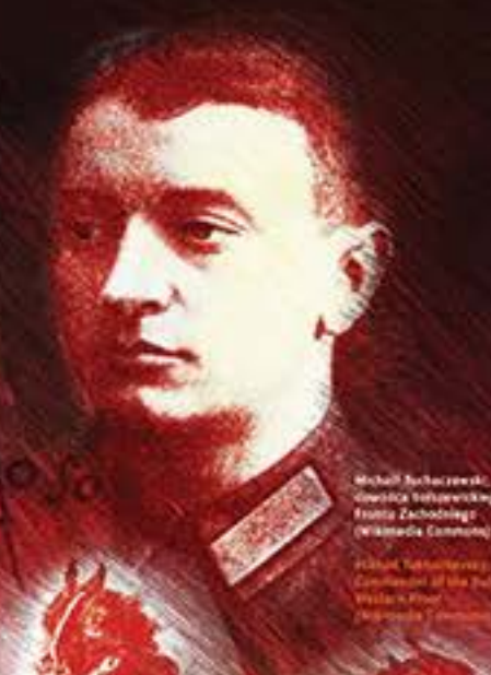
Michał Tuchaczewski, dowódca Armii Czerwonej, Frontu Zachodniego