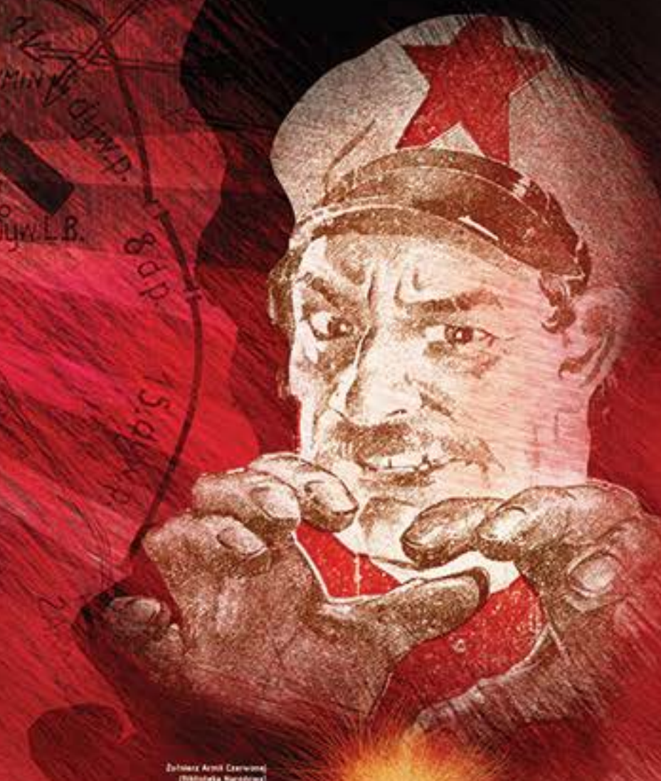
Żołnierz Armii Czerwonej