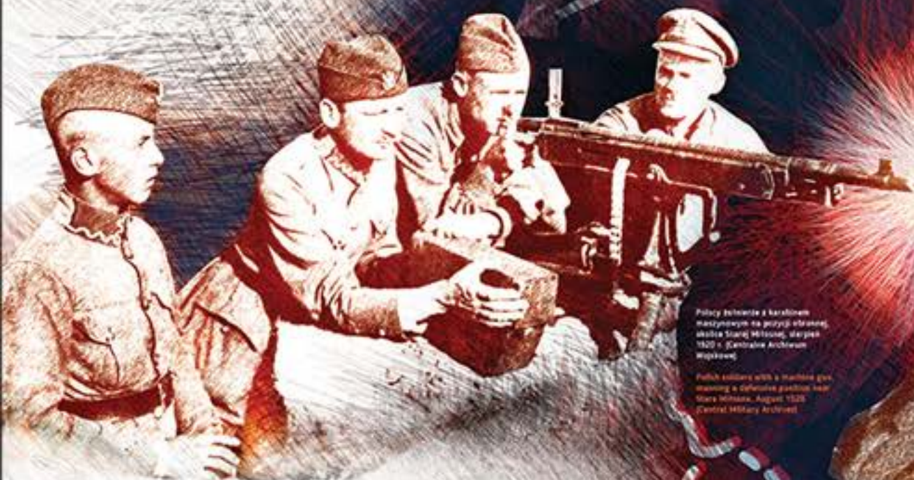
Polacy żołnierze z karabinem maszynowym na polu bitwy, okolice Starej Miśsi, sierpień 1920 r.