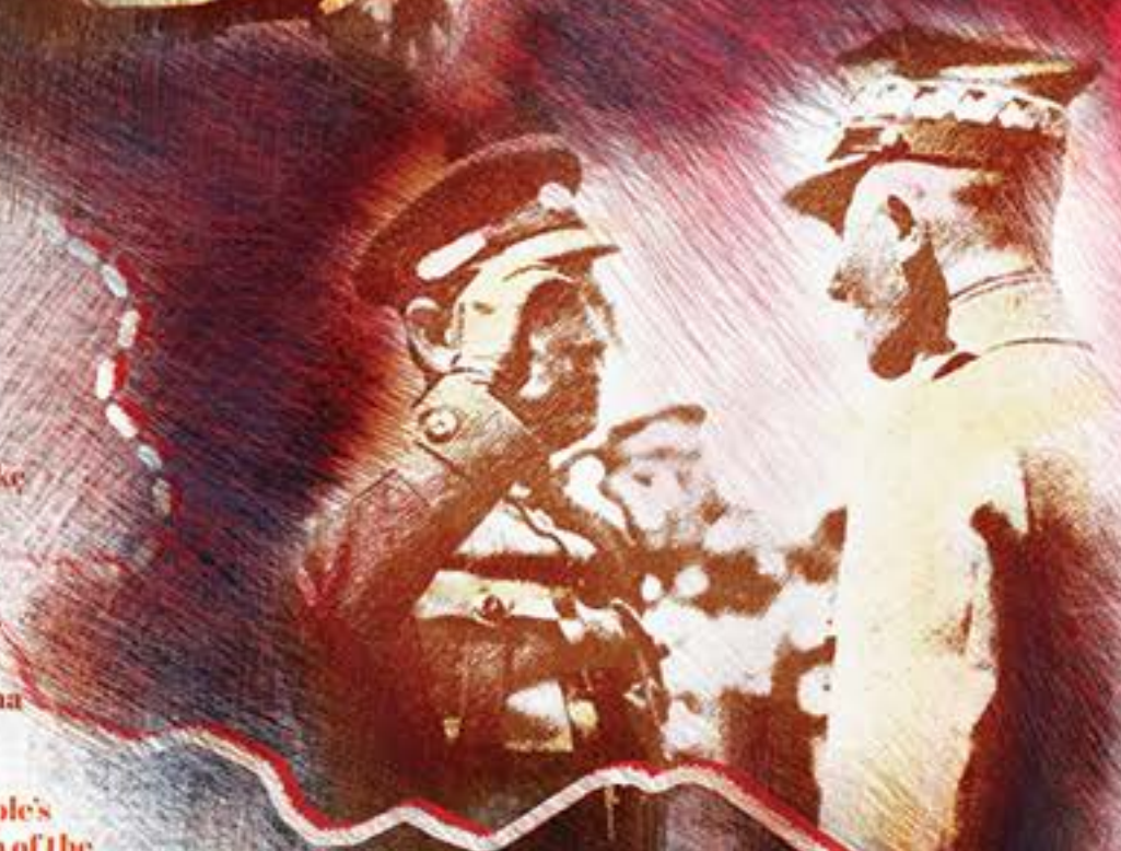
Wspólna defilada wojsk URL, Symon Petlura i dowódca 3 Armii gen. Edward Rydz-Śmigły w Kijowie, maj 1920 r.

The common Bolshevik threat brought Poland and the Ukrainian People's Republic closer together, with the latter suffering from the occupation of the majority of its territory by the Red Army. On 21 April 1920, Józef Piłsudski formed an alliance with the President of the Ukrainian People's Republic, Ataman Symon Petliura. Four days later the Polish and Ukrainian troops with quick strike broke through the Bolshevik defence on the southern front and took over most of the right bank of Ukraine in a daring attack. On 9 May, a joint parade of allied troops took place in Kiev.