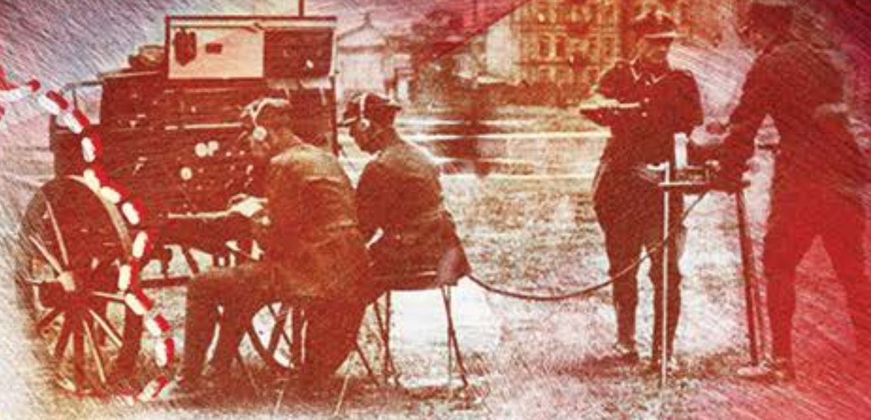
Polscy żołnierze z radiostacją dywizyjną E-10, ok. 1919-1924 r.