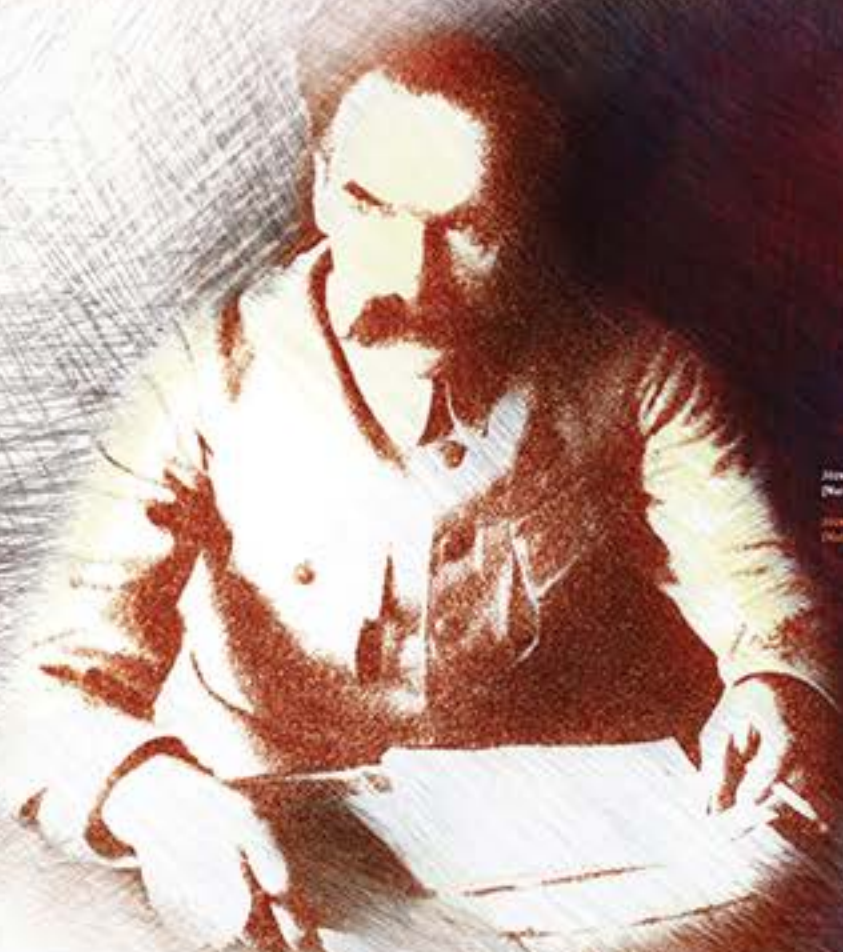
Józef Piłsudski w Belwederze, ok. 1920 r.