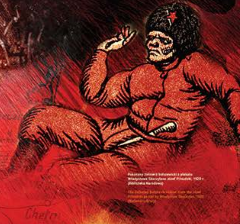
Polakami żołnierza bolszewickiego i generała Władysława Skarżyńskiego Józef Piłsudski, 1920 r.