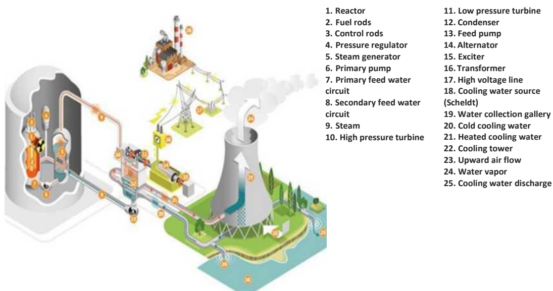
Rysunek 2: Eksploatacja elektrowni jądrowej z (od lewej) budynkiem reaktora, maszynownią i obiegiem chłodzenia.

Doel 4 i Tihange 3 to reaktory tzw. wodne ciśnieniowe (PWR - Pressurised Water Reactor). Reaktor taki zazwyczaj składa się z trzech przedziałów z trzema oddzielnymi obiegami: budynku reaktora z obiegiem pierwotnym, maszynowni z obiegiem wtórnym oraz obiegiem chłodzenia tworzącym obieg trzeci (rys. 2).