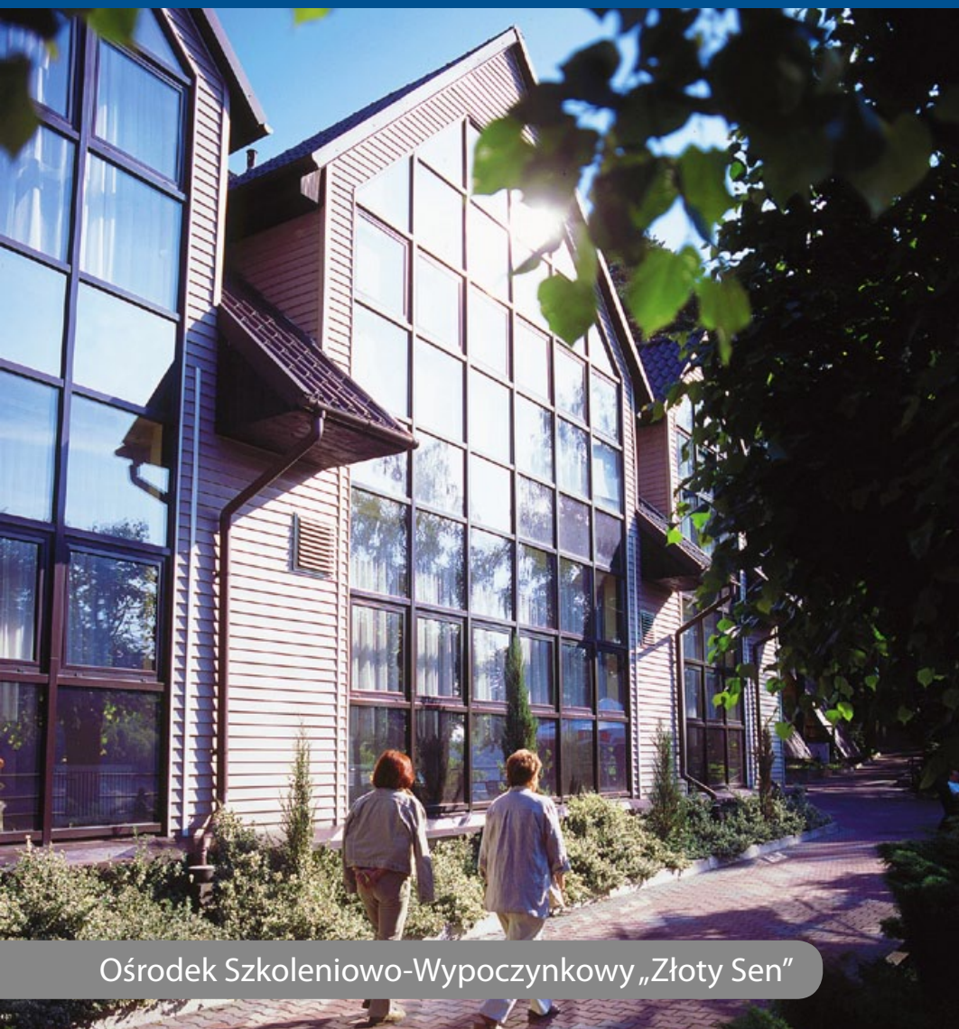
Ośrodek Szkoleniowo-Wypoczynkowy „Złoty Sen”