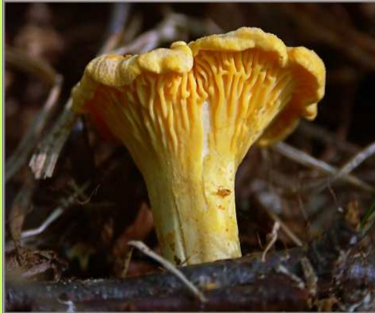
PIEPRZNIK JADALNY (KURKA)