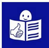
Rys 3. Symbol tekstu łatwego do czytania „easy-to-read”

Oznaczenie tekstu łatwego do czytania (ETR)