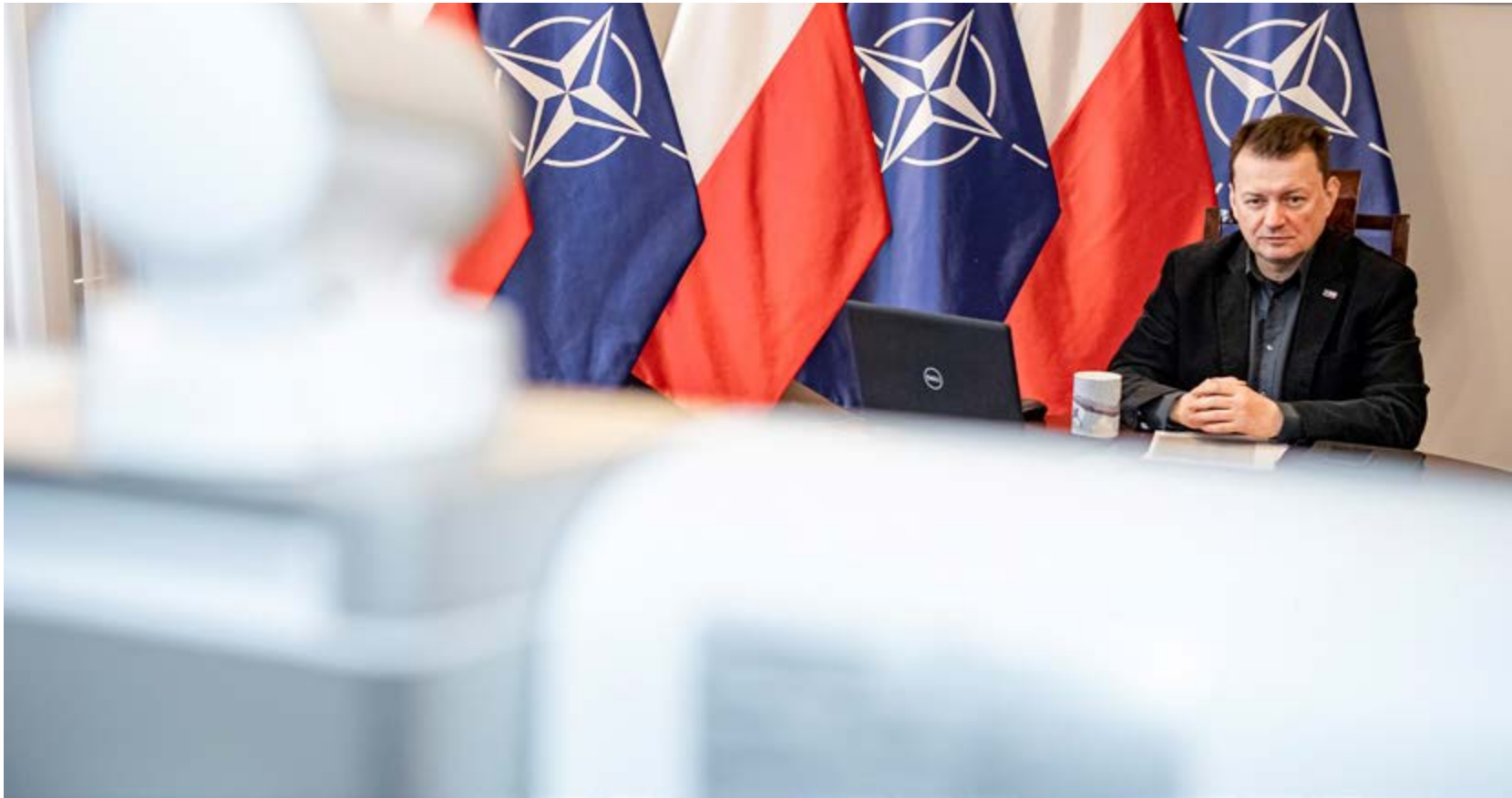
Mariusz Błaszczak, Minister Obrony Narodowej