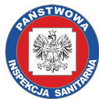
Główny Inspektorat Sanitarny