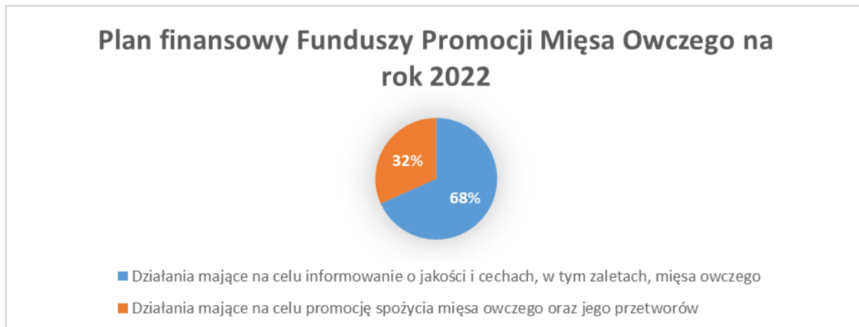
Wykres nr 3. Struktura Planu finansowego FPMO na rok 2022

W Planie finansowym FPMO na rok 2022 na zadania zgodne z celami funduszu promocji mięsa owczego przeznaczono kwotę 23 206,99 PLN .