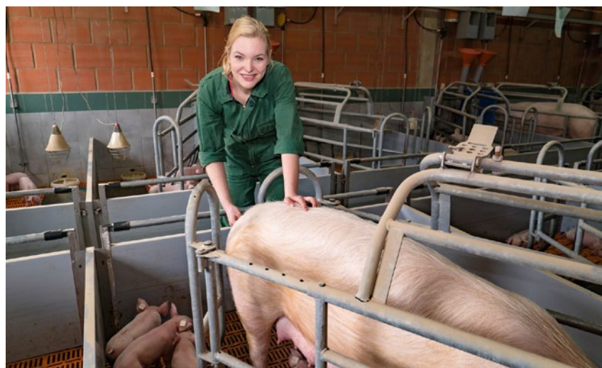
Pomoc wynosi 1000 zł do każdego urodzonego 10 prosiąt

Pomoc będzie udzielana na wniosek producenta rolnego, składany do biura powiatowego ARiMR od 1 do 30 kwietnia 2022 r. Pomoc będzie wypłacana do 30 czerwca 2022 r. Wniosek będzie prosty i będzie zawierał podstawowe informacje