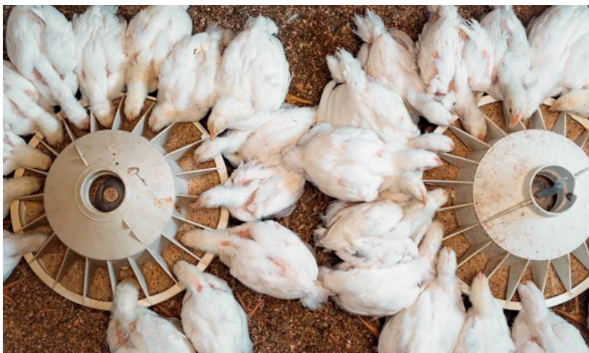
Wystąpienie grypy ptaków spowodowało trudną sytuację na rynku mięsa drobiowego

Wystąpienie grypy ptaków spowodowało trudną sytuację na rynku mięsa drobiowego. Podjęto prace dotyczące sporządzenia wniosku Rzeczypospolitej Polskiej do Komisji Europejskiej (KE) w sprawie zastosowania nadzwyczajnych środków wsparcia dla sektora drobiarskiego w Polsce z tytułu wystąpienia wysoce zjadliwej grypy u drobiu w latach 2019–2021.