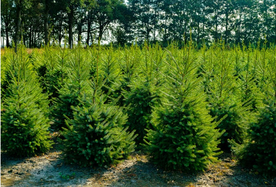
Interwencje leśne i zadrzewieniowe wdrażane będą w ramach II filaru WPR