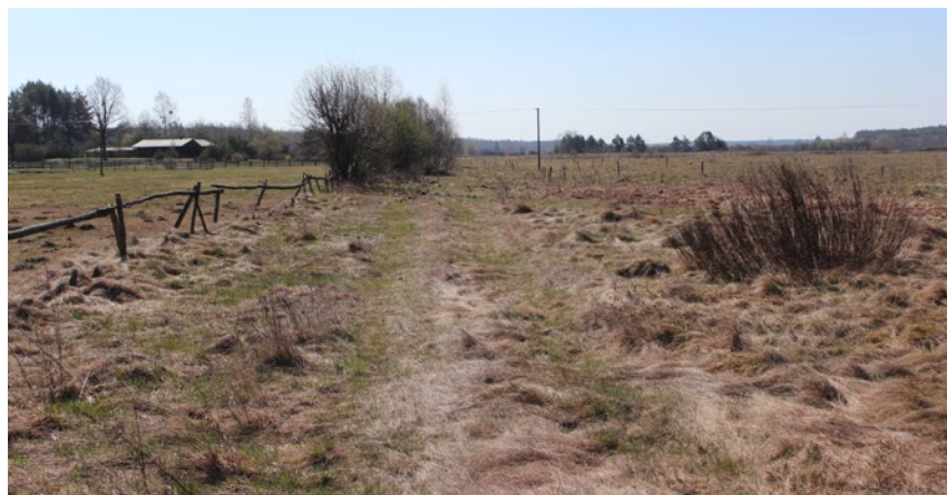
Pierwsze miejsce wśród projektów scaleń gruntów przyznano zespołowi geodetów Wojewódzkiego Biura Geodezji w Białymstoku za wykonanie projektu scalenia gruntów – obiekt Eliaszuki i inne