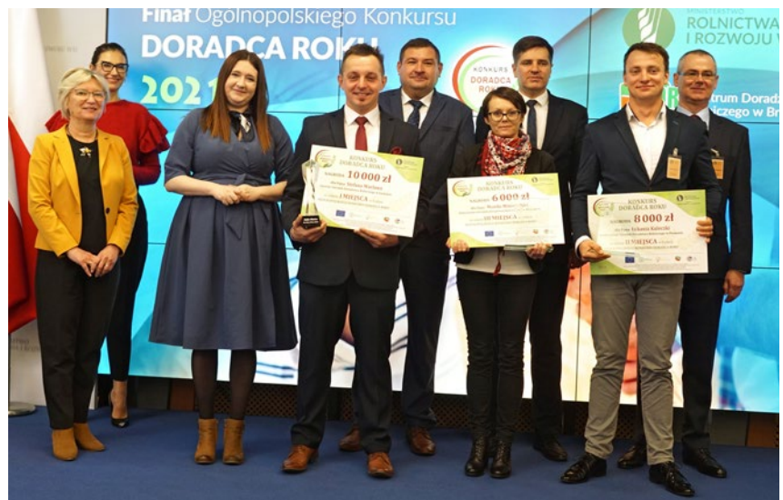
Uroczystość wręczenia nagród laureatom konkursu Doradca Roku 2021