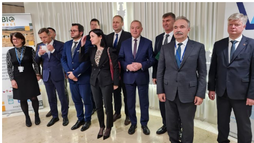
Aktualna sytuacja na rynkach rolnych była głównym tematem listopadowego posiedzenia Agrifish

podstawowych środków produkcji, w tym pasz. Uniemożliwia to prowadzenie opłacalnej produkcji i skutkuje upadaniem gospodarstw. Wdrożona w Polsce pomoc krajowa jest niewystarczająca w sytuacji przedłużającego się okresu deko-