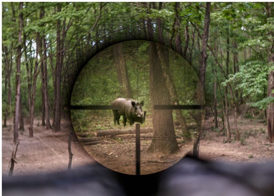
Osoby uczestniczące w polowaniu lub odstrzale sanitarnym, podczas którego pozyskano dziki, przez co najmniej 48 godzin po jego zakończeniu nie mogą mieć jakiegokolwiek kontaktu z utrzymywanymi świniami

Kontrolę sprawdzającą w przypadku wykrytych uchybień można potraktować jako spełniającą wymóg, jeśli odbyła się z uwzględnieniem nakazanego interwału czasowego;