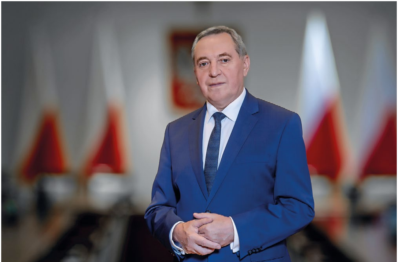
HENRYK KOWALCZYK, wiceprezes Rady Ministrów, minister rolnictwa i rozwoju wsi