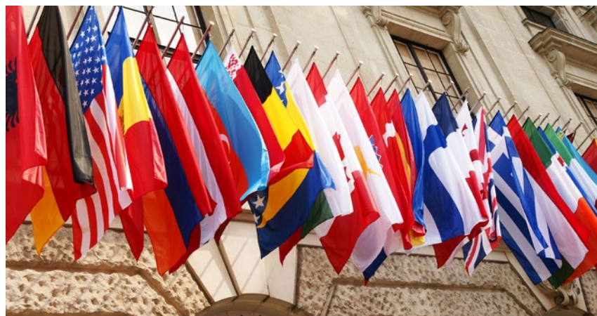
Obecnie do OECD należy 37 państw

wydarzenia, które pozwalają na wymianę informacji i opinii z szerokim gronem interesariuszy, również