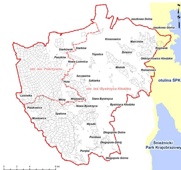
Ryc. 1. Lokalizacja otuliny Śnieżnickiego Parku Krajobrazowego (ŚPK) w zasięgu terytorialnym Nadleśnictwa Bystrzyca Kłodzka