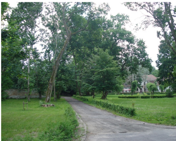
Fot. 13. Założenie parkowe z XVIII wieku w Białej