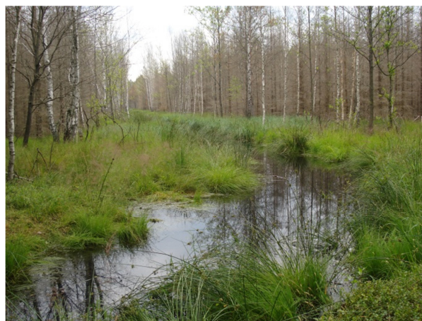
Fot. 10. Drzewostan zalany dzięki działalności bobra europejskiego - retencja (oddz. 404a)