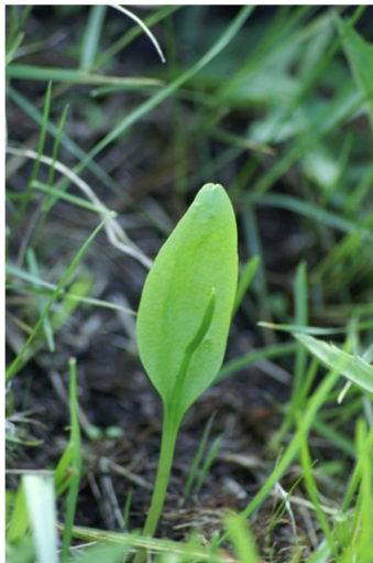
Fot. 21. Nasięźrzał pospolity Ophioglossum vulgatum – ochrona ścisła