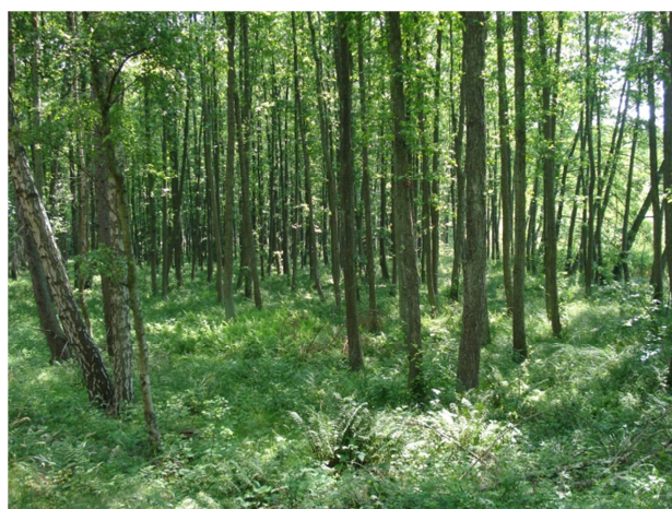
Fot. 12. Drzewostan olchowy zaliczony do tzw. „ostoi ksylobiontów” (oddz. 487b)