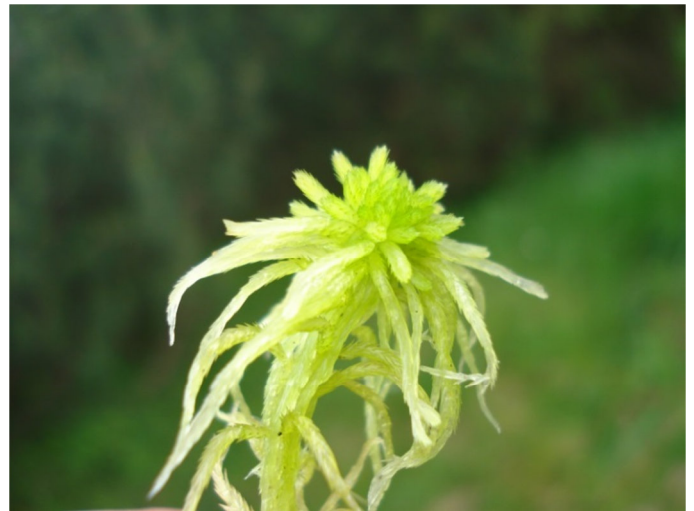
Fot. 22. Torfowiec kończysty Sphagnum fallax – ochrona częściowa