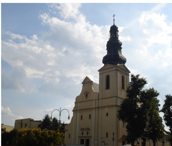
Fot. 15. Kościół pw. Św. Jana Chrzciciela w Trzciance