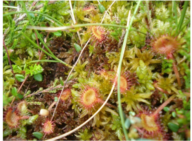
Fot. 20. Rosiczka okrągłolistna Drosera rotundifolia – ochrona ścisła