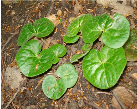
Fot. 19. Kopytnik pospolity Asarum europaeum – ochrona częściowa