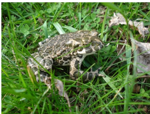
Fot. 23. Ropucha zielona Bufo viridis – ochrona ścisła