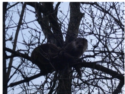
Fot. 24. Wydra Lutra lutra – ochrona ścisła 7