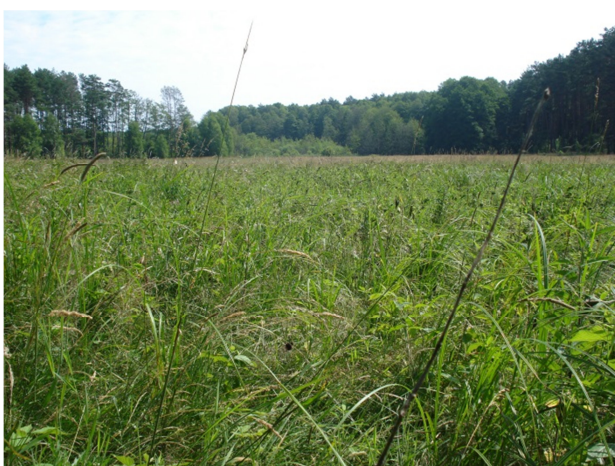
Fot. 11. Użytek ekologiczny „Nenufarowe Oczko III” (oddz. 489f)