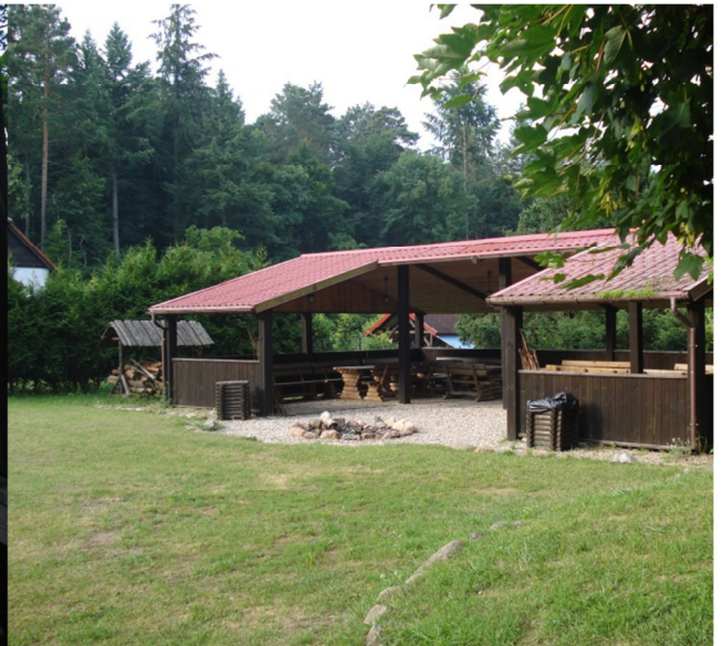
Fot. 4. Miejsce odpoczynku przy ścieżce „Nad Bukówką”