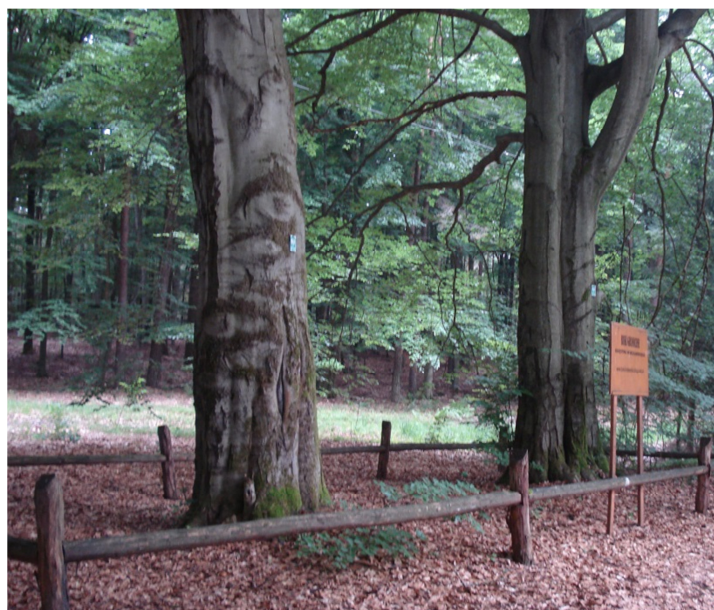
Fot. 18. Pomnik przyrody –grupa drzew „Buki Graniczne Księstwa Warszawskiego”