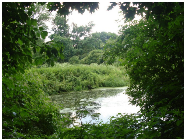
Fot. 14. Park w Białej – zarastający staw