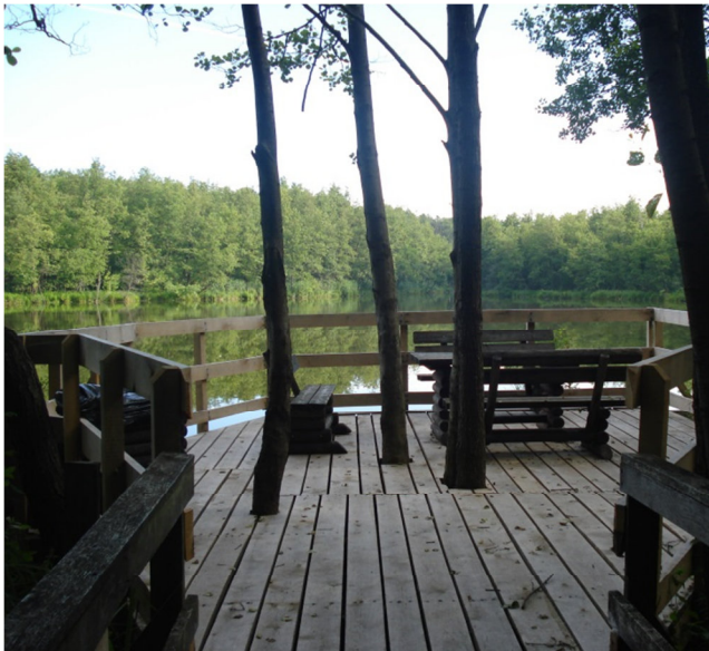
Fot. 3. Widok na Staw Rychlicki