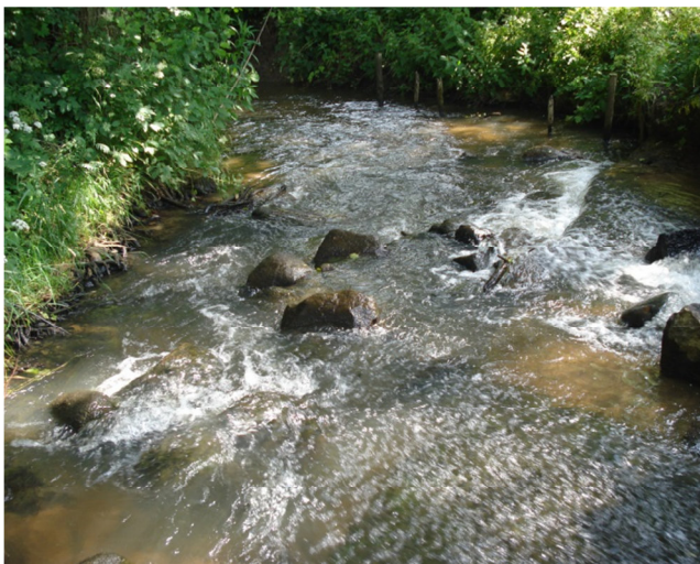
Fot. 5. Potok Łomnica