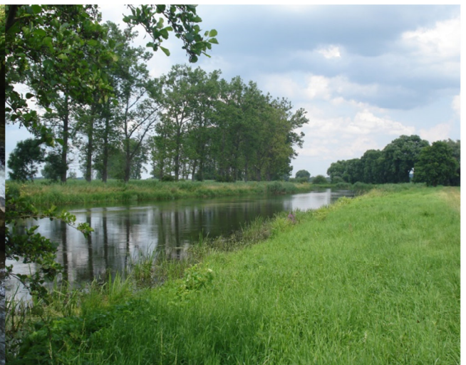
Fot. 6. Rzeka Noteć