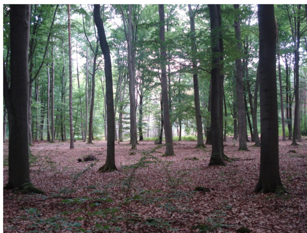
Fot. 8. Siedlisko przyrodnicze 9110 (oddz. 307m)