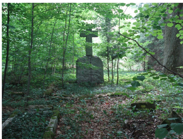
Fot. 16. Cmentarz z I połowy XIX w. wpisany do rejestru zabytków (oddz. 35b)