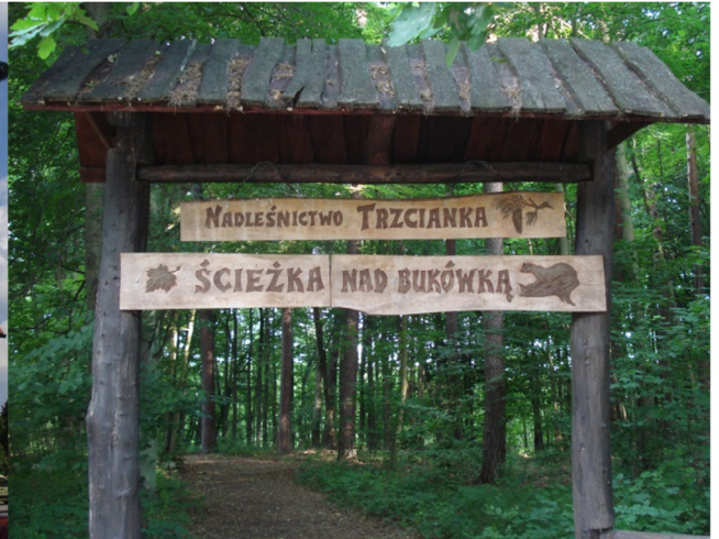
Fot. 2. Wejście na ścieżkę przyrodniczo-dydaktyczną „Nad Bukówką”