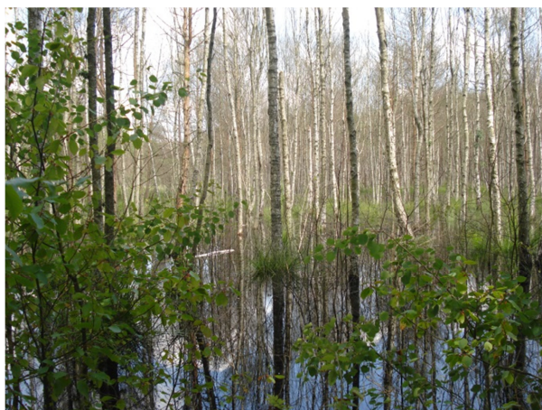
Fot. 9. Siedlisko przyrodnicze 91D0 (oddz. 310b)