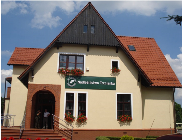
Fot. 1. Siedziba Nadleśnictwa Trzcianka