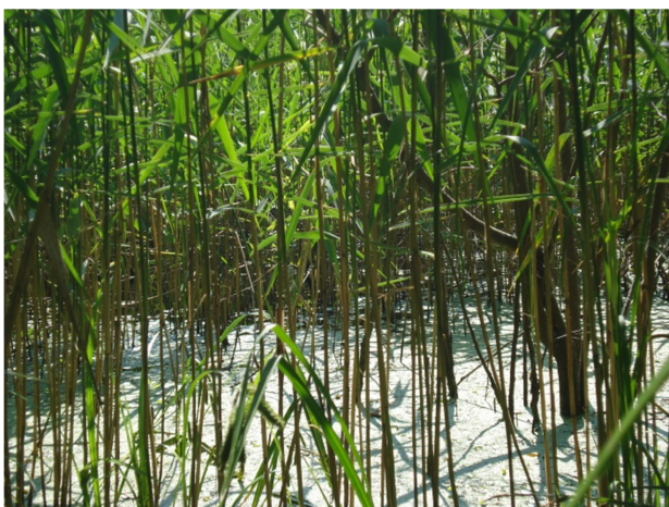
Fot. 7. Siedlisko przyrodnicze 3150 i użytek ekologiczny „Nenufarowe Oczko I” (oddz. 488a)