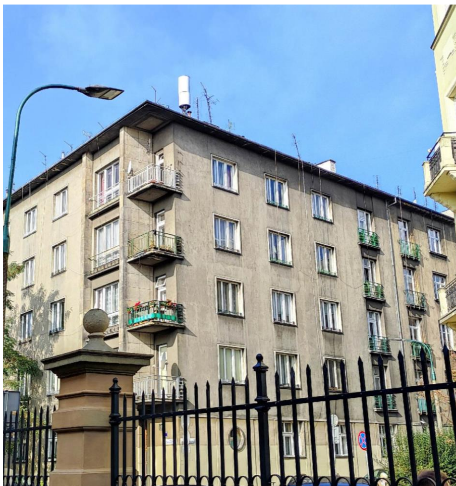
Fot. 1: Widoki anten stacji bazowej: ID: KRA0009, zlokalizowanej: ul. Batorego 9 Kraków