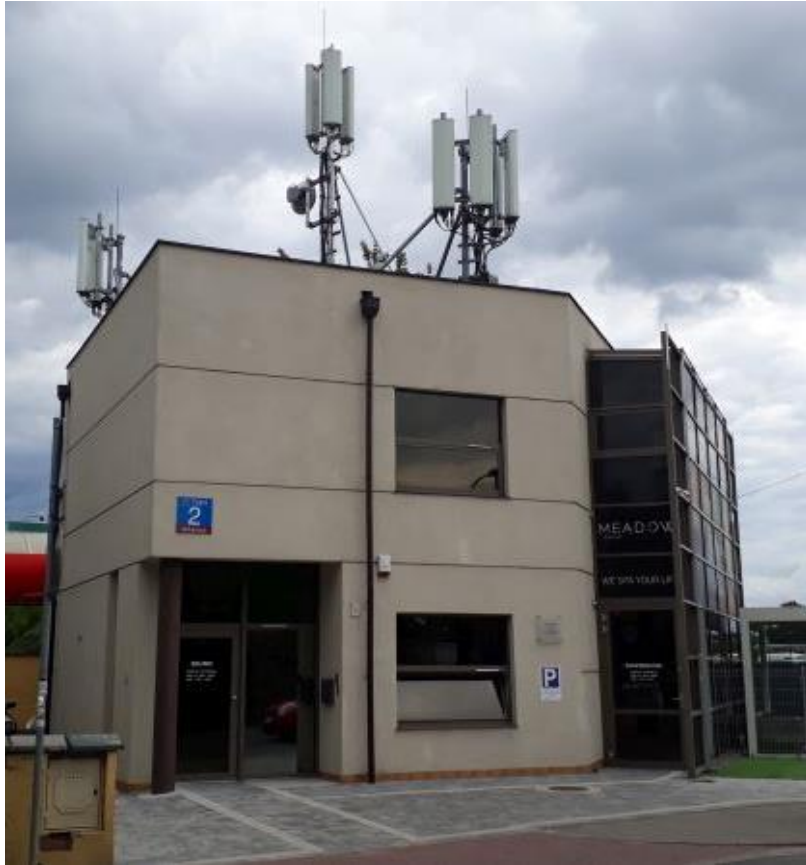
Fot. 1: Widok anten stacji bazowych: ID: 60038 (81593N!), ID: WAR1275A, zlokalizowanych pod adresem: ul. Vogla 2, 02-963 Warszawa.