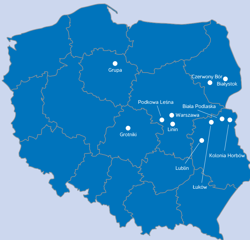
Mapa 1. Rozmieszczenie ośrodków dla cudzoziemców ubiegających się o nadanie statusu uchodźcy w Polsce