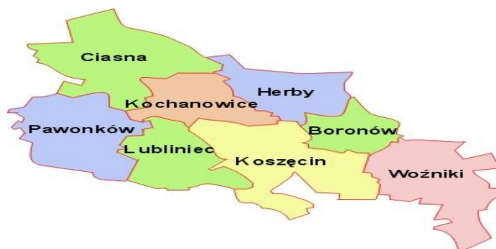
Rysunek Nr 1 Powiat lubliniecki z podziałem na gminy.

Wodą przeznaczoną do spożycia przez ludzi - nazywamy „wodę w stanie pierwotnym lub po uzdatnieniu, przeznaczoną do picia, przygotowywania żywności lub innych celów domowych, niezależnie od jej pochodzenia i od tego, czy jest dostarczana z sieci dystrybucyjnej, cystern, w butelkach lub pojemnikach” oraz - nazywamy „wodę wykorzystywaną przez przedsiębiorstwo produkcji żywności do wytwarzania, przetwarzania, konserwowania lub wprowadzania do obrotu produktów albo substancji przeznaczonych do spożycia przez ludzi” zgodnie z ustawą z dnia 20 lipca 2017 r. Prawo wodne (Dz. U. z 2021 r. poz. 2233 z późn. zm.). Warunki i zasady zbiorowego zaopatrzenia w wodę przeznaczoną do spożycia przez ludzi określa ustawa z dnia 7 czerwca 2001 roku o zbiorowym zaopatrzeniu w wodę i zbiorowym odprowadzaniu ścieków (Dz. U. z 2020 r. poz. 2028), natomiast wymagania, jakim powinna odpowiadać woda przeznaczona do spożycia przez ludzi zawarte są w rozporządzeniu Ministra Zdrowia z dnia 7 grudnia 2017 r. w sprawie jakości wody przeznaczonej do spożycia przez ludzi . (Dz. U. z 2017 r. poz. 2294).