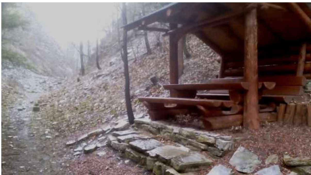
Fot.22. Stanowisko dokumentacyjne przyrody nieożywionej „Jasieniowa”.

Celem ustanowienia stanowiska dokumentacyjnego jest zachowanie ze względów przyrodniczych, naukowych, dydaktycznych i krajobrazowych unikatowych odsłoneń fliszu karpackiego, w tym wapieni cieszyńskich, a także stanowisk rzadkich gatunków roślin i zwierząt.