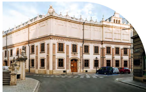
Muzeum Książąt Czartoryskich – Oddział Muzeum Narodowego w Krakowie