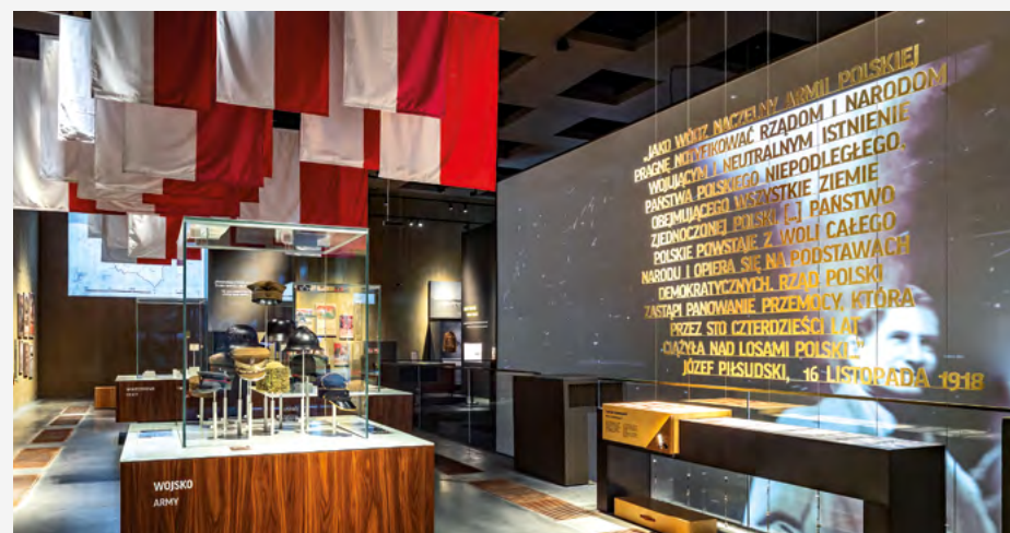
Muzeum Józefa Piłsudskiego w Sulejówku