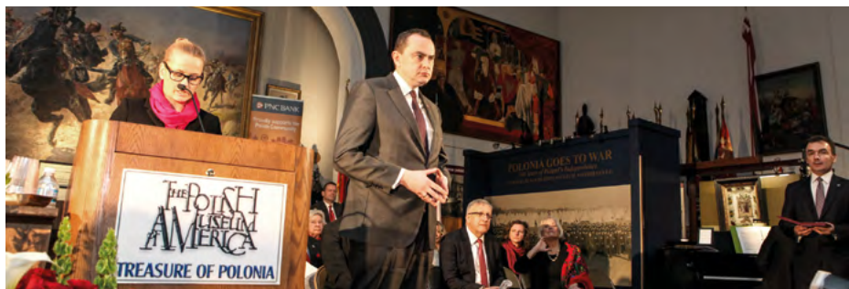
Muzeum Polskie w Ameryce – obchody Dnia Pułaskiego z udziałem polskiej delegacji