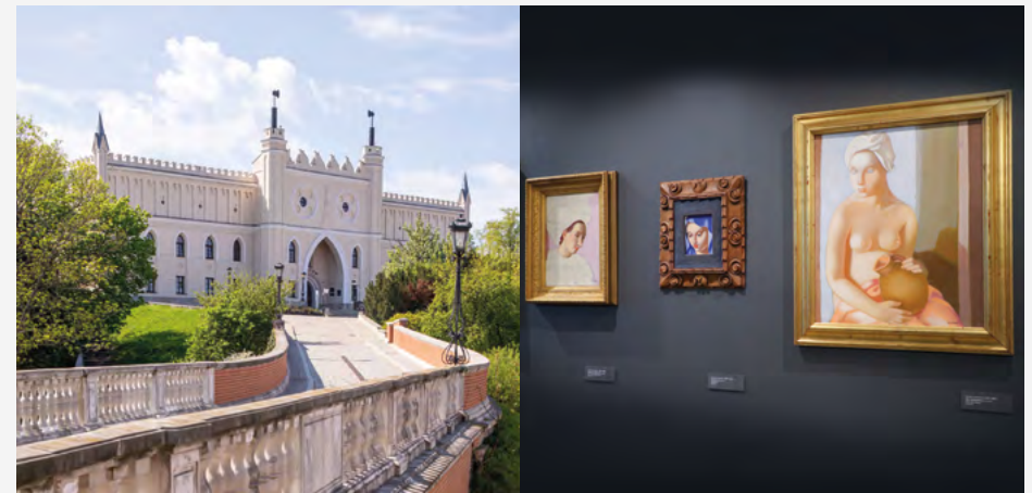
Muzeum Narodowe w Lublinie, fot. Maciej Niećko