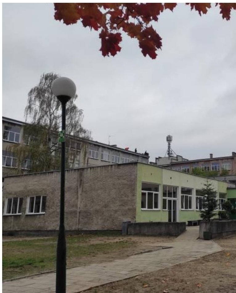
Fot. 1: Widoki anten stacji bazowej: ID: BT31758, zlokalizowanej: ul. Stanisława Wyspiańskiego 21, Zielona Góra