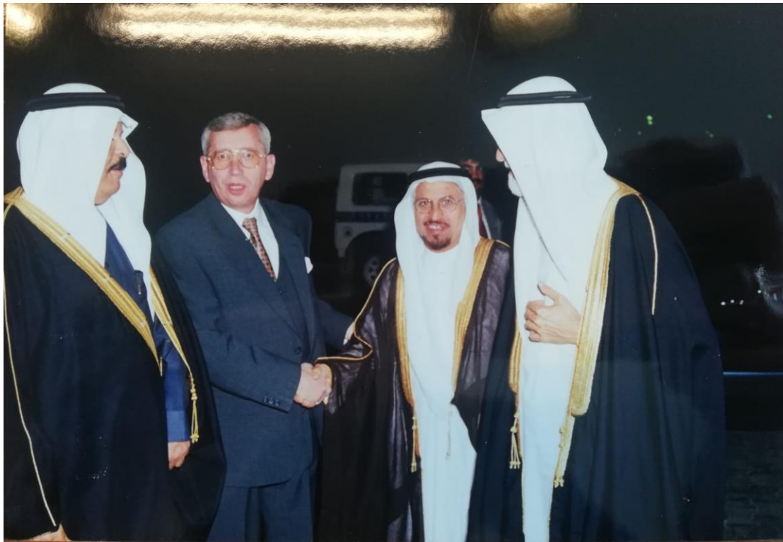
Pierwszy Ambasador RP w Rijadzie Krzysztof Płomiński First Ambassador of the Republic of Poland in Riyadh