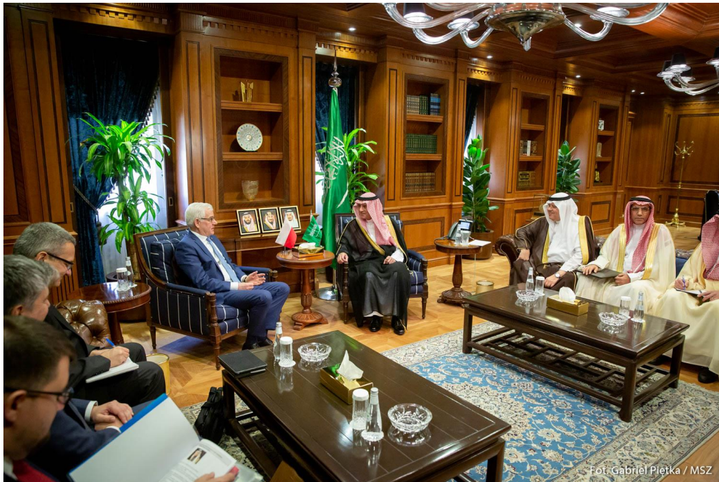
Spotkanie Ministra Spraw Zagranicznych RP dr Jacka Czaputowicza z Ministrem Stanu ds. Zagranicznych KAS Adilem Al-Dzubajrem, Rijad, 23.04.2019