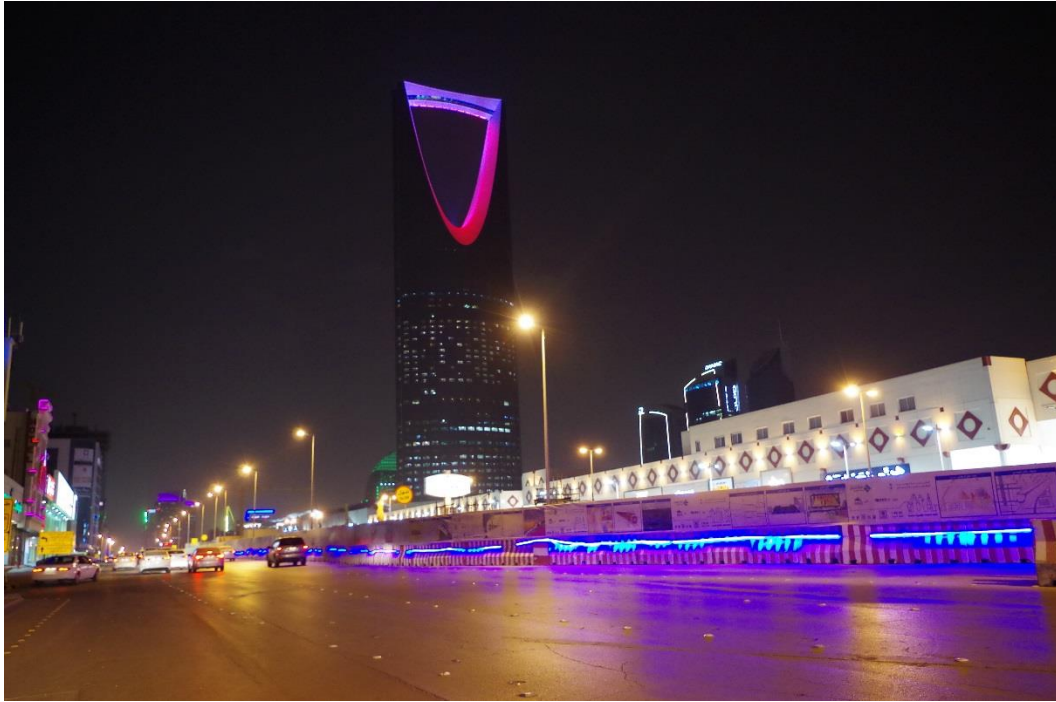
Podświetlenie wieżowca Kingdom Tower z okazji Święta Konstytucji 3-go Maja, Rijad, 03.05.2019 r.

Illumination of the Kingdom Tower Skyscraper on the occasion of the Polish National Day – 3 rd May Constitution Day, Riyadh, May 3 rd 2019