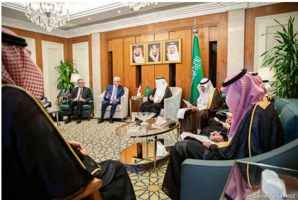
Spotkanie Ministra Spraw Zagranicznych RP dr Jacka Czaputowicza z Ministrem Spraw Zagranicznych KAS dr Ibrahimen Al-Assaf, Rijad, 23.04.2019