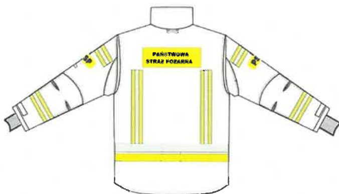
Przykładowy widok kurtki